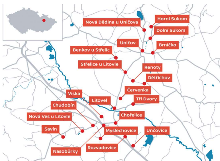
Obrázek 2 – Uzavřené obce v Olomouckém kraji

Důvodem uzavření a zabránění dalšímu šíření byl výskyt ohnisek nákazy SARS-CoV-2. Opatření bylo vydáno Krajskou hygienickou stanicí s platností od 16. 3. 2020 na dobu 14 dní. Na uzavření se podílel i kraj, který byl v neustálém kontaktu s uzavřenými obcemi a složkami IZS. Občané 21 obcí (Obrázek 2) žijící v těchto oblastech měli zákaz opustit území obce a pohybovat se mimo jejich bydliště. Kvůli tomu byly veškeré dálniční sjezdy a hranice oblastí hlídány a kontrolovány Armádou ČR ve spolupráci s Policií ČR. Na tuto činnost bylo vyčleněno 160 policistů a 475 vojáků. Výjimkou byly pouze cesty do zaměstnání, k lékaři nebo pro nákup základních potravin. Bylo zřízeno i mobilní odběrové místo, kde odebrání vzorků měl na starosti odběrový tým v podobě 15 příslušníků Hasičského záchranného sboru Olomouckého kraje. Dalších 27 hasičů bylo vyškolen na pomoc Krajské hygienické stanici při trasování dalších potenciálních nakažených osob. Pro občany byla zřízena polní ambulance na Nových Zámcích u města Litovel, která poskytovala zdravotnickou péči pro osoby se špatným zdravotním stavem, nevztahující se na onemocnění koronavirem (Hložková, 2021).