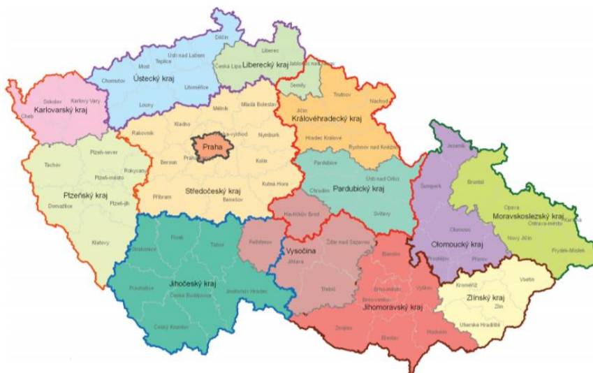
Obrázek 4 Předchozí stav

č. 5), která měly vzniknout nejpozději do 1. 1. 2012. 27 Od 1. ledna 2010 má policie pro každý samosprávný kraj krajské ředitelství, celkem je čtrnáct krajských ředitelství.