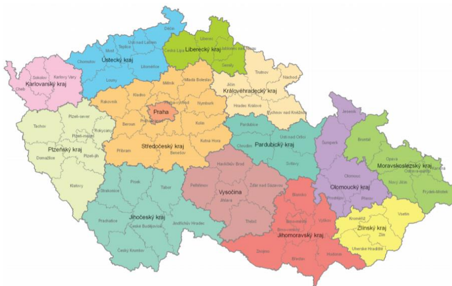
Obrázek 5 Současný stav