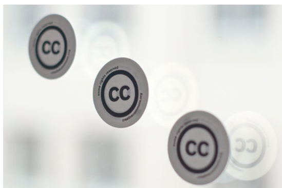
Obrázek 1: cc (Alexanderson, 2012)

Obrázek s názvem „cc“ stažený z Flickru + odkaz: