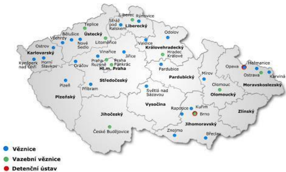
Obrázek 1 - Mapa věznic v ČR (O base.cz 2017)