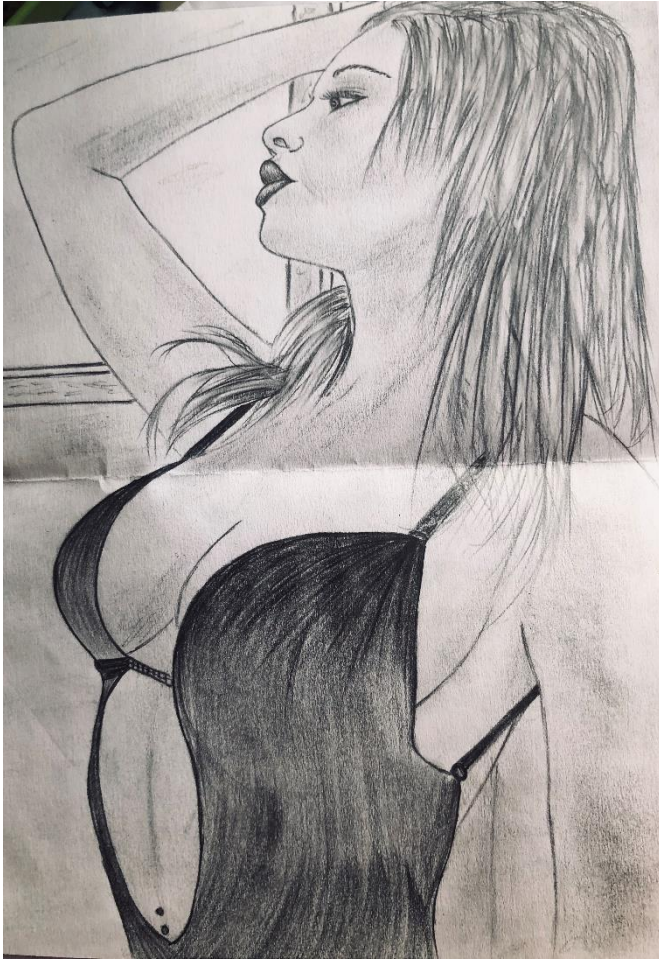
Obrázek 4 -Malba z věznice (V. V. Jiroušková 2012)