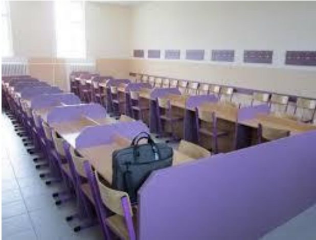
Obrázek 3 - Návštěvní místnost (Šabatová 2015)

7. Jakou práci jsi ve vězení vykonával a jaký byl plat?