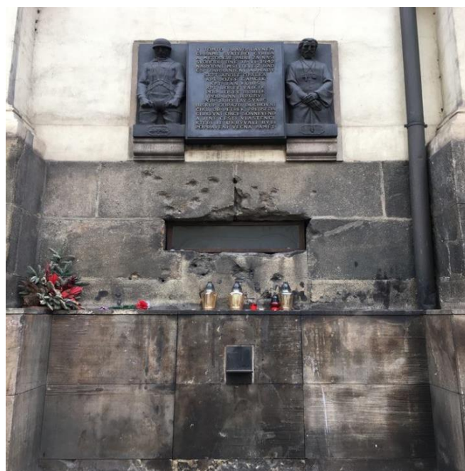
Obrázek č. 13 – Pamětní deska na chrámu Cyrila a Metoděje pro padlé parašutisty (T. Vacek 2019)