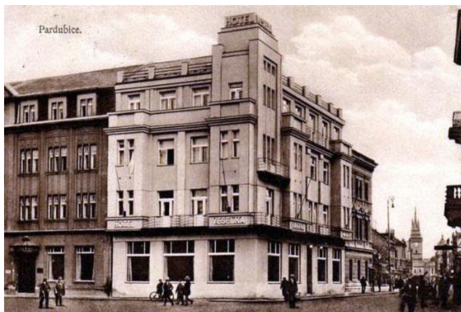
Obrázek č. 3 - Hotel Veselka (Magistrát města Pardubic 2012)