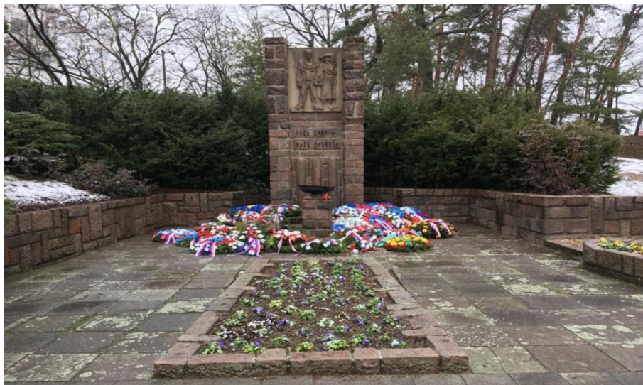
Obrázek č. 10 Popraviště u zámku

Na popravišti se také 9. ledna 2019 konala pietní akce spojená s operací SILVER A, které jsem se účastnil. Tato pietní vzpomínka nesla jméno „SILVER A v paměti tří generací“ (Ležáky-memorial 2015).