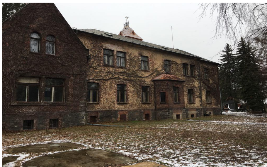
Obrázek č. 9 – Zámeček v Pardubicích (T. Vacek 2019)

Poblíž zámečku leží i popraviště, kde byli popravováni lidé (Kotyk 2015). „ Myslím si, že všech 194 lidí, kteří byli popraveni na popravišti, by měli být známí, měli by být známé jejich fotky, jejich jména, a neměli by být zapomenuti. Hlavně mladí lidé by se měli zamyslet nad tím vzorem, který tu ty lidi zanechali. Zanechali tu nadčasový vzor Československého národa. Je to historie a historie se bude opakovat vždycky. Tento morální odkaz je prostě hrozně důležitý. Všichni lidé, kteří se takto zachovali a položili život za nějaký vyšší smysl, který ta svoboda vždycky musí sebou přinést, takže odkaz SILVER A je ohromný “ (pan Vondrka).