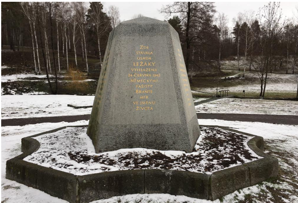
Obrázek č. 8 – Památník v Ležákách

„O pietní místo se nyní stará organizace Památník Ležáky. Dříve se o pietní místo starala obec Miřetice, ale z finančních důvodů to přenechala Památníku Ležáky“ (ZPL).