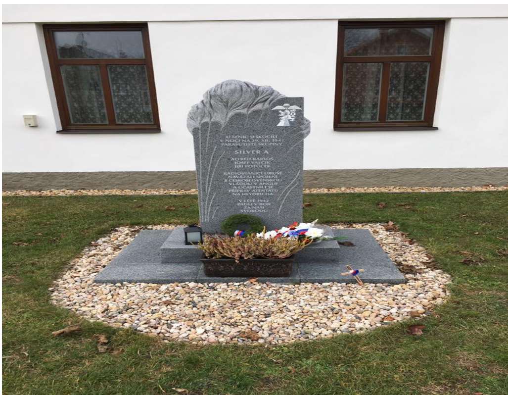
Obrázek č. 2 – Památník v Senicích (T. Vacek 2019)

V obci Senice se dne 23.6 2018 pořádala vzpomínková akce na počest operace SILVER A (Senice 2018). Této vzpomínkové akce jsem se účastnil, podle místních tato akce pomáhá v Senicích udržovat jejich místní identitu a všechny je to sblízuje, protože mají něco společného. Je to událost, kde se většina obyvatelů sejde, a společně zavzpomínají na staré hrdiny, kteří položili život za naši zem a svobodu.