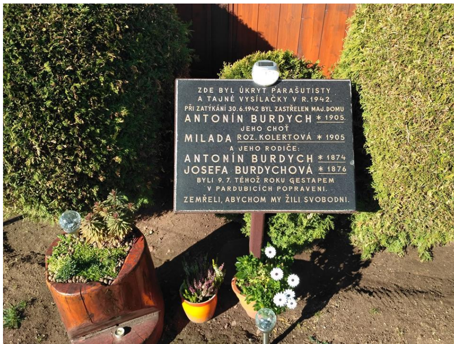
Obrázek č. 6 – Pamětní deska u domu Burdychových (T. Vacek 2018)

Dále můžeme v Končínách vidět rodinný dům Burdychových, kde se Jiří Potůček schovával. A u rodinného domu je malá pamětní deska (pan Burdych).