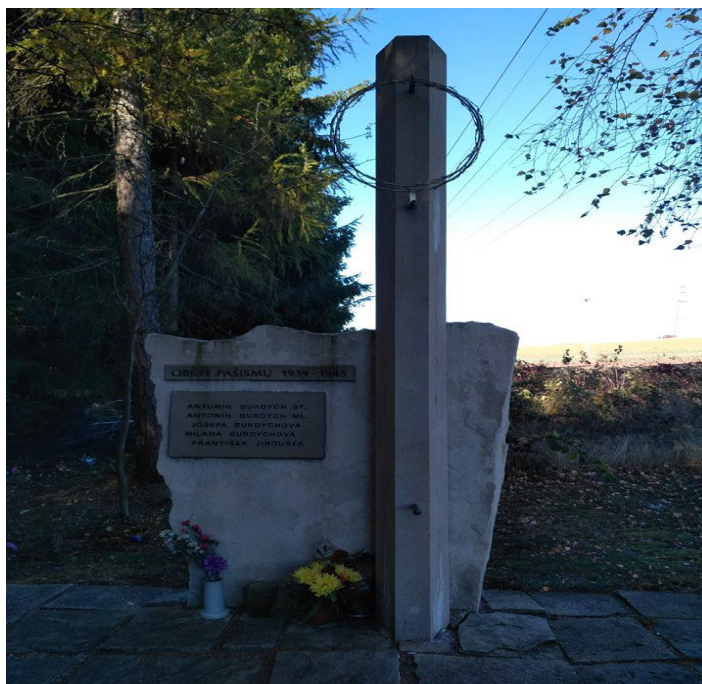
Obrázek č. 7 – Pomník rodině Burdychových na místě postřelení otce pana Burdycha

Nedaleko domu, vedle lesa, se nachází i pomník, kde byl postřelen otec pana Burdycha. Otec pana Burdycha byl postřelen, když utíkal, před Gestapem, aby varoval Potůčka. „Jsem rád, že toto místo existuje, je tu dokonce i krabička s keškou 3 , díky které sem zavítá spousta lidí“ (pan Burdych).