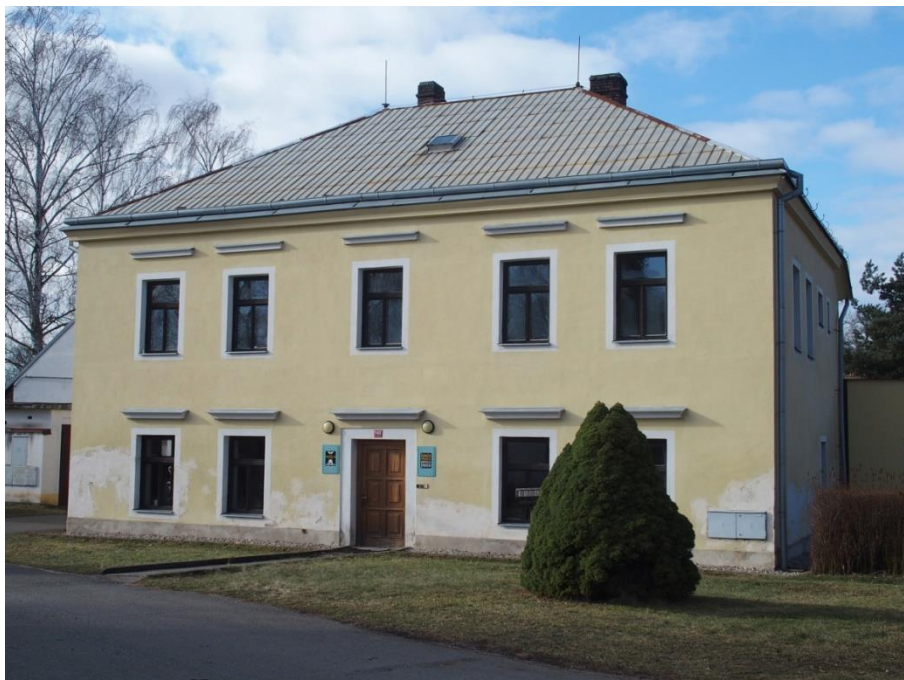
Obrázek č. 4 – Rybníční hospodářství