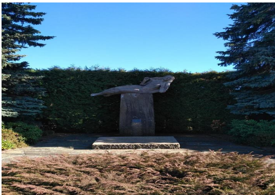
Obrázek č. 5 – Pomník ležící dívky na Bohdašíně (T. Vacek 2018)

V Bohdašíně je postavený pomník s Ležící dívkou. Toto dílo je dělané podle Josefa Čapka a znamená to „Dívka unášena fašistickým větrem a pod tím je takový kůl, co znamená vykřičník. Pod ním je pamětní deska, kde jsou jména lidí, kteří byli popraveni poslední den na Zámečku v Pardubicích, a jméno Jiřího Potůčka a jeho vraha“ (pan Burdych).