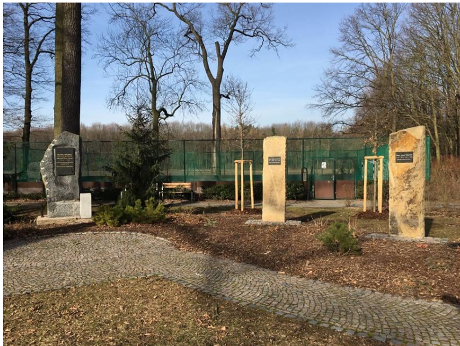
Obrázek č. 11 Lesopark Jiřího Potůčka v Pardubicích – Trnové (T. Vacek 2019)

Rozhodl jsem se tedy osobně toto místo během svého výzkumu navštívit. Zeptal jsem se nakonec dohromady 10 žen, které tam byly na procházce se svými dětmi, a pouze 3 z nich věděly, co se v tomto lesoparku stalo.