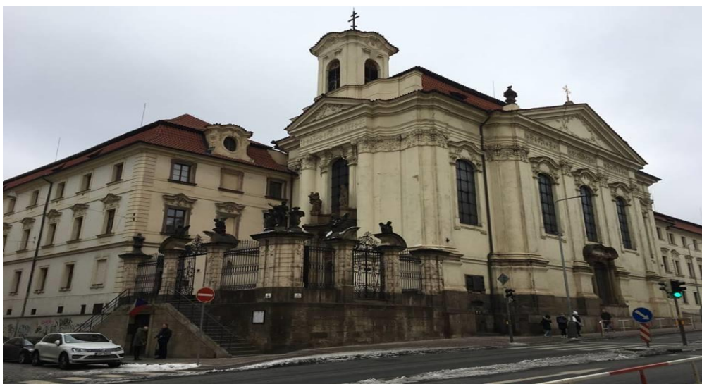
Obrázek č. 12 - Chrám Cyrila a Metoděje (T. Vacek 2019)

památník hrdinů. Expozice vás seznámí s atentátem na Heydricha, s operací ANTHROPOID, s výsadkem SILVER A, který jim pomáhal a jinými okolnostmi, které s tím souvisely. Od roku 1945 se tu každý rok, 18. června v 10 hodin dopoledne, koná pietní akt (Pich a Pich 2018). Když jsem vešel dovnitř krypty, zamrazilo mě v zádech, měl jsem pocit jako by se zde zastavil čas. Na venkovní stěně chrámu ještě můžeme vidět stopy po kulkách a malé okénko, kudy do krypty hasiči vlévali vodu (Hlavsová 2018).