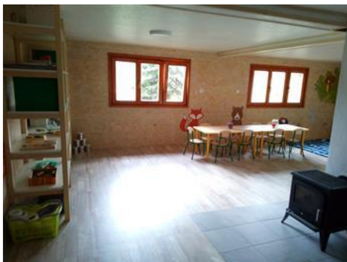
Obrázek 7: Lesní chaloupka

Letokruh má lesní chaloupku, v které je dostatek prostoru na odpočinek a hry při velmi nepříznivém počasí viz obrázek 7. Teplo zajišťují kamna na dřevo.