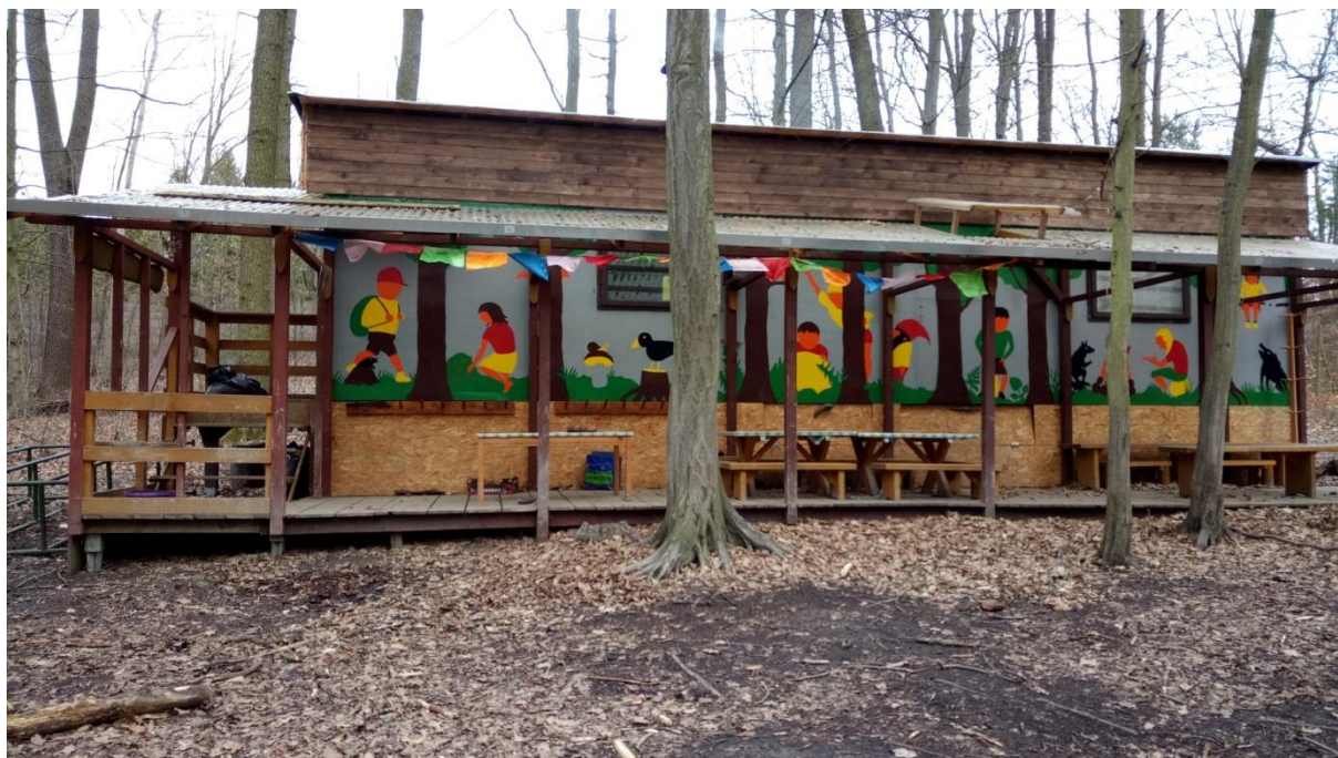
Obrázek 6: Maringotka pohled z boku