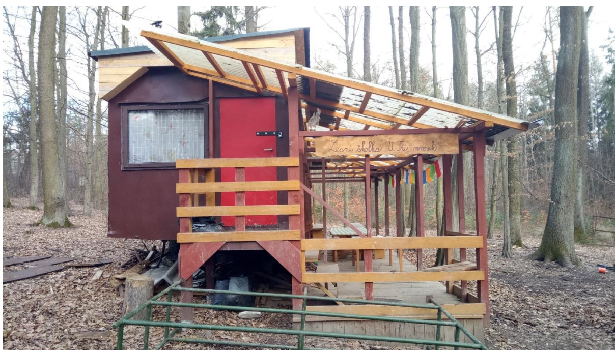
Obrázek 5: Maringotka

V září roku 2014 bylo postaveno další zázemí, a to přímo v lese v podobě maringotky, viz obrázek 5 a 6, a to díky podpoře Královéhradeckého kraje.