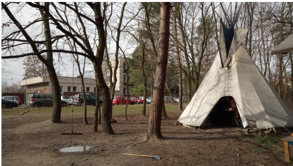
Obrázek 4: Týpí