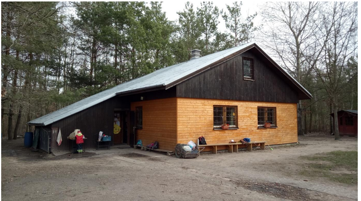
Obrázek 2: Klubovna LK U tří veerek