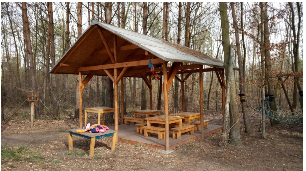
Obrázek 3: Altán

Na zahradě se nachází altán viz obrázek 3, kde při příznivém počasí stolují, anebo mají k dispozici vytápěné typí pro svačiny a různé aktivity v zimě. Dále v zahradě je pískoviště, vrbový stromeček a také několik záhonů, kde se společně starají o bylinky a zeleninu.