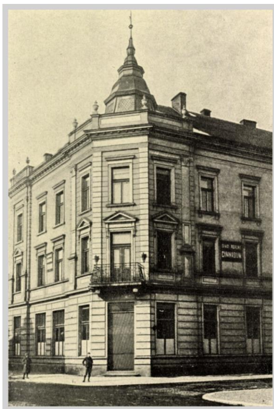
Obr. č. 16: Budova bývalého Dívčího reálného gymnázia, současnost. 256