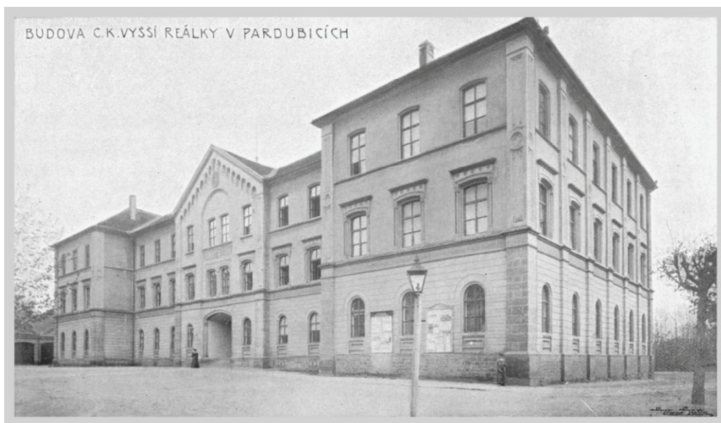
Obr. č. 14: Budova bývalé Vyšší reálné školy chlapecké, současnost. 254