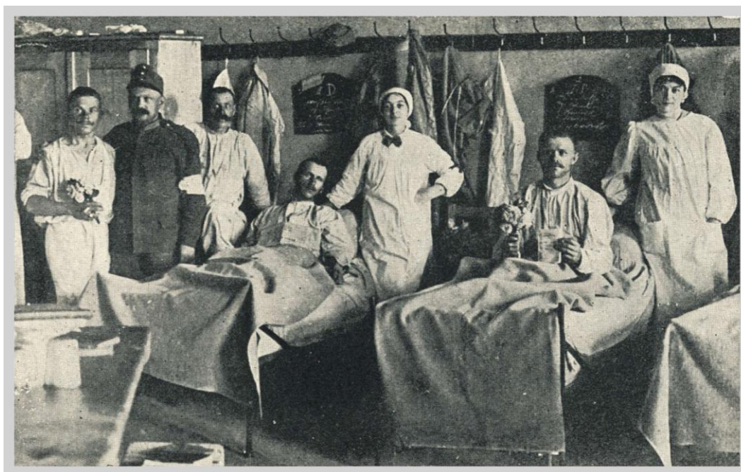
Obr. č. 24: Ranění vojáci ve školní tělocvičně. 264