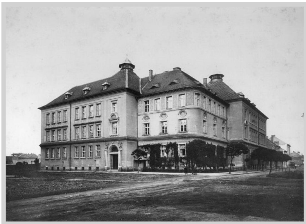
Obr. č. 12: Budova bývalé školy Na Skřivánku, současnost. 252