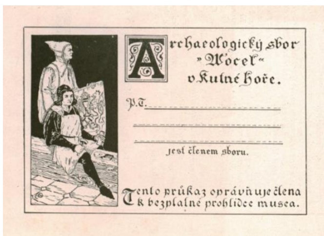
Příloha č. 10: a) budova Hrádku, jež roku 1938 oficiálně přešla pod správu spolku Vocel a nabídla nové prostor pro uchování a prezentování sbírek, b) legitimace členů spolku z první poloviny 20. století; zdroj: ČMS, URL: < https://www.cms-kh.cz/historie-ceskeho-muzea-stibra >.