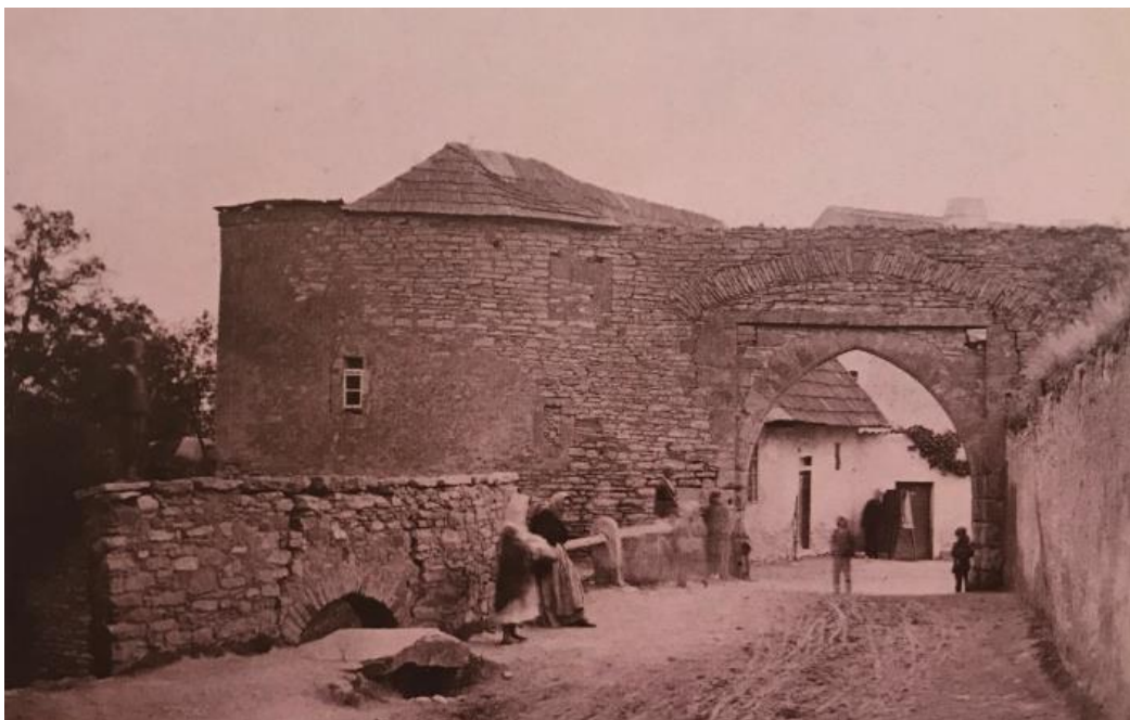
Příloha č. 1: fotografie Kolínské brány s baštou o jejíž zachování se spolek Vocel v počátcích své činnosti snažil