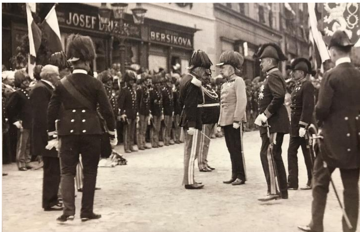
Příloha č. 9: fotografie návštěvy císaře Františka Josefa I. Kutné Hory v roce 1906