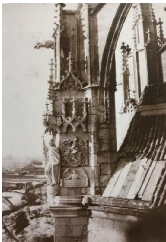
Příloha č. 5: porovnání stavu jednoho z opěrných pilířů před a po rekonstrukci; zdroj: POSPÍŠIL, Aleš. Zmizelá Kutná Hora , s. 68–69.