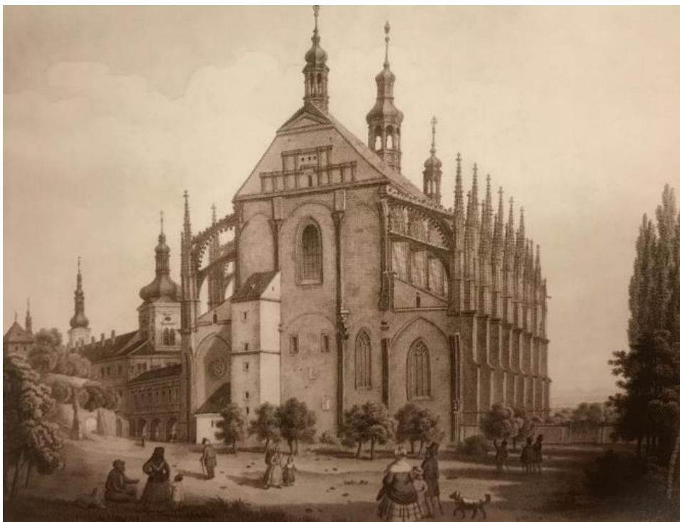
Příloha č. 3: vyobrazení západního průčelí chrámu sv. Barbory a Jezuitské koleje spojených podklenutou barokní chodbou, polovina 19. století; zdroj: POSPÍŠIL, Aleš. Zmizelá Kutná Hora , s. 65.