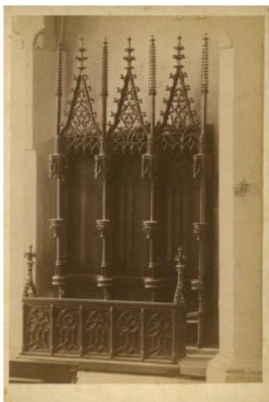
Příloha č. 2: fotografie zrekonstruovaných gotických lavic v chrámu sv. Barbory; zdroj: ČMS URL: https://www.cms-kh.cz/historie-ceskeho-muzea-stribra .