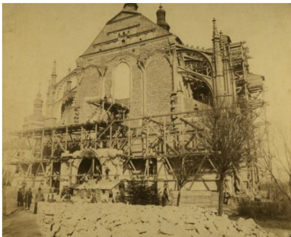
Příloha č. 4: výstavba nového západního průčelí chrámu započatá roku 1893 a vedená architektem Josefem Mockerem; zdroj: POSPÍŠIL, Aleš. Zmizelá Kutná Hora , s. 71.