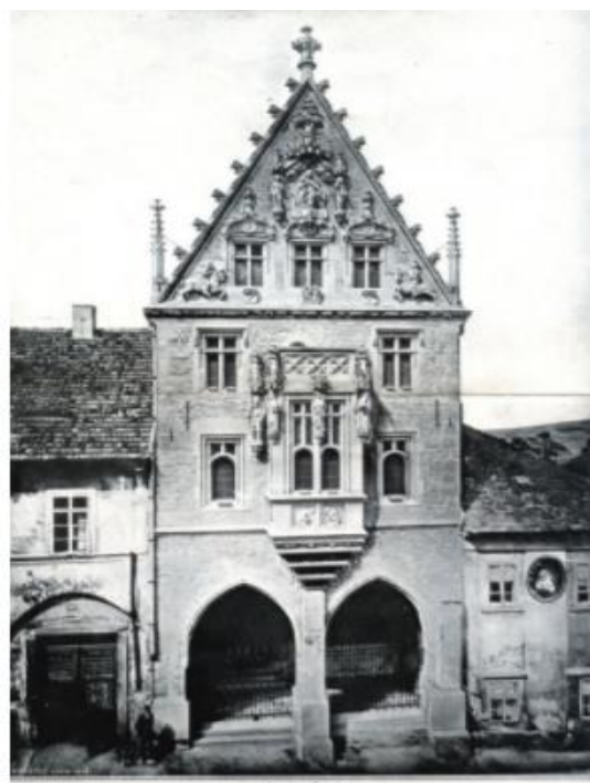
Příloha č. 6: porovnání průčelí Kamenného domu před a po rekonstrukci v budovu pro muzejní účely; zdroj: a) POSPÍŠIL, Aleš. Zmizelá Kutná Hora , s. 78. b) ČMS, URL: < https://www.cms-kh.cz/historie-ceskeho-muzea-stibra >.