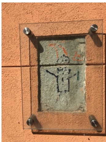
Obr. 1 Poslední trpaslík na zdi domu ve Vratislavi

Poslední trpaslík, připomínající oranžové hnutí 80. let, které probíhalo ve Vratislavi, se nachází v ulici Smoluchowského. Majitel budovy se rozhodl, že trpaslíka uchrání, a tak během rekonstrukce fasády domu, vyčlenil kousek, který se nezrekonstruoval a před samotného trpaslíka dal skleněný kryt, který ho chrání nejen před nenechavci, ale i před deštěm a jinými přírodními vlivy.