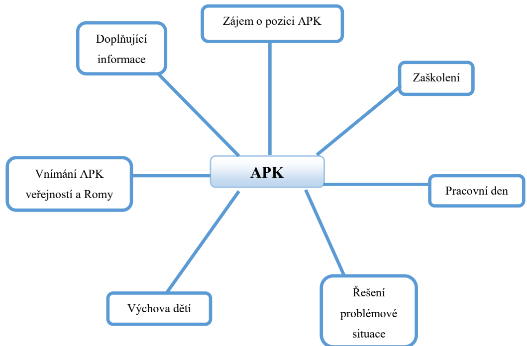
Schéma č. 3: APK

„Nic dalšího bych nedoplnil. Vše bylo řečeno a odpovědi vám snad dostatečně poslouží.“