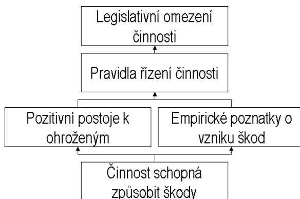
Obrázek 2. Tradiční péče o bezpečnost

Každodenní péče o bezpečnost v objektech podléhajících zákonu o prevenci závažných havárií se často opírá o jednoduchou představu znázorněnou na Obrázku 2. Základem řízení bezpečnosti jsou pravidla řízení, která vycházejí z empirických poznatků a ze snahy neškodit ohroženým, není však přijato, že by tato pravidla měla mít nějakou zobecnitelnou strukturu. Považuje se za normální, že některá pravidla jsou vymáhána legislativou.