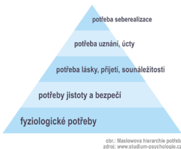
Obrázek č. 1