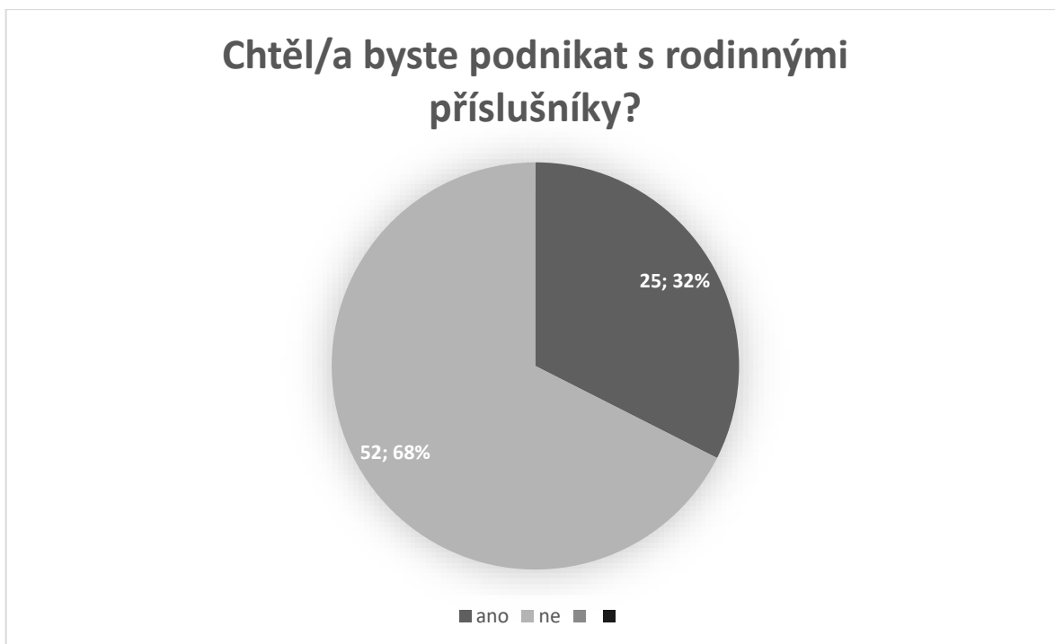
Obrázek 3: Graf popisující zájem respondentů o rodinné podnikání zjištěné z dotazníkového šetření