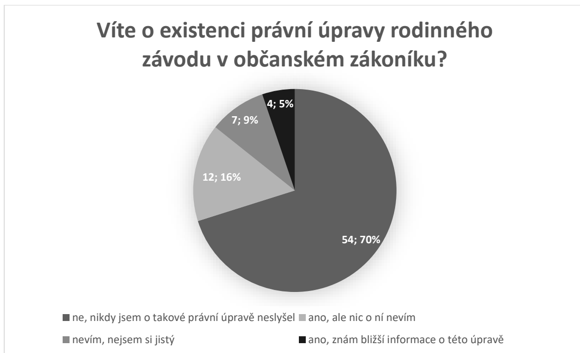
Obrázek 1: Graf popisující povědomí veřejnosti o existenci právní úpravy rodinného závodu zjištěné z dotazníkového šetření