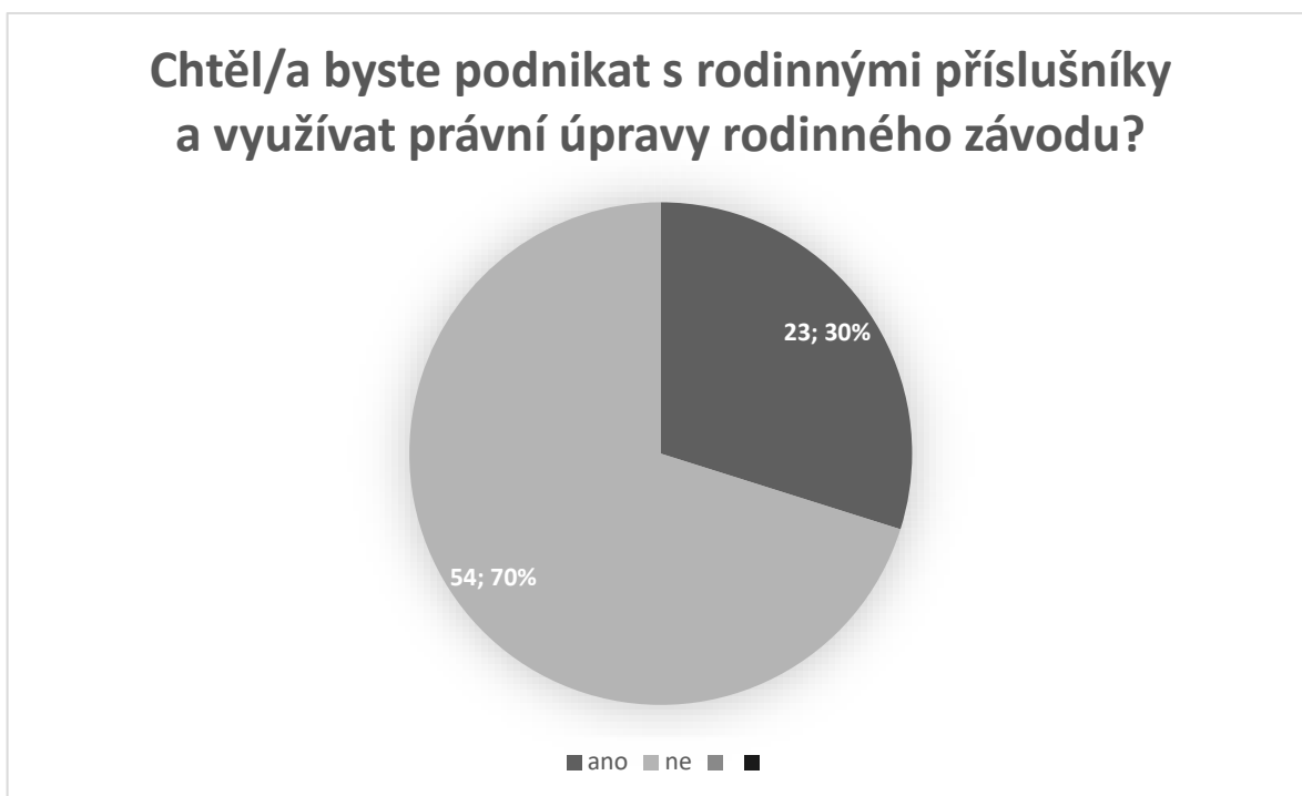
Obrázek 4: Graf popisující zájem respondentů o využívání právní úpravy rodinného závodu zjištěné z dotazníkového šetření