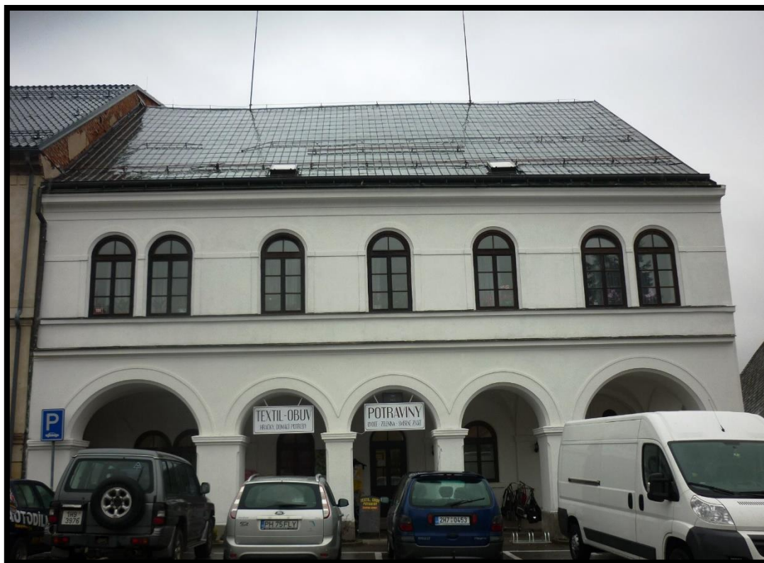
Obr. č. 33. Rokytnice nad Orlicí I