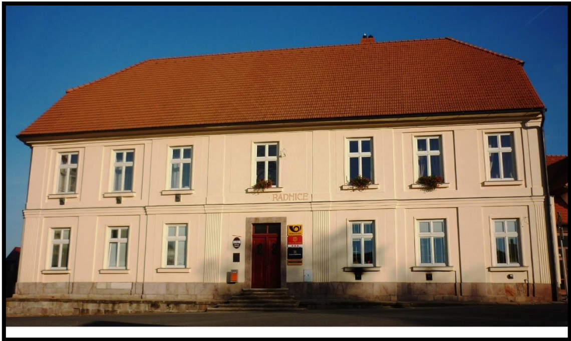
Obr. č. 29. Pecka