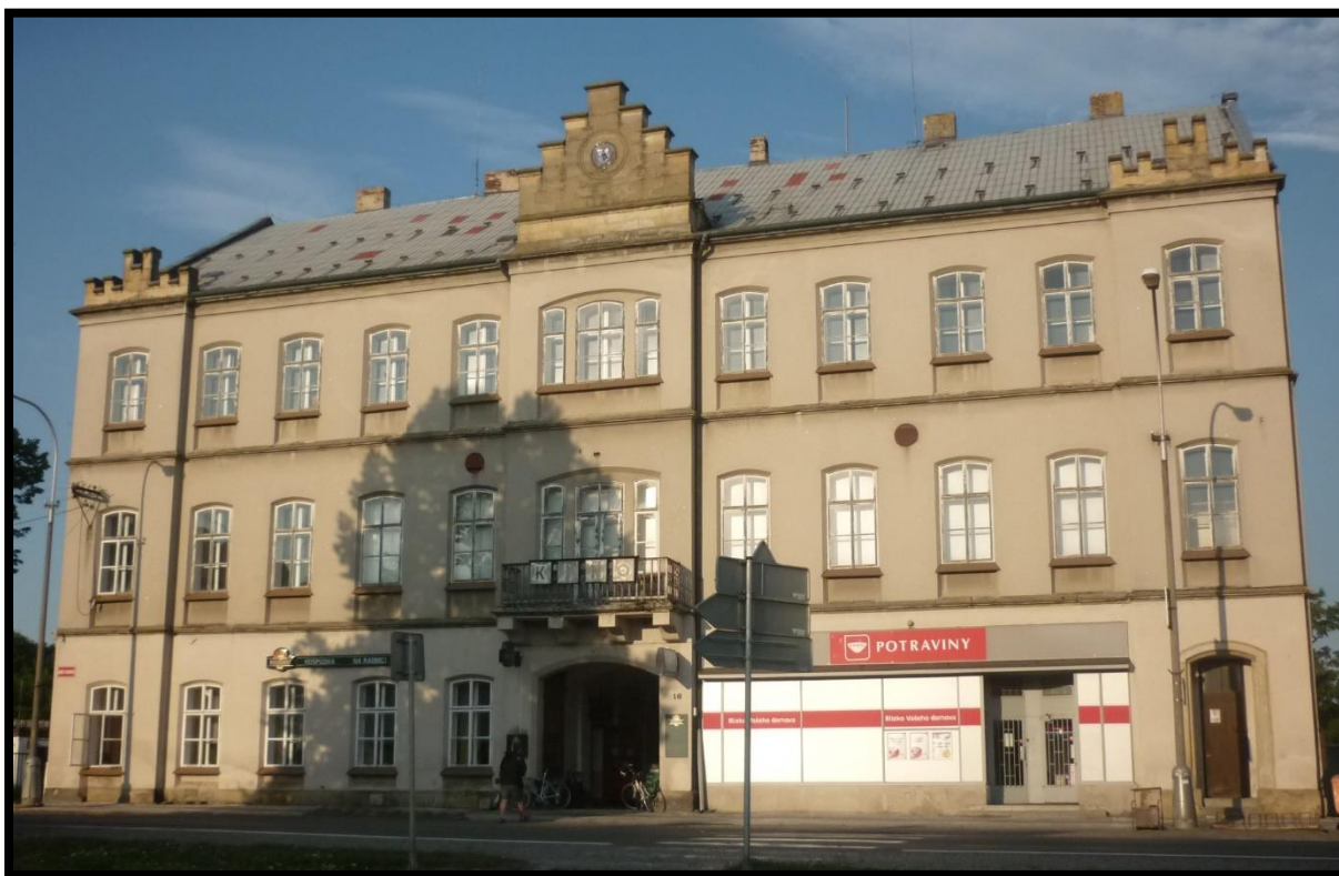
Obr. č. 16. Kopidlno