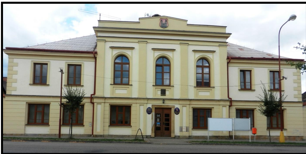
Obr. č. 37. Smidary