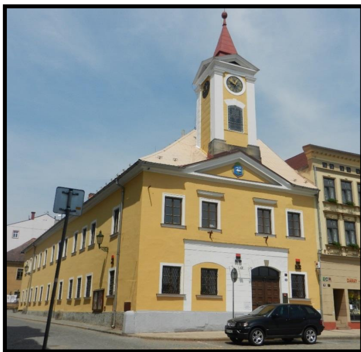
Obr. č. 2 Broumov I.