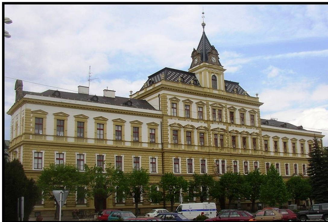
Obr. č. 32. Přebouč