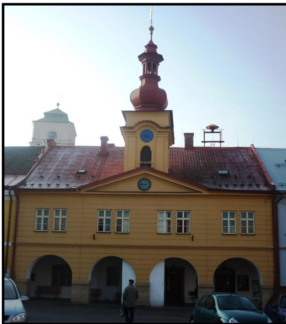
Obr. č. 38. Sobotka