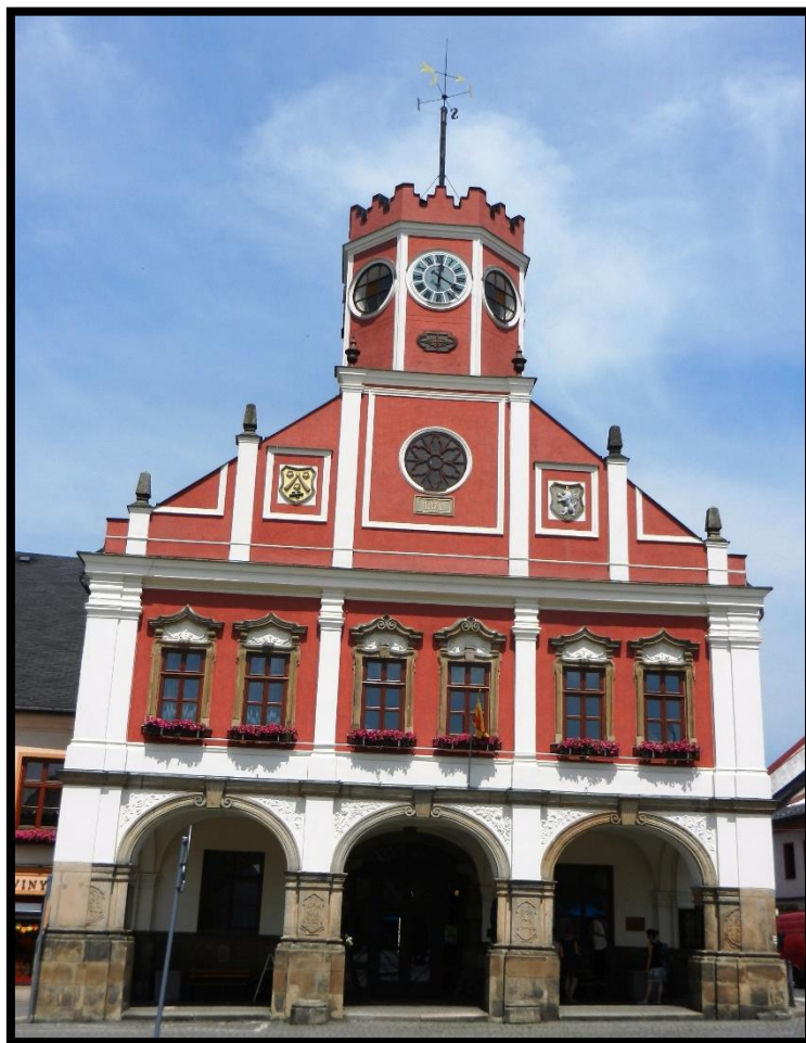
Obr. č. 30. Police nad Metují