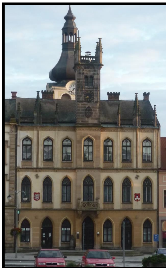
Obr. č. 8. Hořice v Podkrkonoší