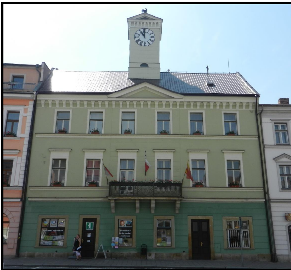
Obr. č. 13. Jaroměř