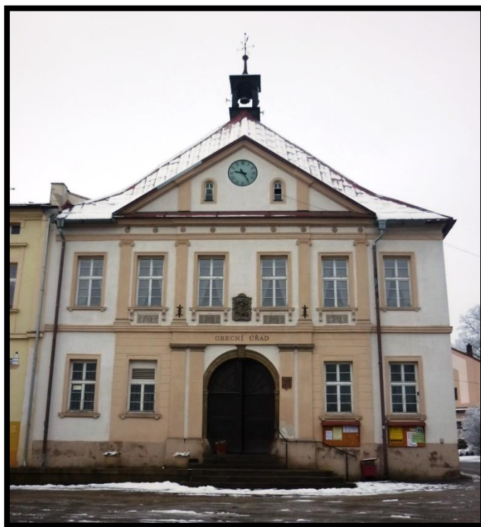
Obr. č. 40. Stárkov