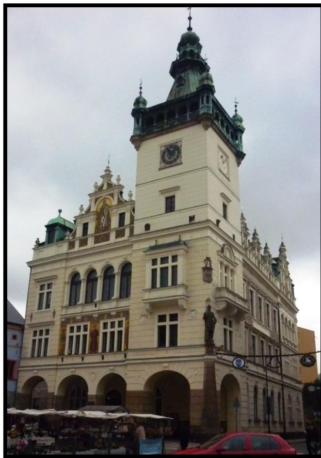
Obr. č. 23. Náchod