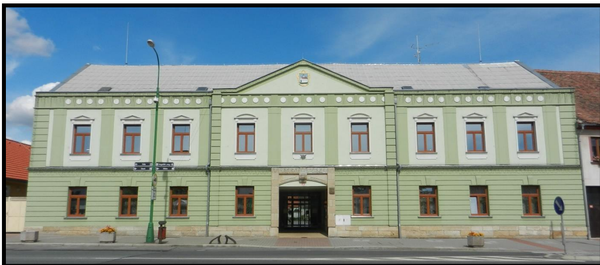
Obr. č. 11 Chlumec nad Cidlinou