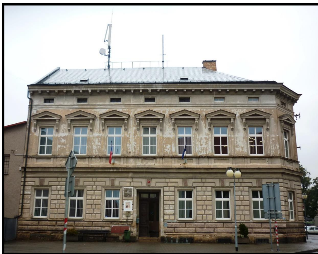
Obr. č. 34. Rokytnice nad Orlicí II