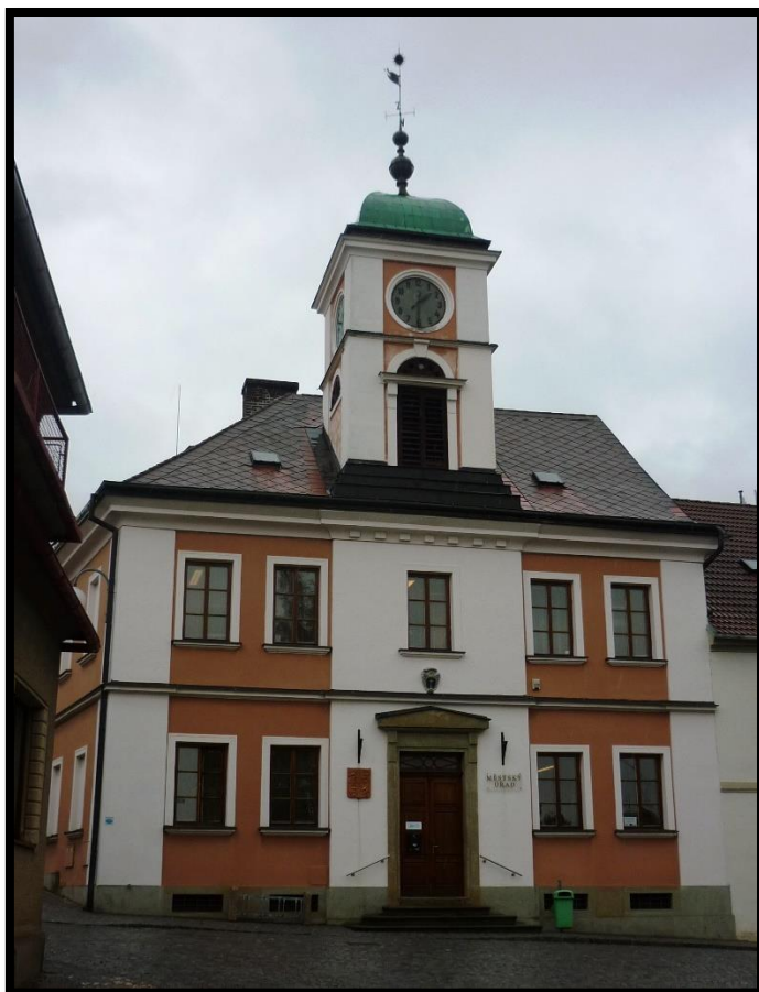
Obr. č. 39. Solnice