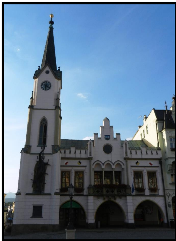
Obr. č. 41. Trutnov