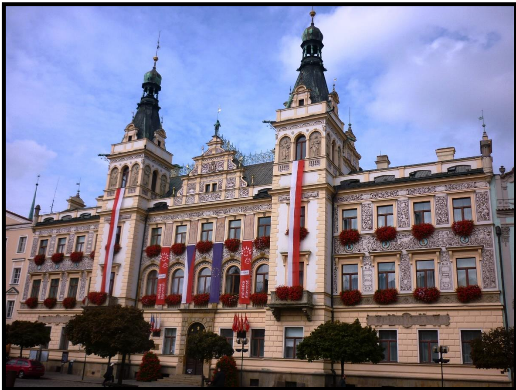
Obr. č. 28. Pardubice