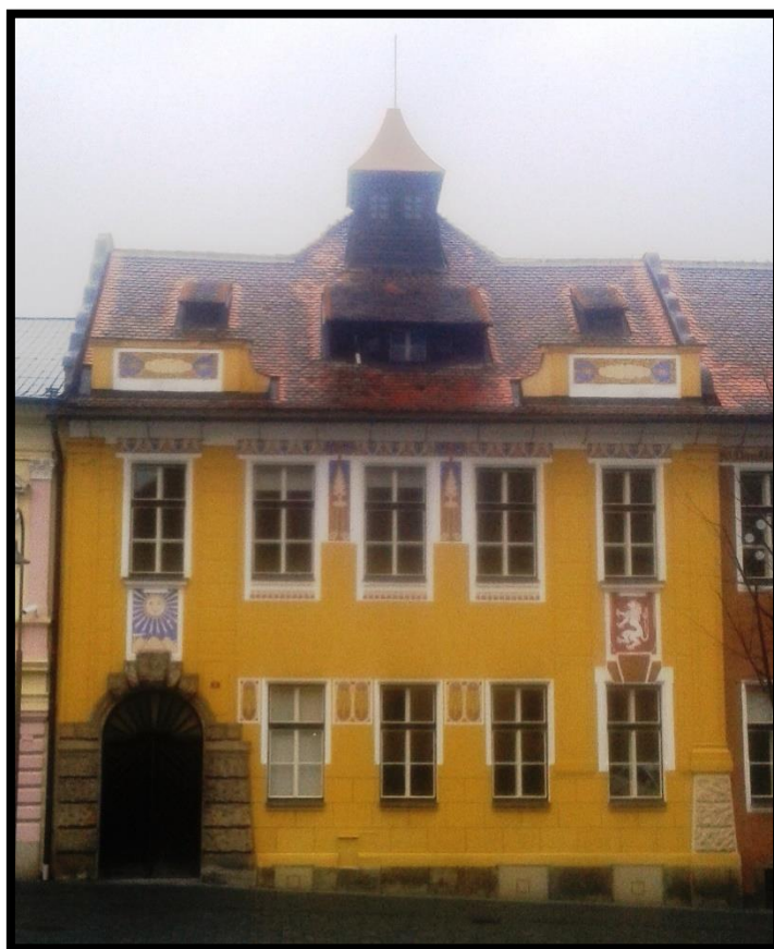
Obr. č. 26. Opočno I