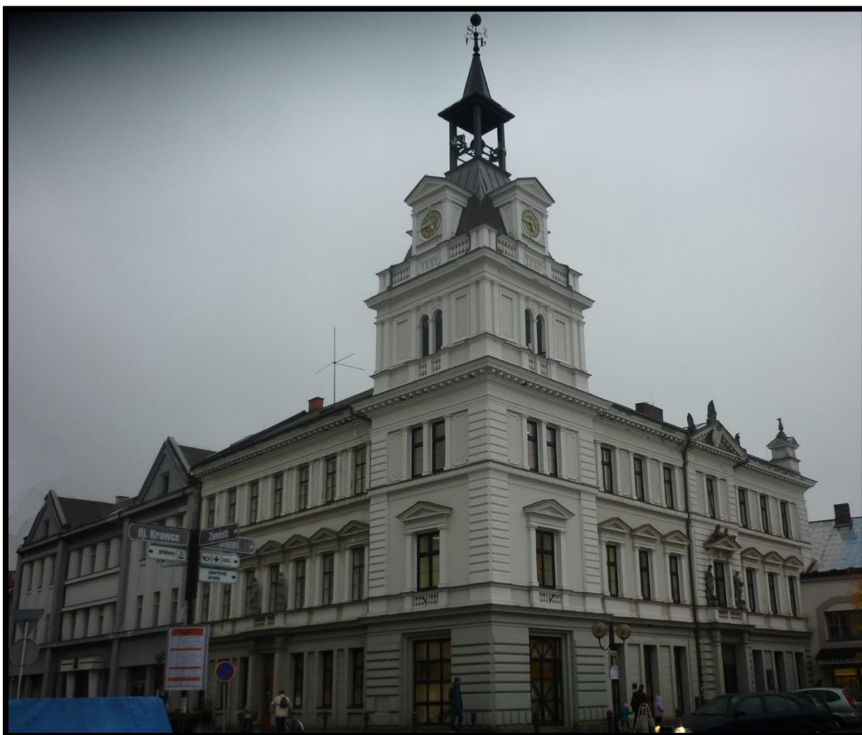
Obr. č. 12. Choceň