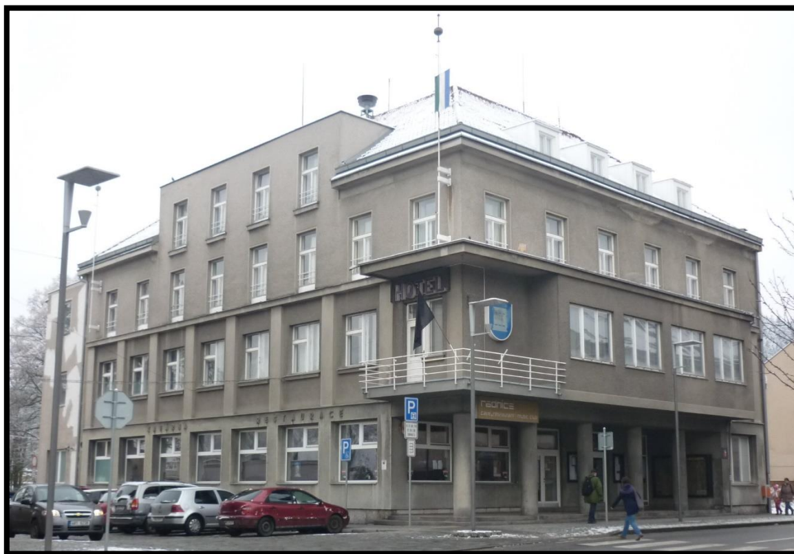
Obr. č. 10 Hronov