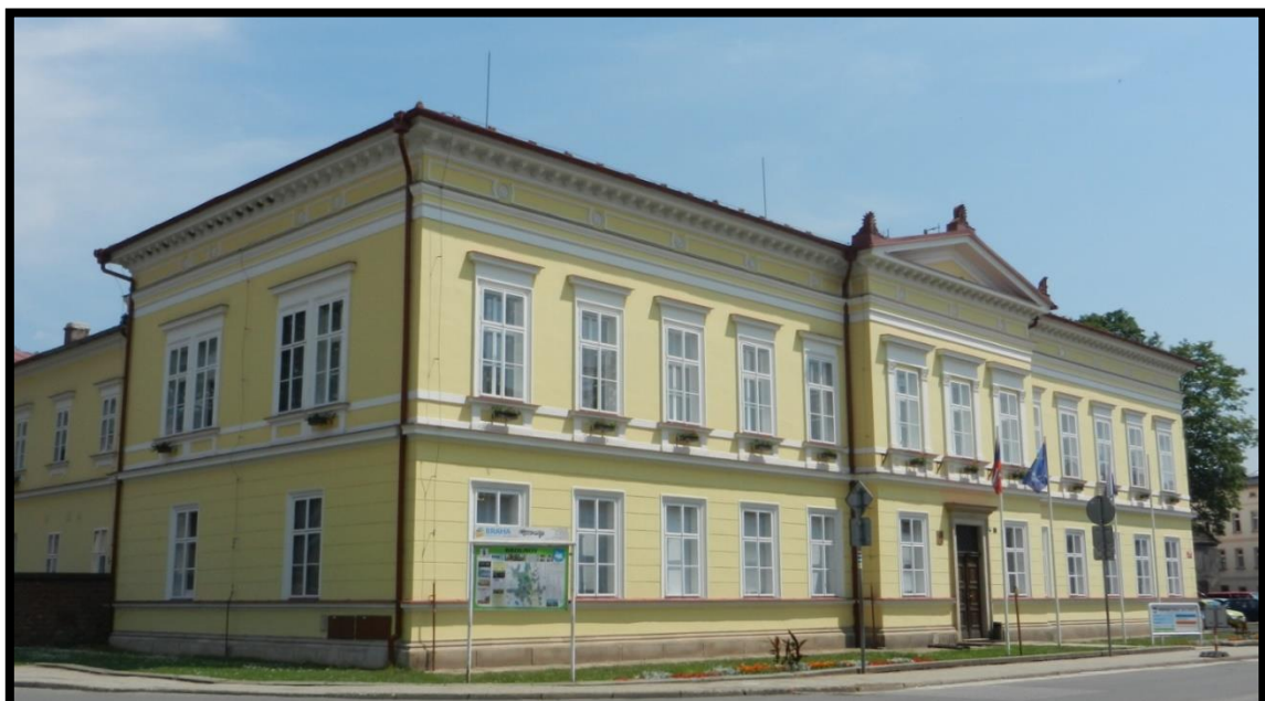
Obr. č. 3 Broumov II