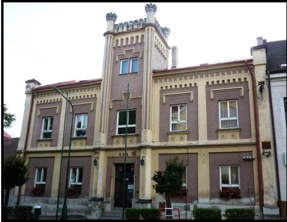
Obr. č. 35. Ronov nad Doubravou