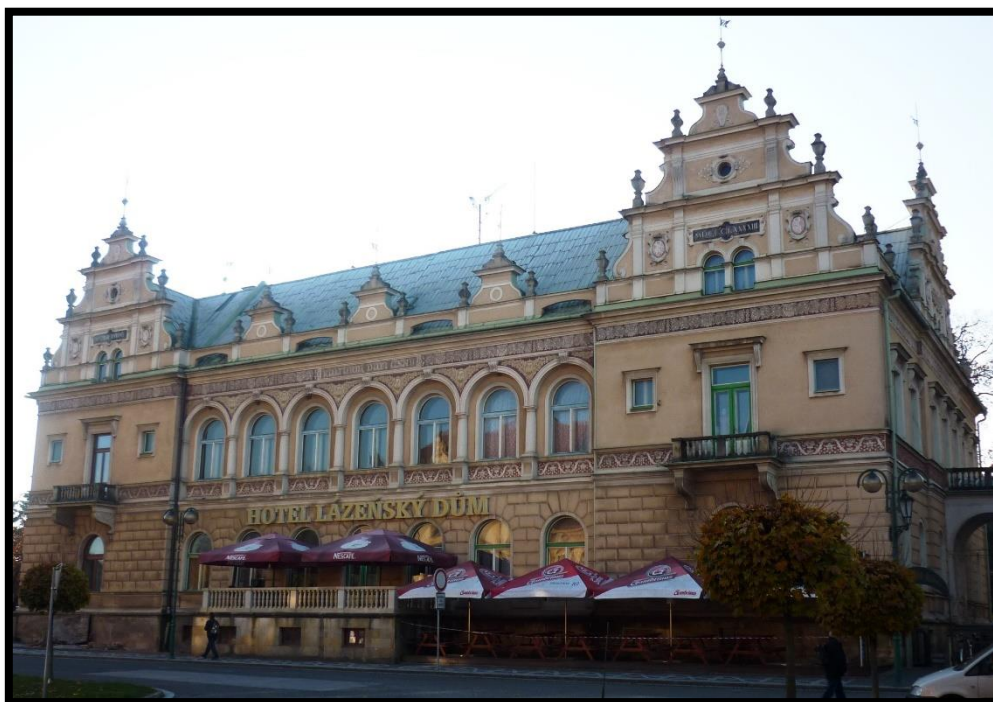
Obr. č. 20 Lázně Bělohrad