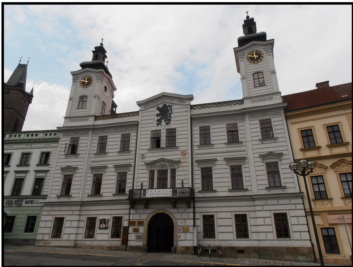
Obr. č. 9. Hradec Králové