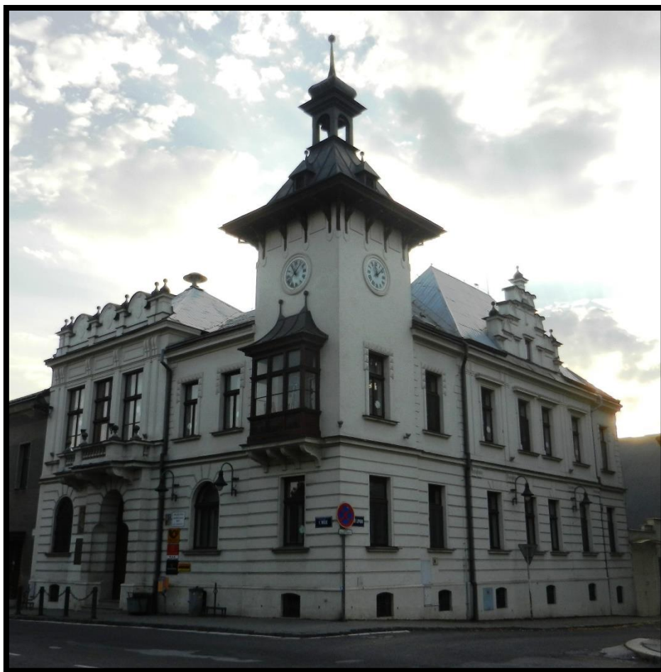
Obr. č. 19 Krčín