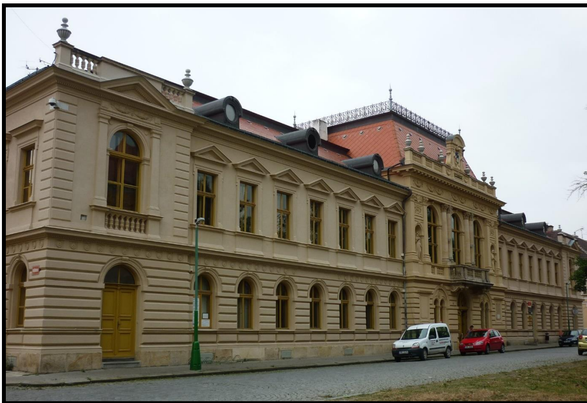
Obr. č. 15. Josefov