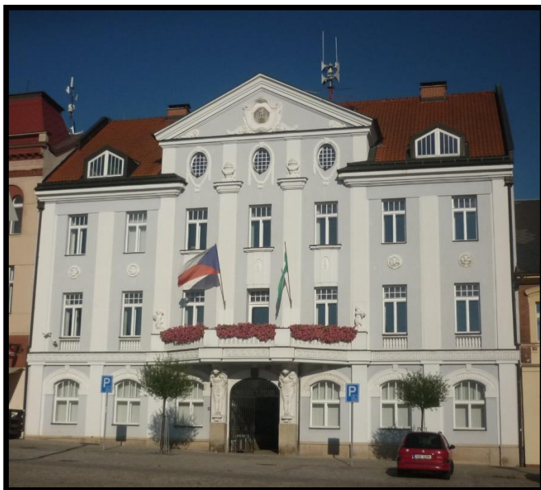
Obr. č. 7. Dvůr Králové nad Labem