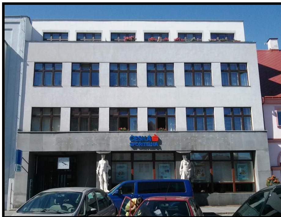
Obr. č. 24. Nová Paka (fotografie autorka)