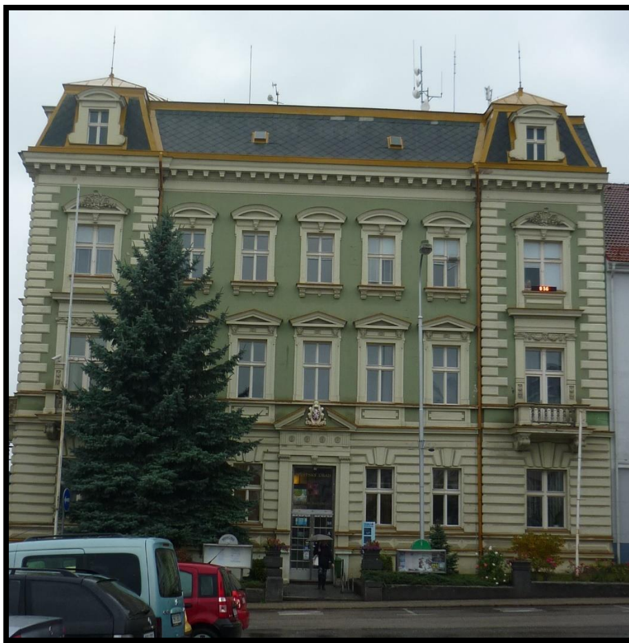
Obr. č. 17. Kostelec nad Orlicí