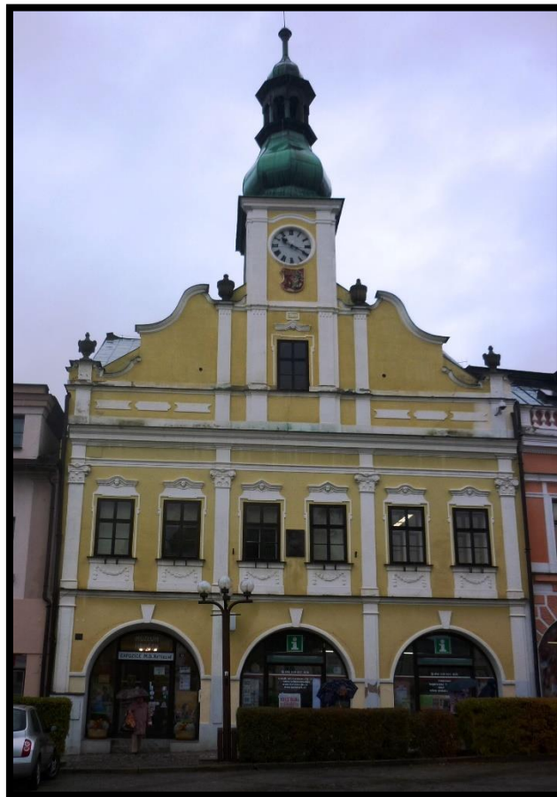
Obr. č. 36. Rychnov nad Kněžnou