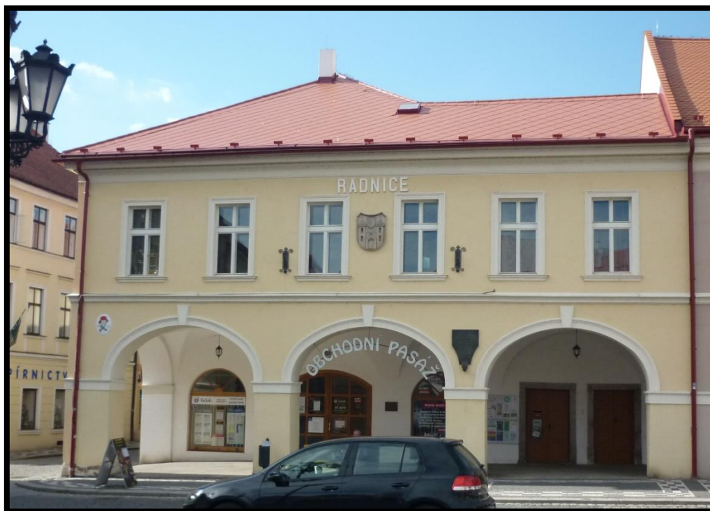
Obr. č. 14. Jičín