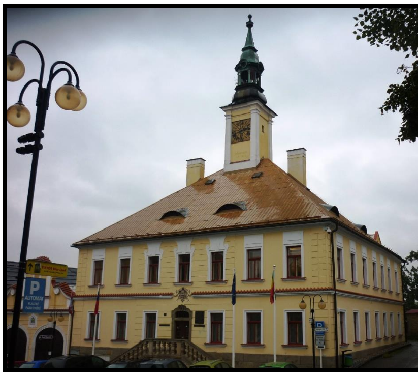
Obr. č. 44. Žamberk