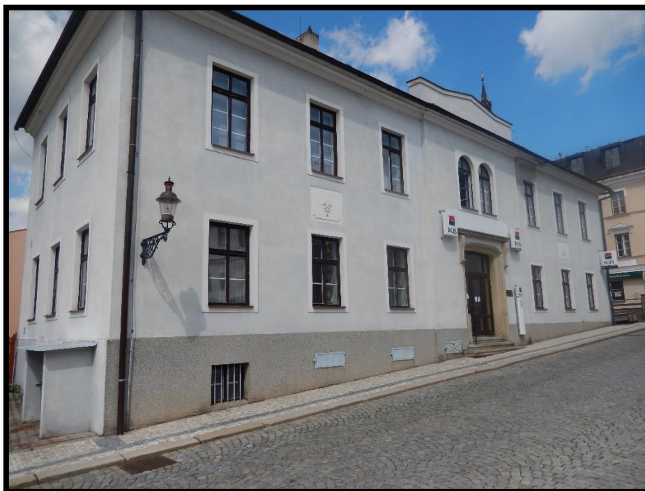
Obr. č. 18. Králíky