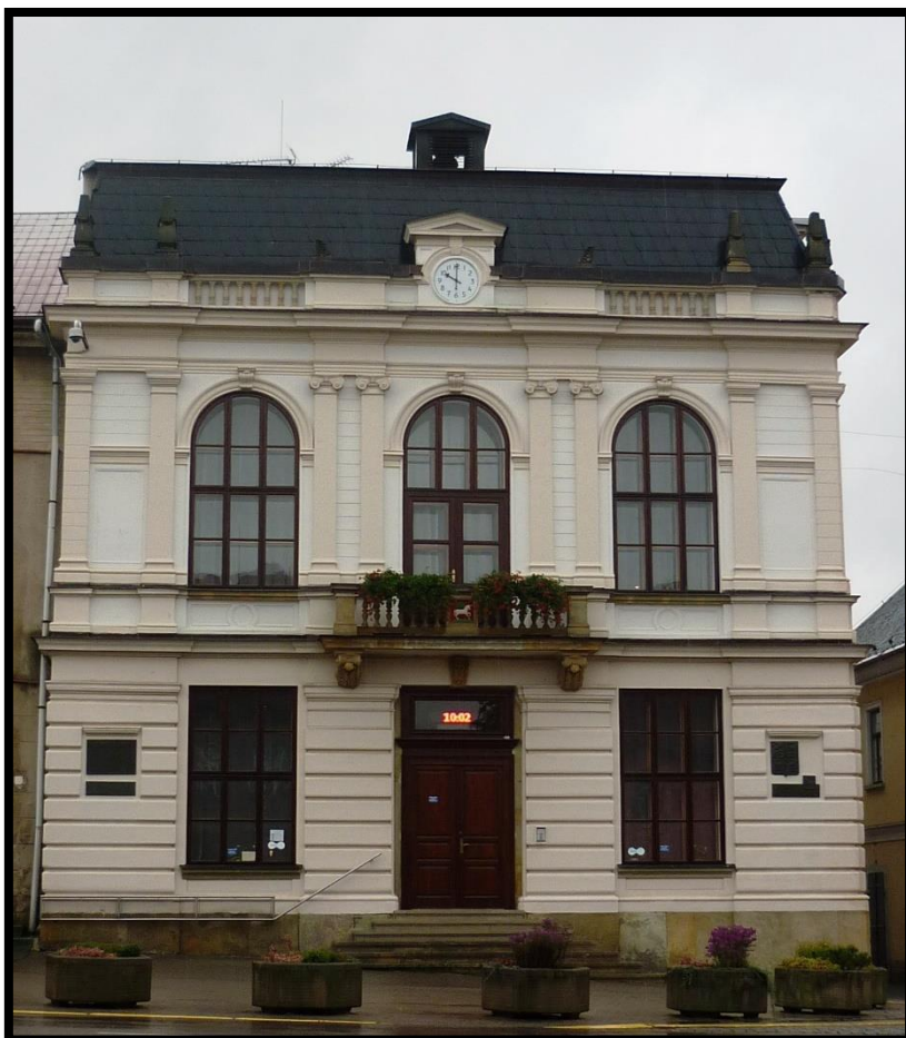
Obr. č. 43. Vamberk