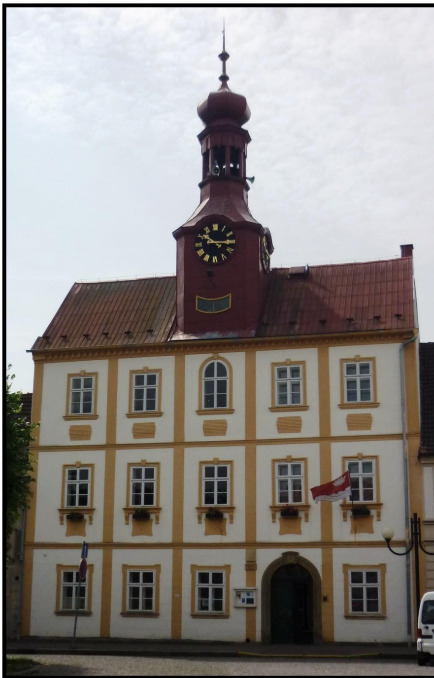
Obr. č. 45. Železnice