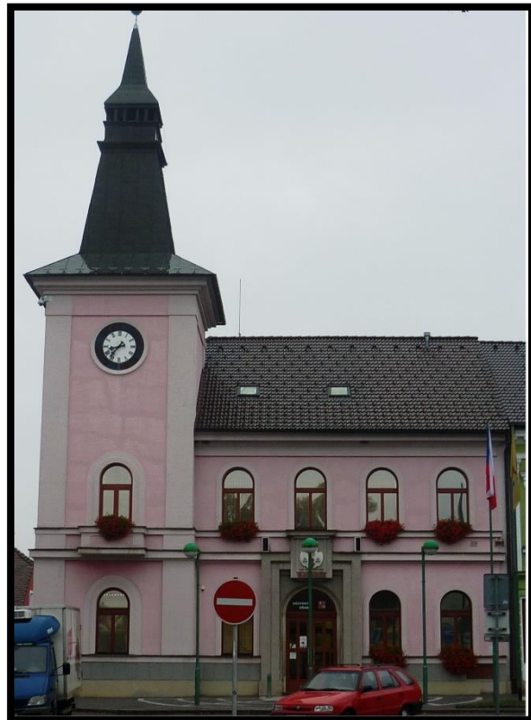
Obr. č. 42. Třebechovice pod Orebem