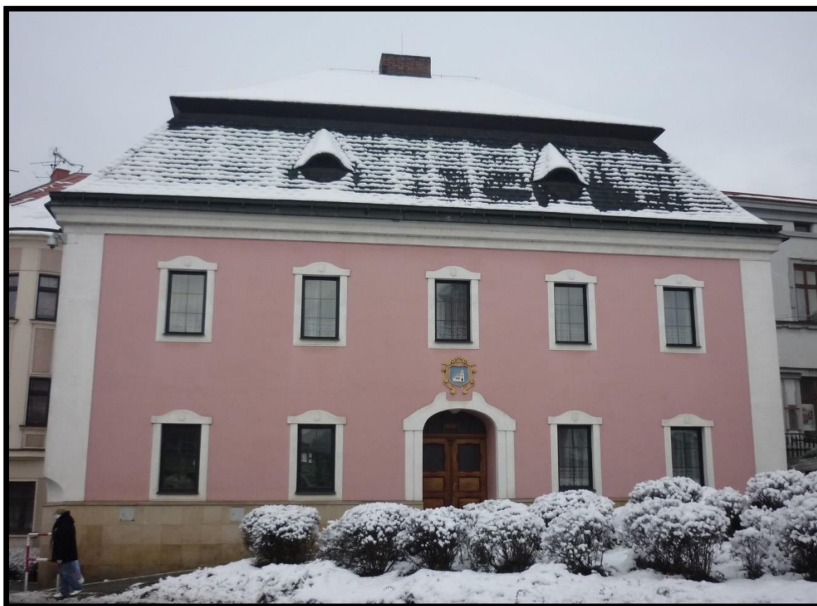
Obr. č. 4. Červený Kostelec