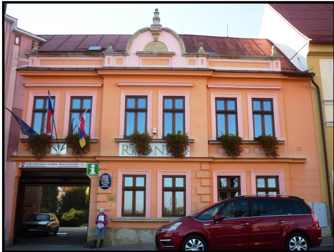
Obr. č. 22. Miletín