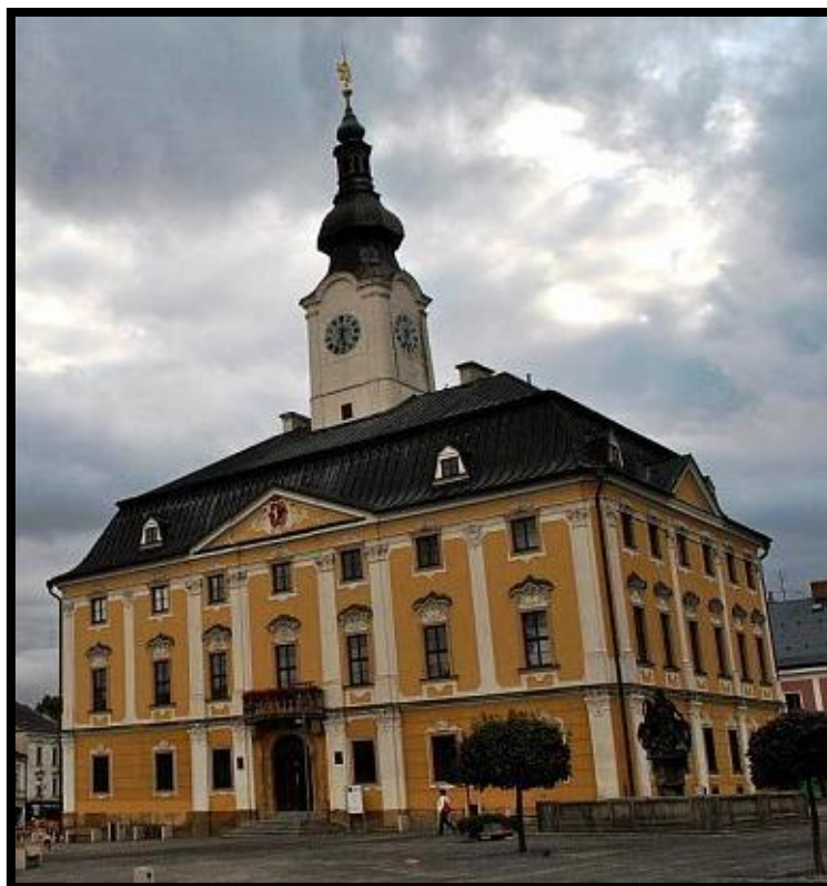
Obr. č. 31. Polička