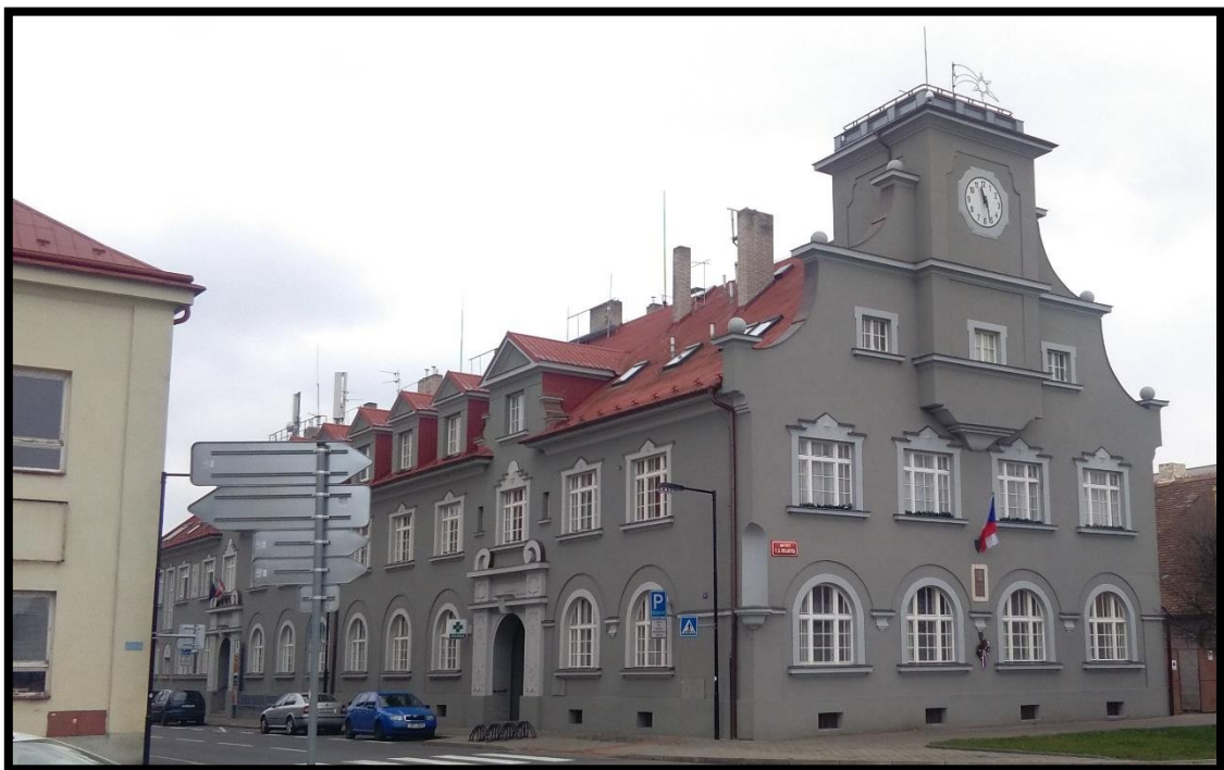
Obr. č. 6. Dašice