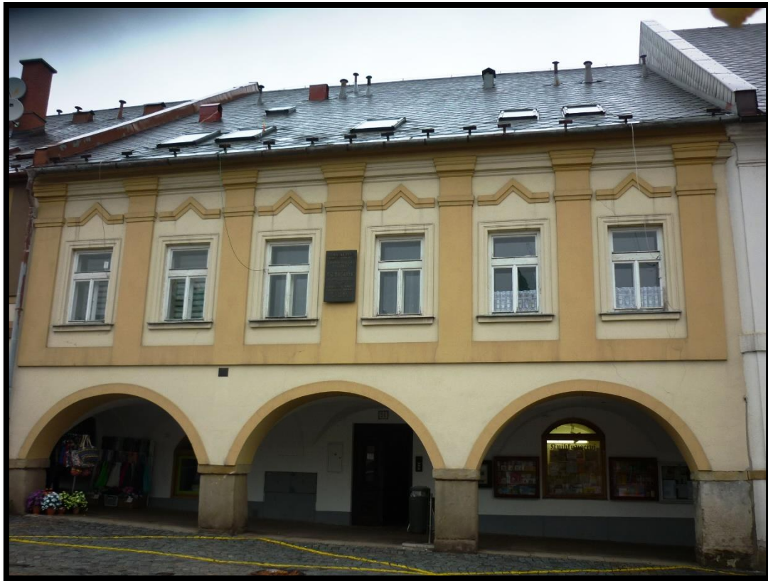
Obr. č. 21. Letohrad