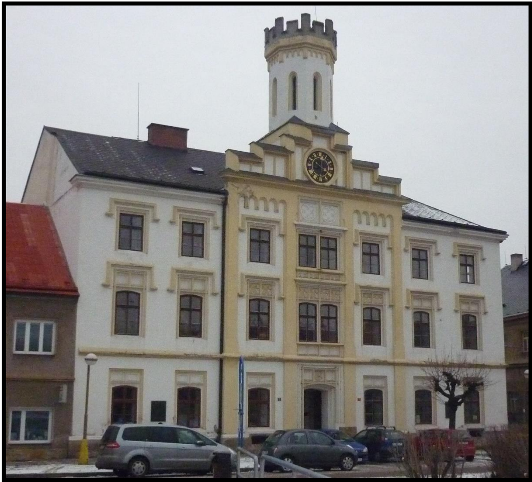
Obr. č. 5. Česká Skalice