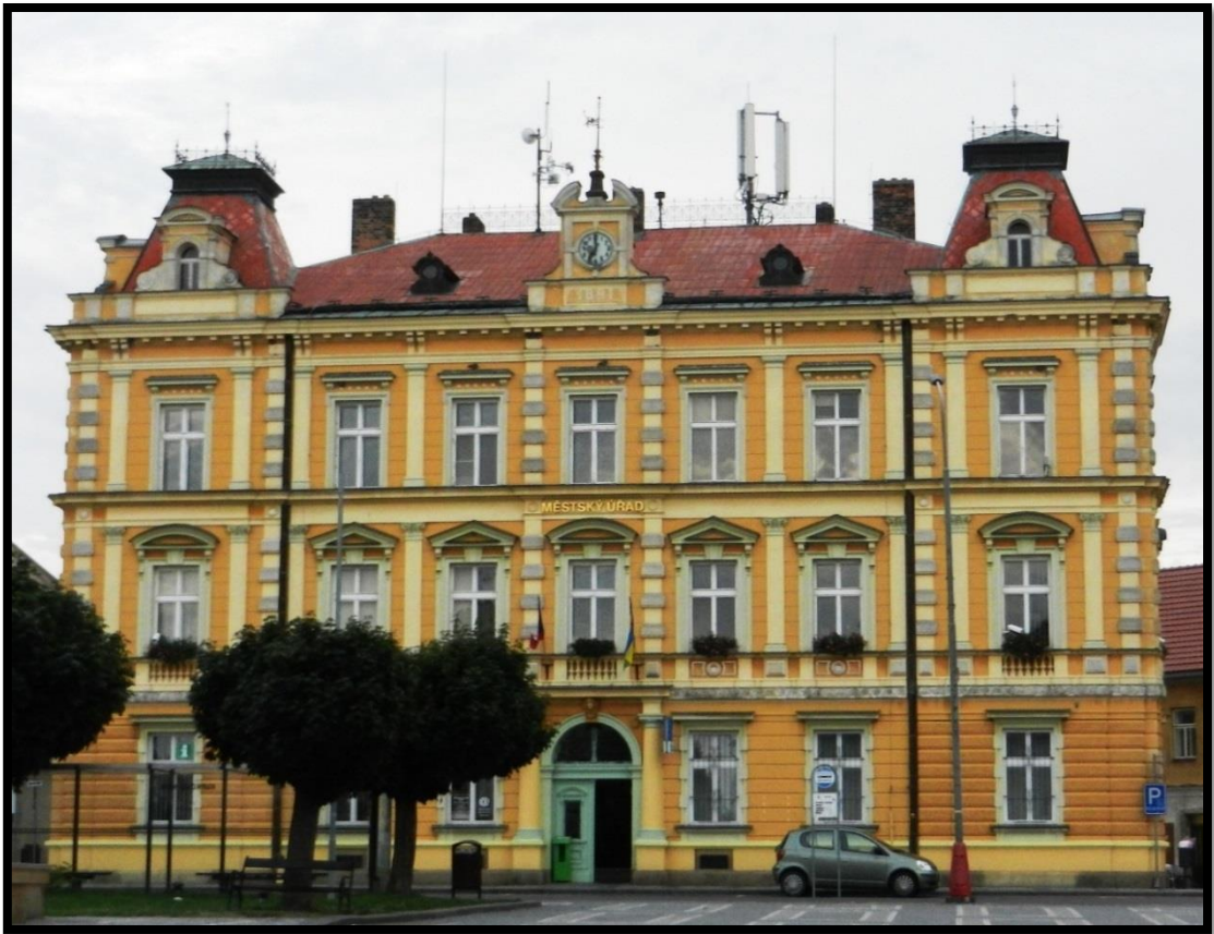
Obr. č. 27. Opočno II