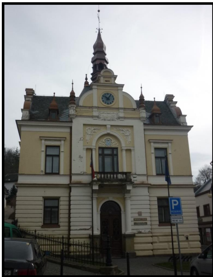
Obr. č. 1. Brandýs nad Labem