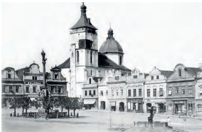
Obr. 2 Havlíčkův Brod, morový sloup a kašna před r. 1912.