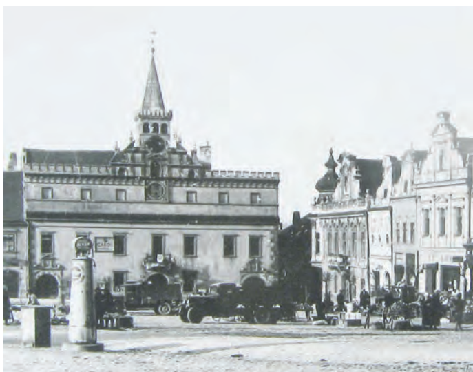
Obr. 3 Havlíčkův Brod, stojan benzínové čerpací stanice stál v samém středu náměstí v letech 1933–1936.