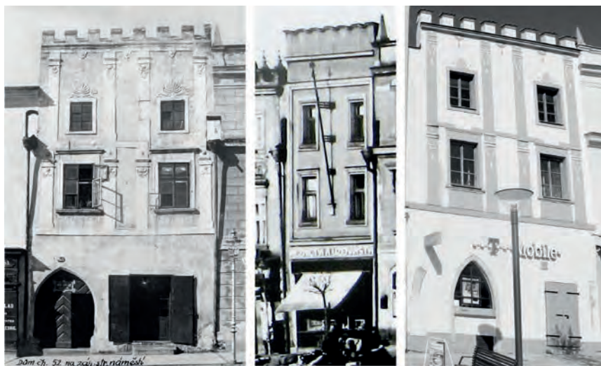
Obr. 6 Havlíčkův Brod, dům č. p. 52 před r. 1908., ve 30. letech a roku 2011

cenného gotického portálu, zejména však právě zde poprvé významně zasáhl Zdeněk Wirth, jedna z nezávadnějších postav naší památkové péče první poloviny 20. století, který byl právě toho roku jmenován konzervátorem c. k. ústřední komise pro německobrodský, chotěbořský a ledečský okres. Dozvěděl se o chystané přestavbě a v dopise starostovi z 19. 5. 1908 mj. píše: