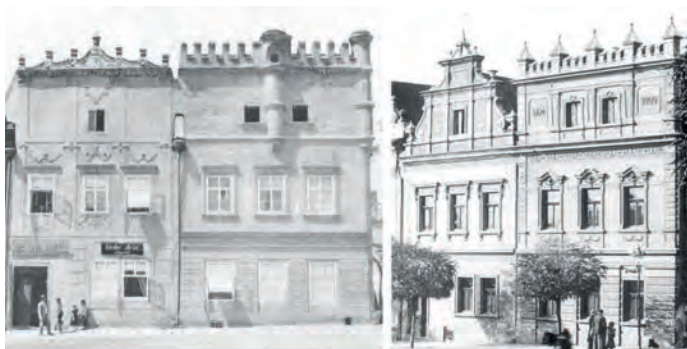
Obr. 4 Havlíčkův Brod, domy č. p. 48 a 49 před a po úpravách štítů z konce 19. století.