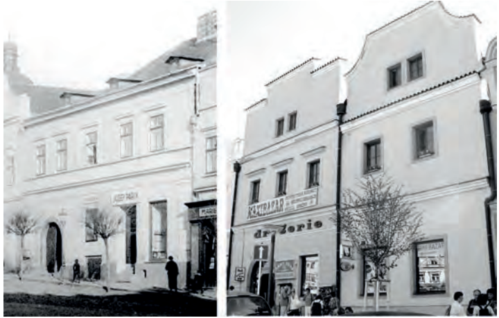
Obr. 11 Havlíčkův Brod, radikální, nezdařená a zřejmě nelegální rekonstrukce domů č. p. 161 a 162.