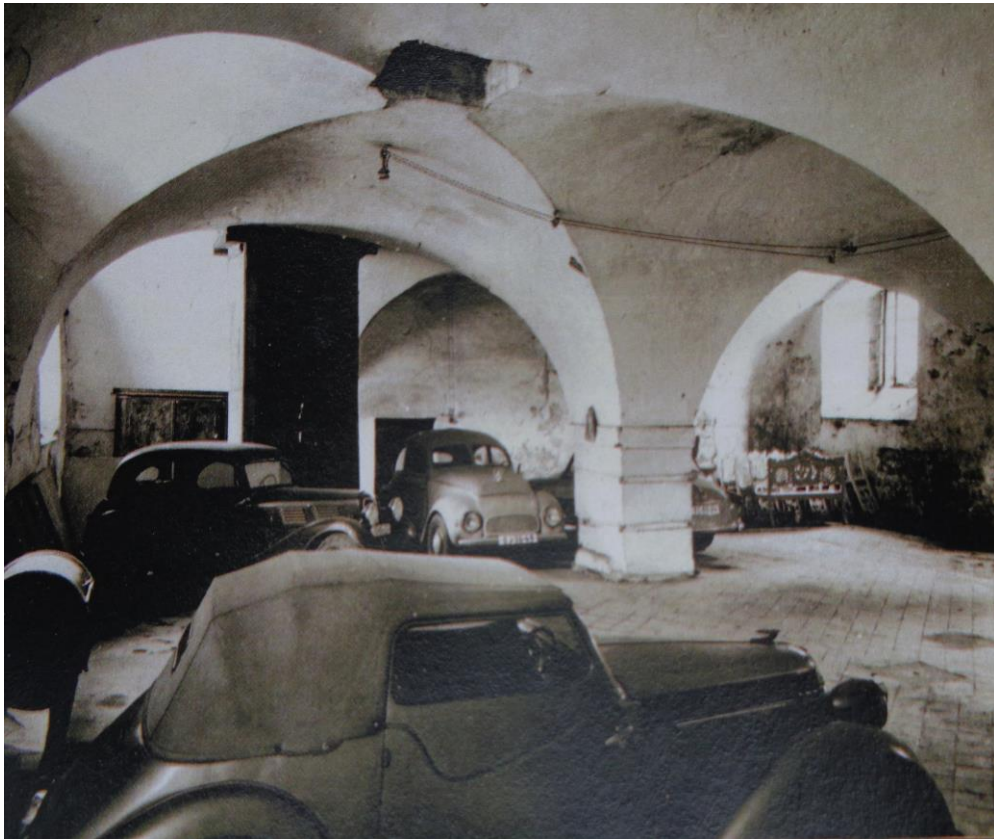
Příloha č. 2 Přízemní síň v č. 3 pardubického zámku, 1959.

NPÚ ÚOP Pardubice, Odbor EDIS – odborná spisovna, fond plánové dokumentace, kart. 5/12, fotografie č. 116, SÚRPMO.