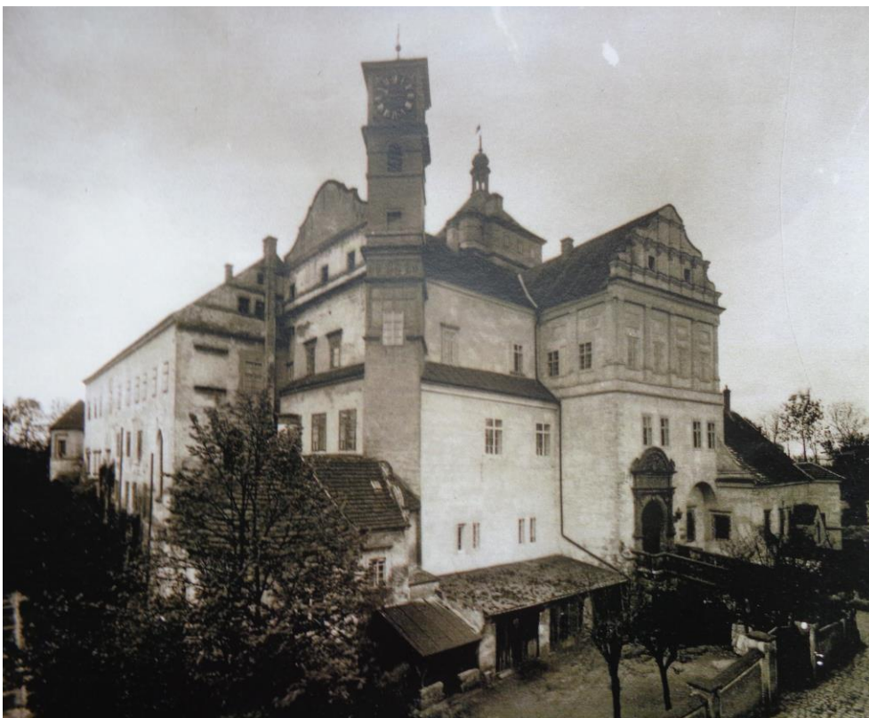
Příloha č. 1 Pohled na severovýchodní nároží zámku.