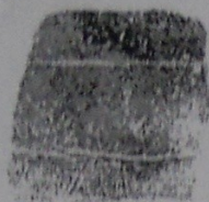
Otisk prstu pravé ruky