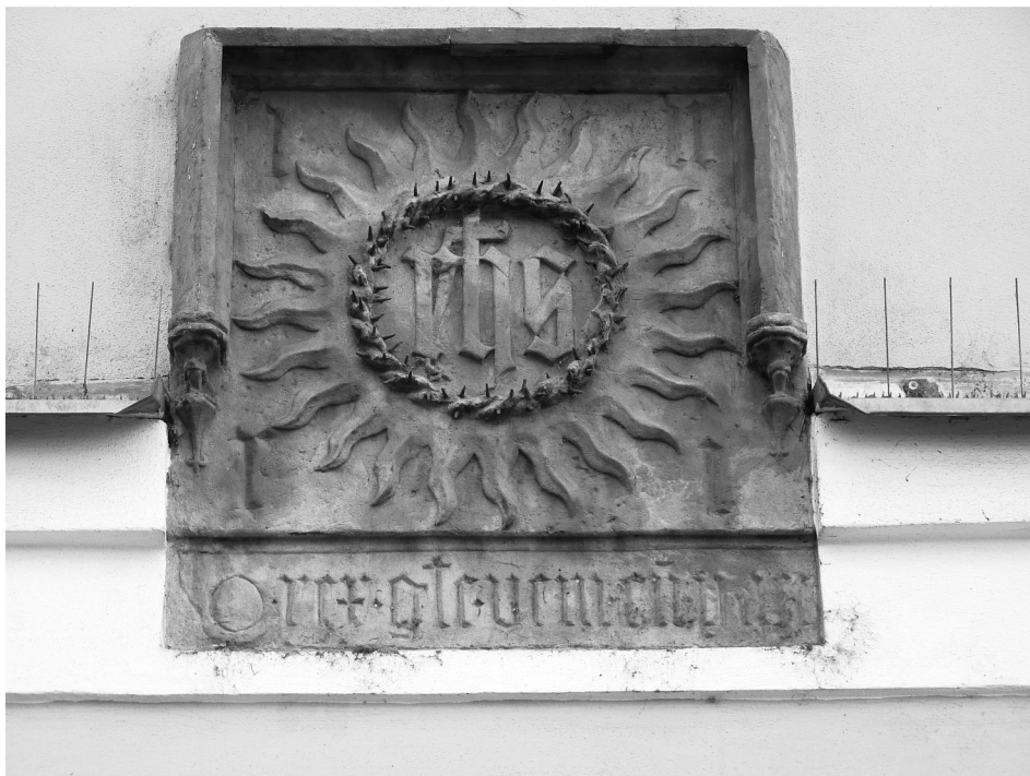
Obr. 2: Trigram Ježíšova jména na domu č. 333 v Ostružnické ulici v Olomouci. Pozůstatek Kapistránova olomouckého pobytu a doklad mohutnosti kultu zavedeného Kapistránovým učitelem Bernardinem Sienským