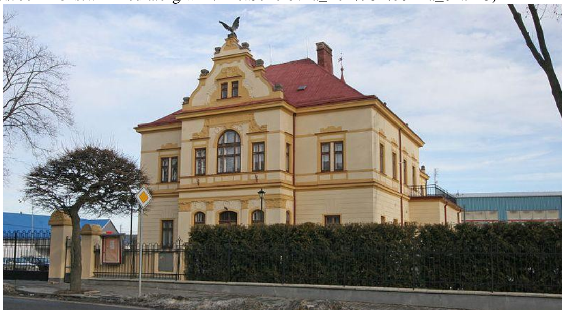
Obr. č. 4. Sokolovna Holice (fotografie autorka)

( http://commons.wikimedia.org/wiki/File:Sokolovna_Poli%C4%8Dka_01.JPG )