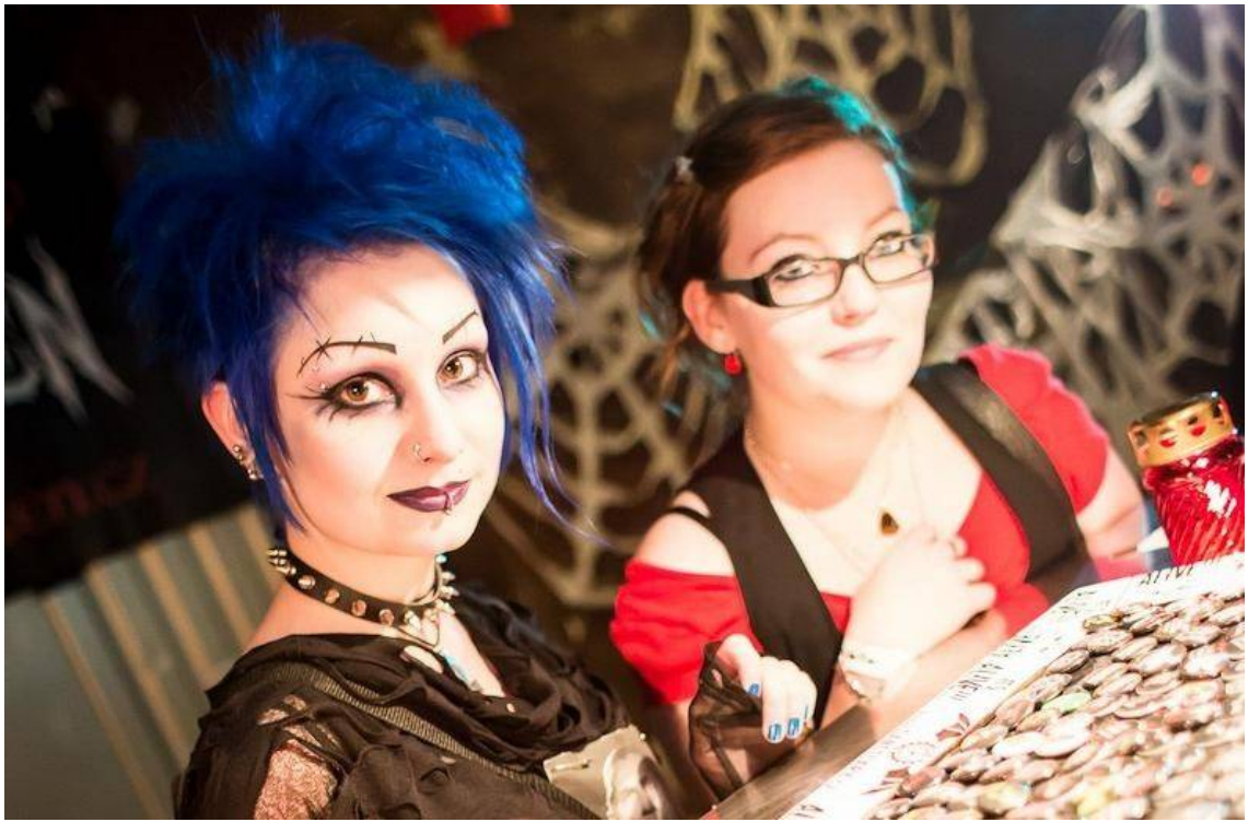
Příloha č. 2