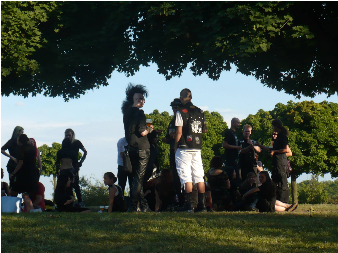
Příloha č. 7