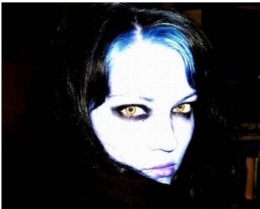
Příloha č. 4