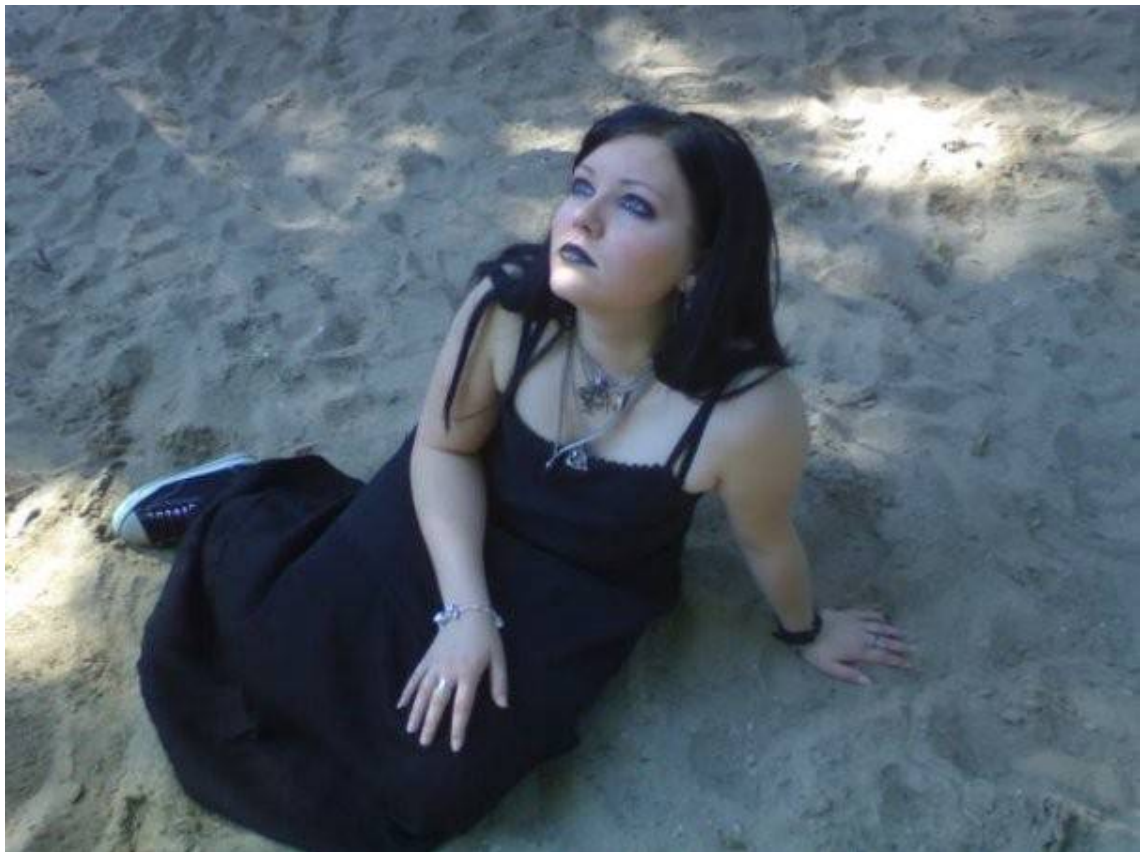
Příloha č. 3