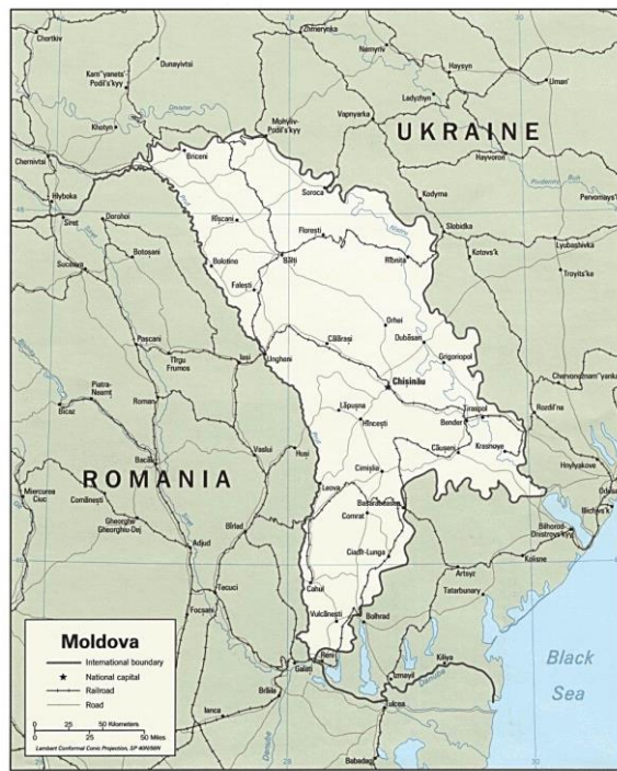
Obrázek 1: Moldavská republika

slunečnice, tabák a cukrová řepa. Co se týče sektoru služeb, jejich podíl se na HDP neustále zvyšuje, stejně tak roste i podíl zaměstnanosti v tomto sektoru. I přes pokroky v této oblasti je však trh služeb v Moldavsku stále nedostatečný – výjimku tvoří sektor informačních technologií či aktivity spojené s turistikou a vinařstvím. Turistika však stále zaostává za možným potenciálem země - podle oficiálních informací z cestovních kanceláří přicestovalo do Moldavské republiky v roce 2009 pouze 9 189 turistů (přičemž jich vycestovalo zhruba desetinásobné množství). Ekonomickému rozvoji země brání neuspokojivě rozvinutý sektor služeb finančního zprostředkovatelství.