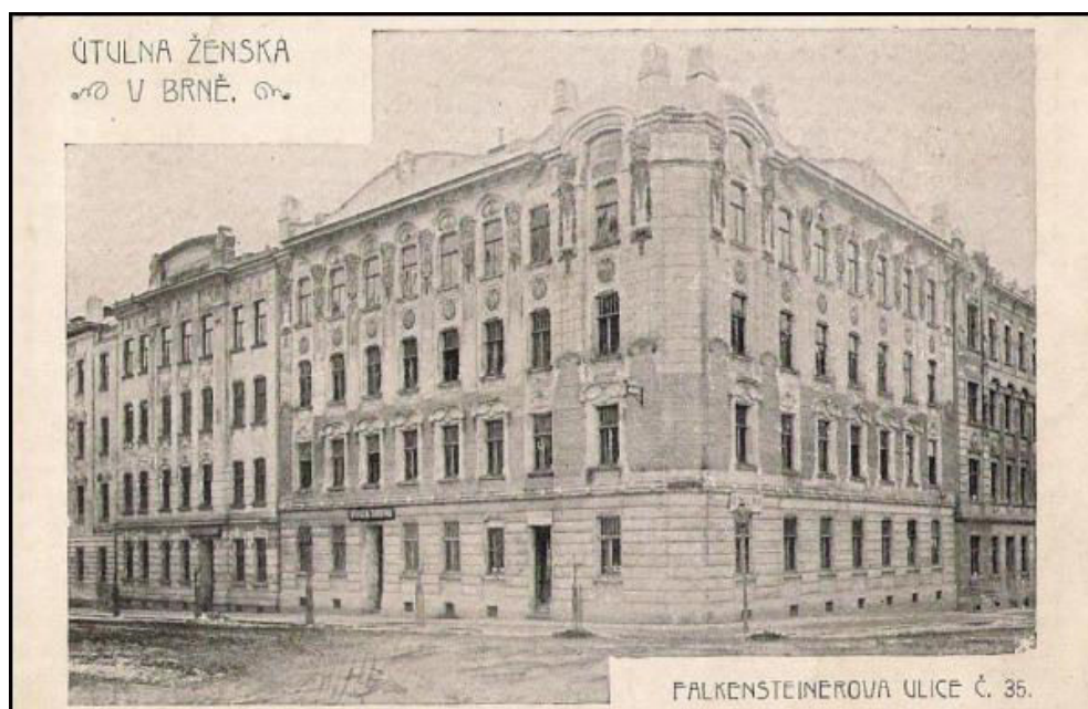
Obr. 2: Budova Útulny ženské, Falkensteinerova ulice č. 35 – nyní ulice Gorkého 440