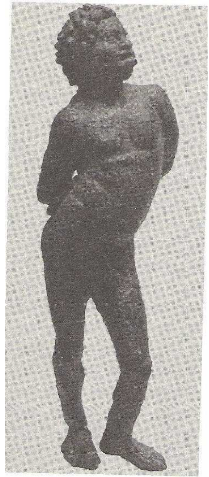
6. Černý otrok, soška z egyptského Fajjúmu ( 2. – 1. stol. př. n. l., Louvre, Paříž )