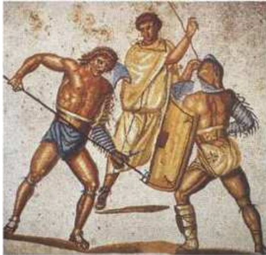
4. Gladiátoři – Retiarius bodá secutora (2. – 3. stol. n. l., Německo)