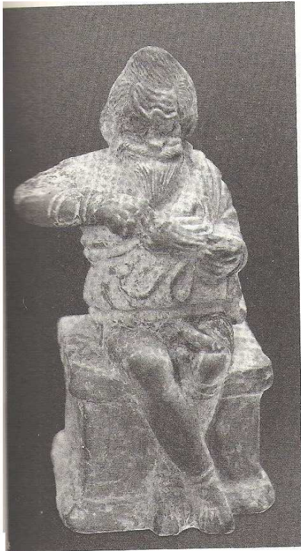
5. Herec představující otroka vyprazdňujícího ukradený měšec ( cca 400 až 375 př. n. l., Musée Sully )