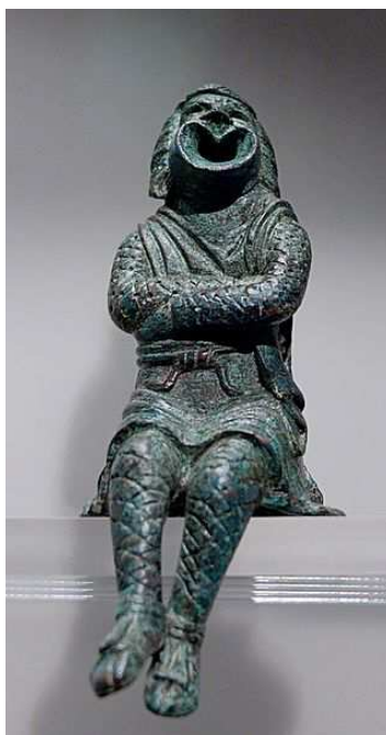
2. Herec s maskou představující otroka ( 3. stol. př. n. l., Řím )