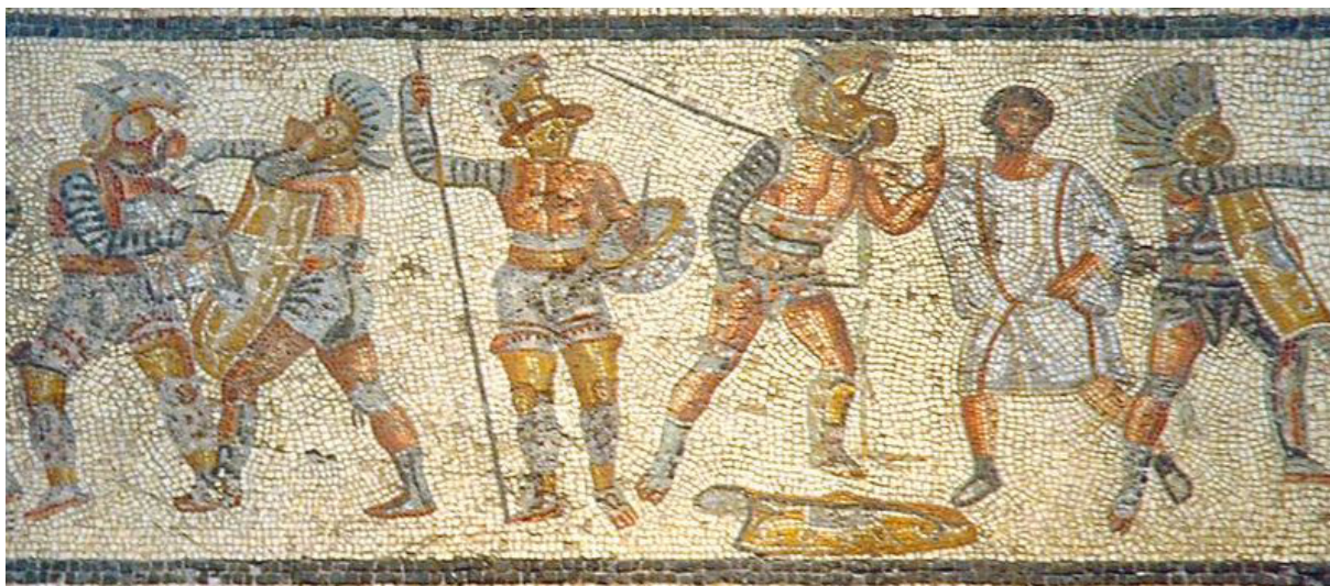
8. Skupina Gladiátorů ( Leptis Magna 2. stol. n. l.)