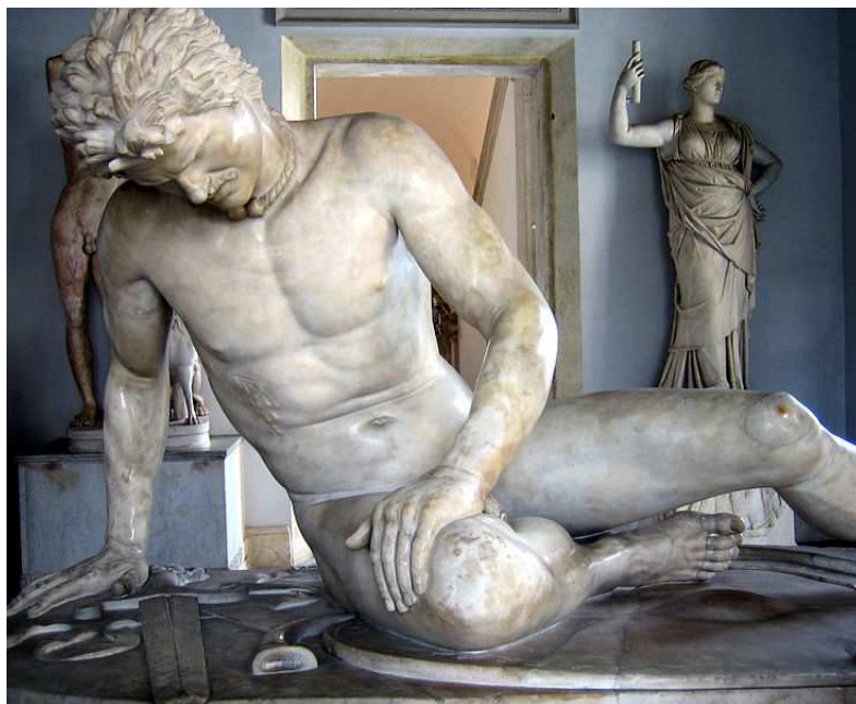
7. Umírající Gal - mramorová římská kopie helénistické sochy (Kapitolské muzeum, Řím)