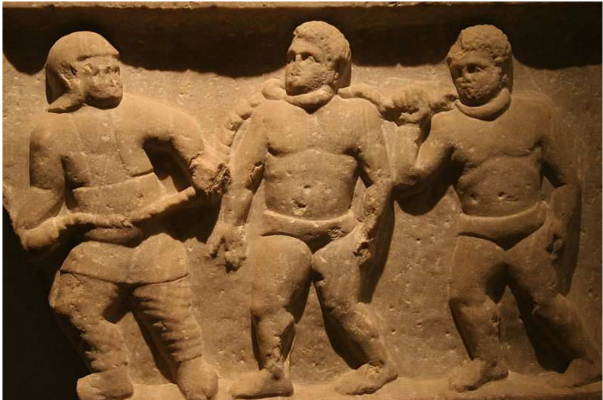
3. Spoutaní římských otroci (přibližně 200 n. l., Ashmolean museum, Oxford)