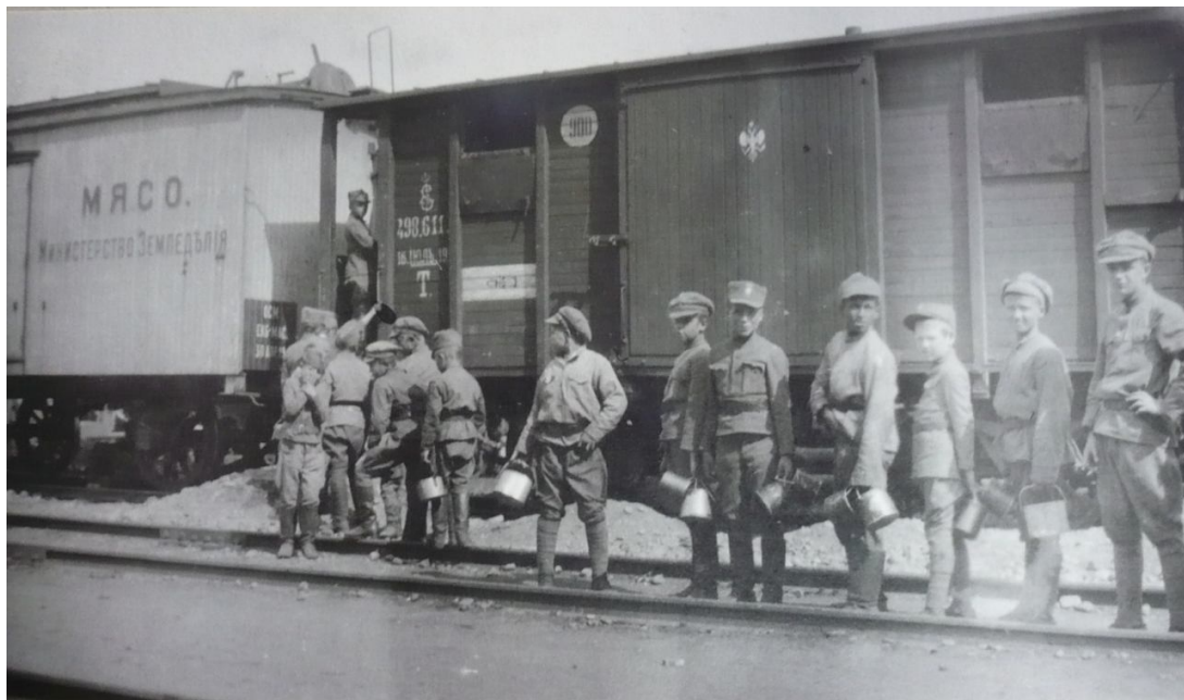
Příloha č. 10. Žáci a personál školy.