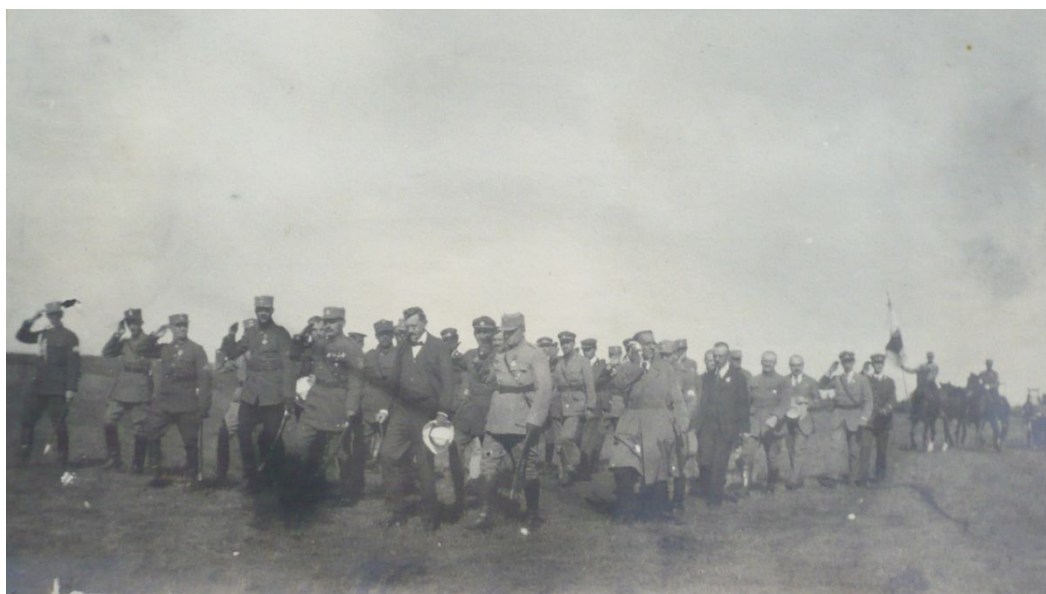
Příloha č. 4. Slavnostní přehlídka první divize.