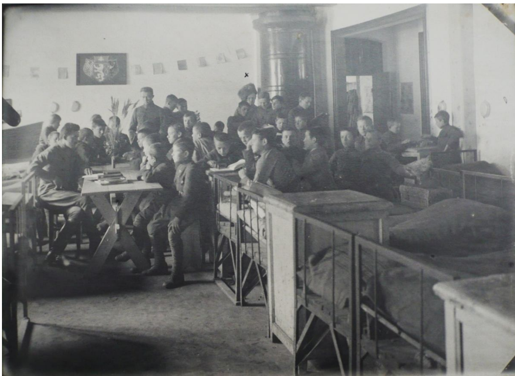
Příloha č. 14. Třetí třída v učebně při psaní.