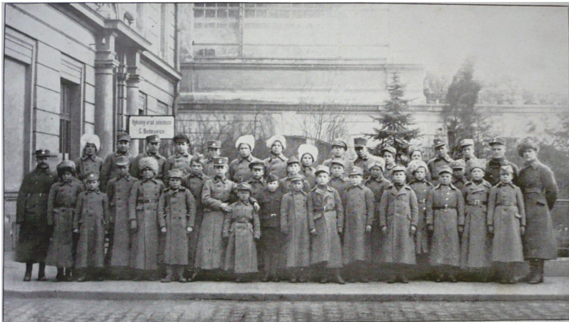
Příloha č. 20. Třetí třída v Českých Budějovicích.