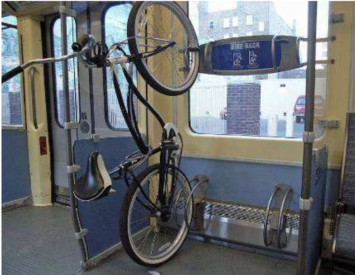
Obrázek 4. 2 Stojany pro kola v MHD v Minneapolis