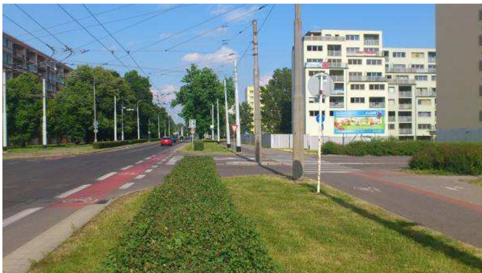
Obrázek 4. 4 Úprava v ulici Bělehradská v Pardubicích. Cyklostezka byla díky prostorovým poměrům komunikace doplněna cyklopruhem.

V současnosti tak Pardubice disponují sítí stezek, které umožňují minimálně v 5 směrech vyjet z centra města až za jeho hranice bez větších konfliktů s automobilovou dopravou. Zůstává však několik míst přímo v centru města, kde bylo vytvořeno několik konfliktních míst především s pěšími, jako je tomu například před obchodním domem AFI, kde návštěvníci opouštějící tento obchodní dům a mířící do historického centra Pardubic míří přímo pod kola přijíždějících cyklistů. Celkově však v porovnání se sousedním Hradcem Králové mohou některá Pardubická řešení působit až přehnaně luxusně. A to když mají obyvatelé k dispozici v jednom směru nejen poměrně komfortní cyklostezky, ale především rychlejší cyklopruhy.