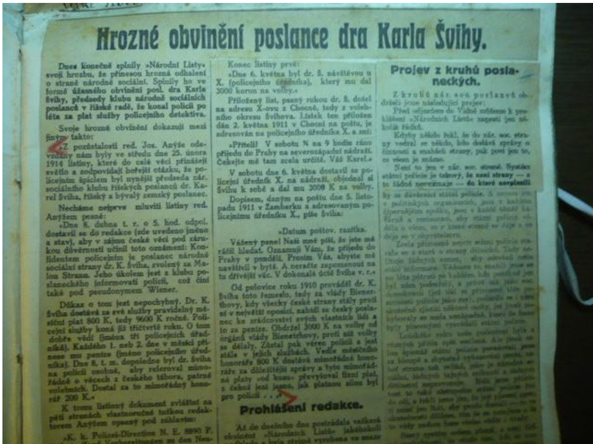
Disciplinární záležitosti.