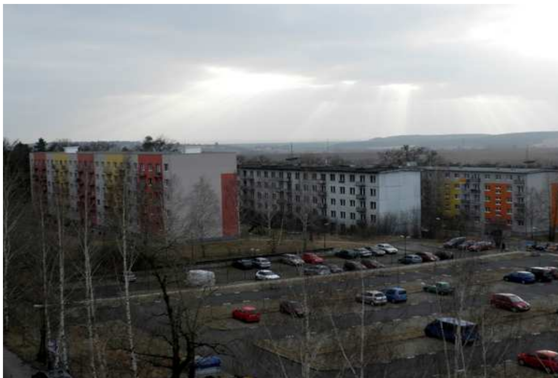
Klasický pohled na dnešní Mladou: postupně renovované sídliště