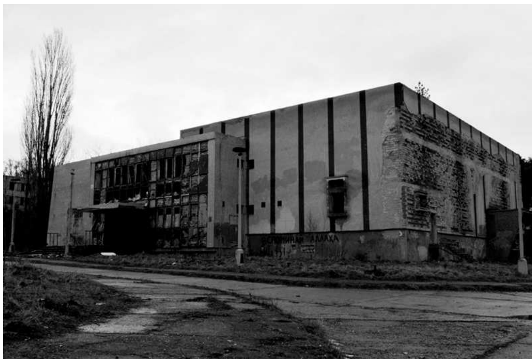
Kulturní středisko a kino na Božím Daru