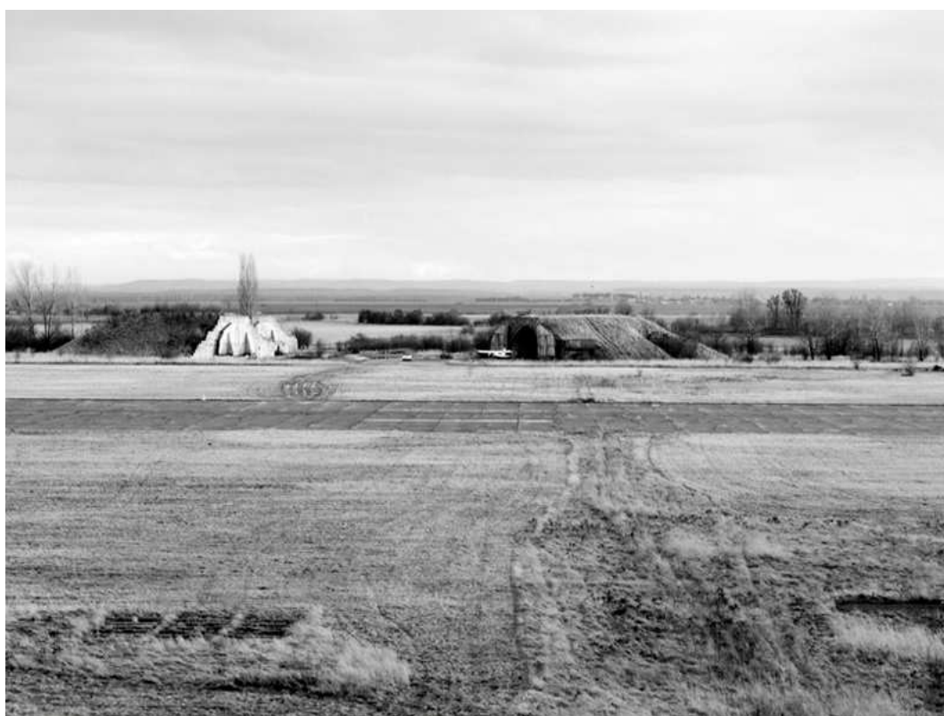
Část letiště Boží dar v pozadí s maskovanými hangáry