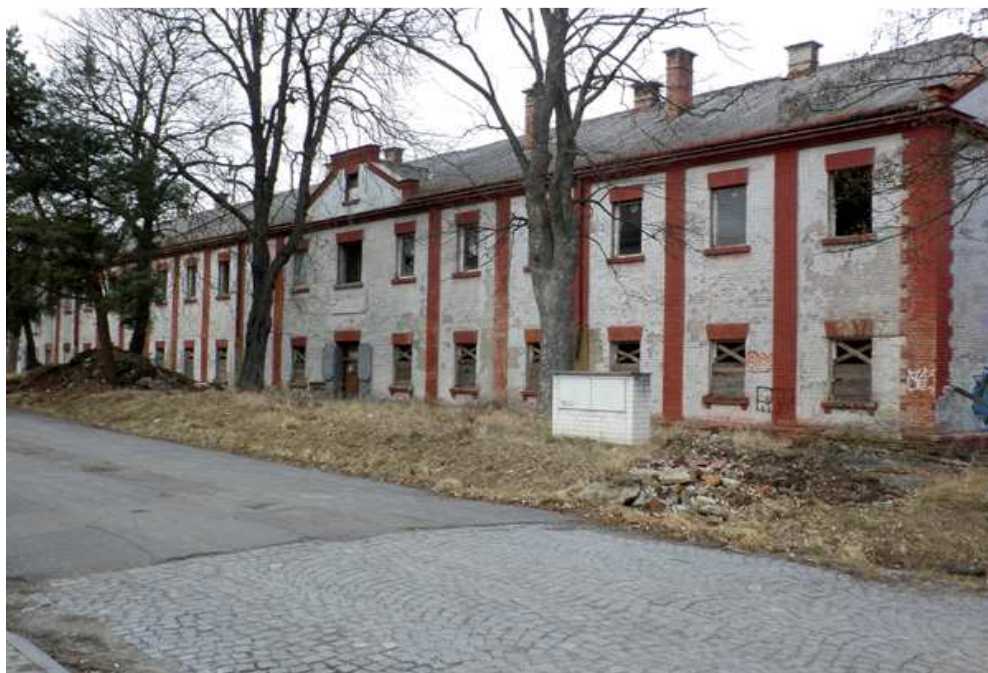
Zdemolovaný barák Kamenného tábora