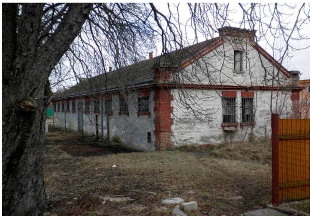
Budova pro ubytování mužstva v bývalém Kamenném táboře