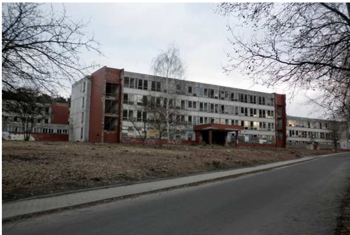
Pohled na čelní stranu základní školy pro ruské děti v Milovicích- Mladé