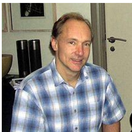
Obrázek č. 1 - Tim Berners-Lee

Roku 2007 byl Timu Berners-Lee udělen Královnou Alžbětou II. Řád za zásluhy. ( http://www.w3.org/People/Berners-Lee/ )