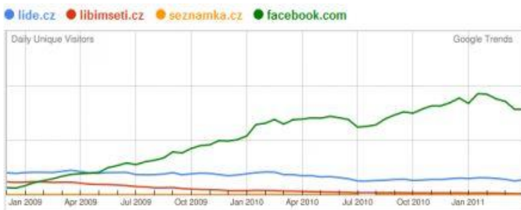
Obrázek č. 5 – Česko a sociální sítě v číslech

Svého času byly tyto sítě nesmírně populární, ovšem s nástupem fenoménu Facebook jejich obliba rapidně poklesla.