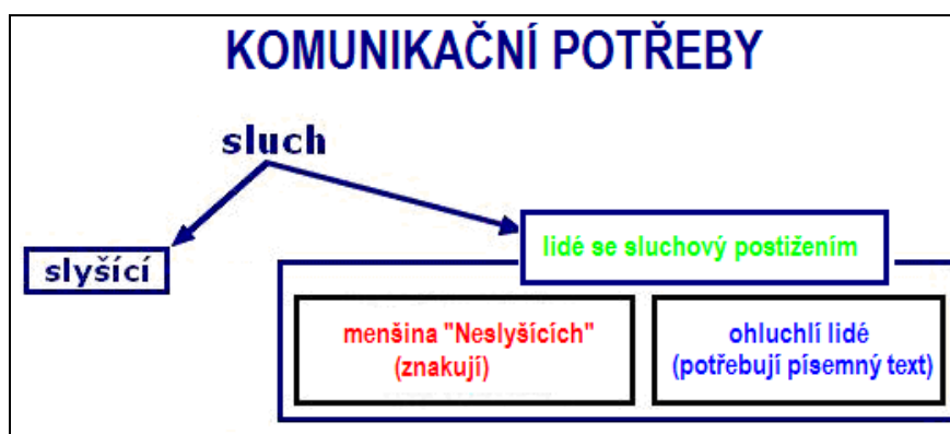
Schéma 2: Komunikační potřeby osob se sluchovým postižením (převzato podle Kratochvíla a upraveno)

Neorganizovanost ohluchlých lidí také způsobuje, že ohluchlí lidé nejsou vidět – není vidět, že neslyší a tím jako kdyby neexistovali. Vidět je jen to, když má někdo proslov, vedle něj stojí tlumočnick a tlumočí do znakového jazyka. Když to uvidí slyšící člověk, vytvoří si asociaci: neslyší = používá znakový jazyk.