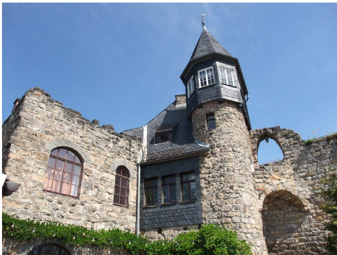
Obr.1 – Hrad Altrathen (Sasko) – dnešní podoba