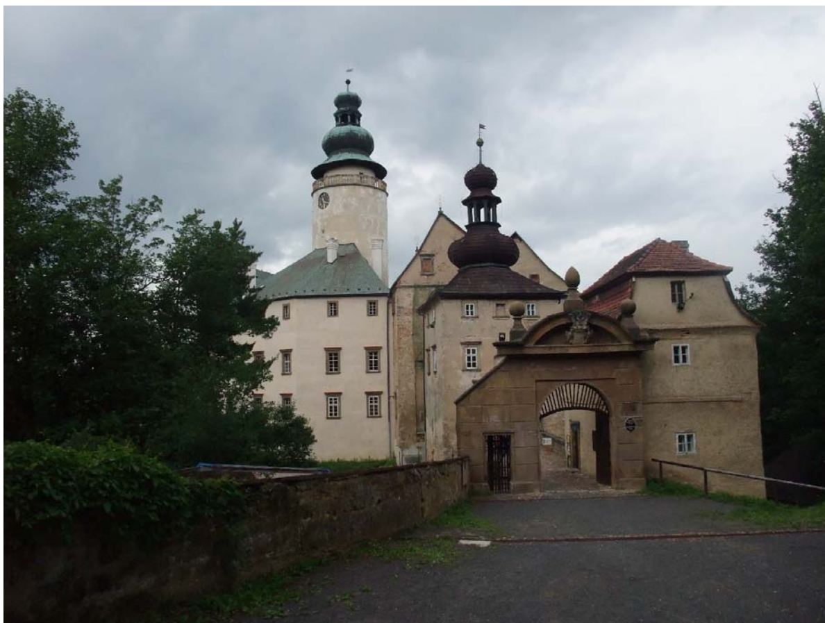
Obr.3 – Hrad Lemberk v Libereckém kraji – dnešní podoba