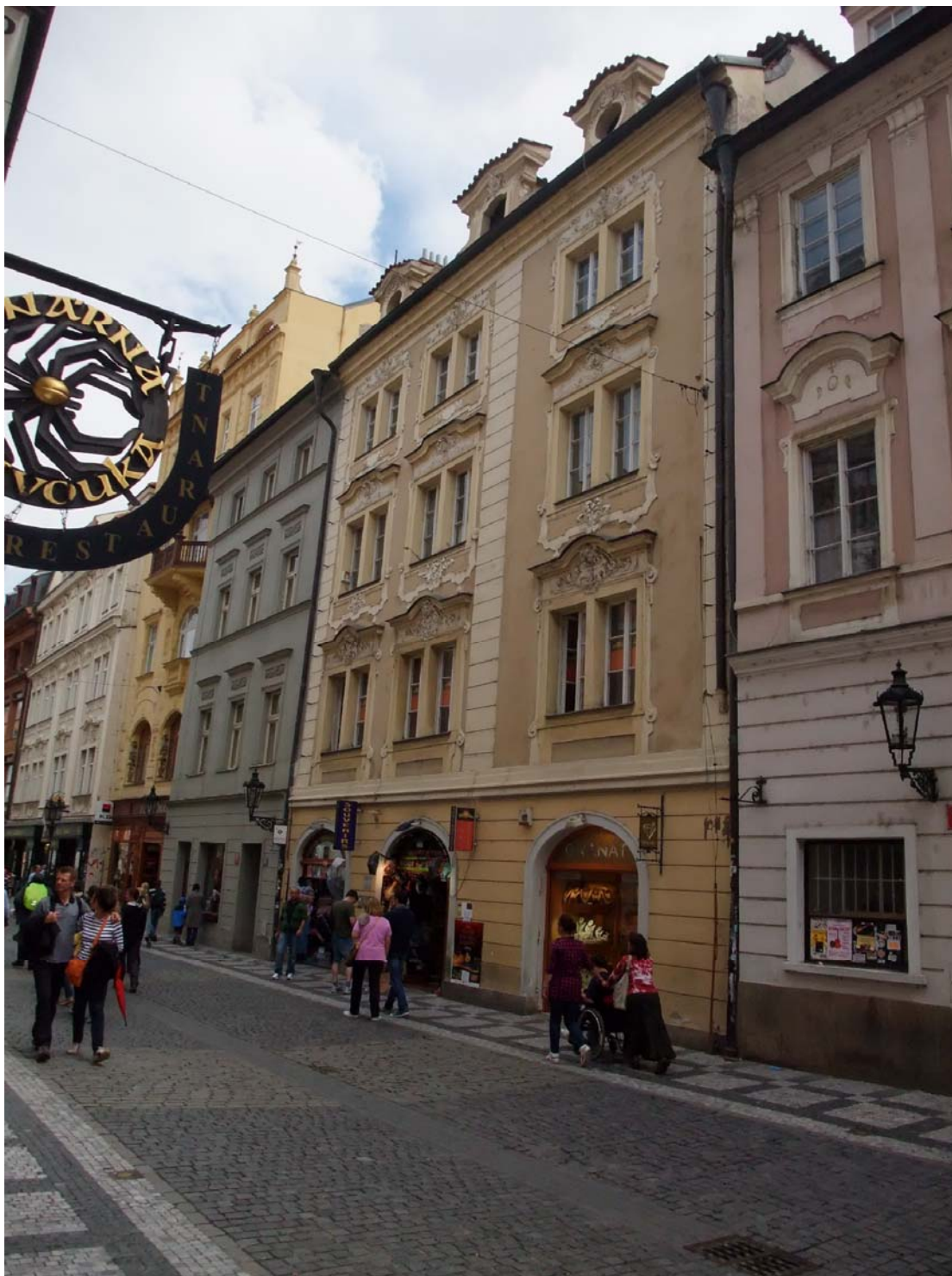
Obr.2 – Elsnicovský dům č.p. 565 v Celetné ulici na Starém Městě pražském (žlutý dům uprostřed) – dnešní podoba