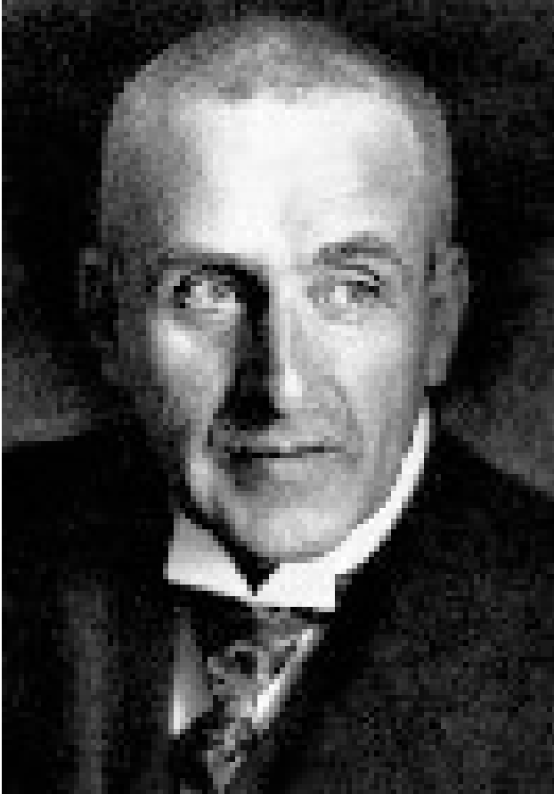
Anlage 3: Frank Wedekind