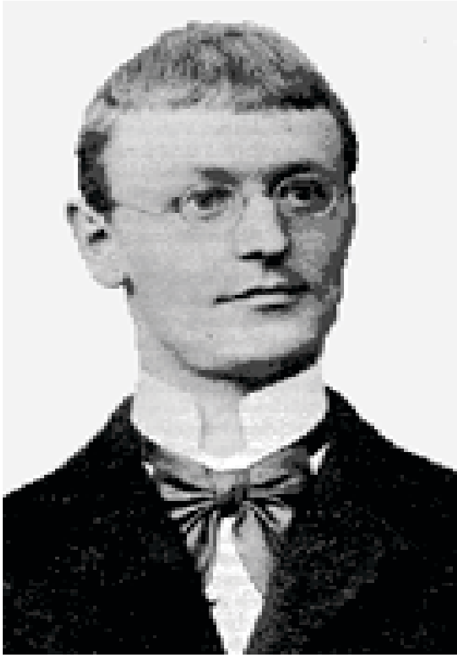
Anlage 1: Hermann Hesse