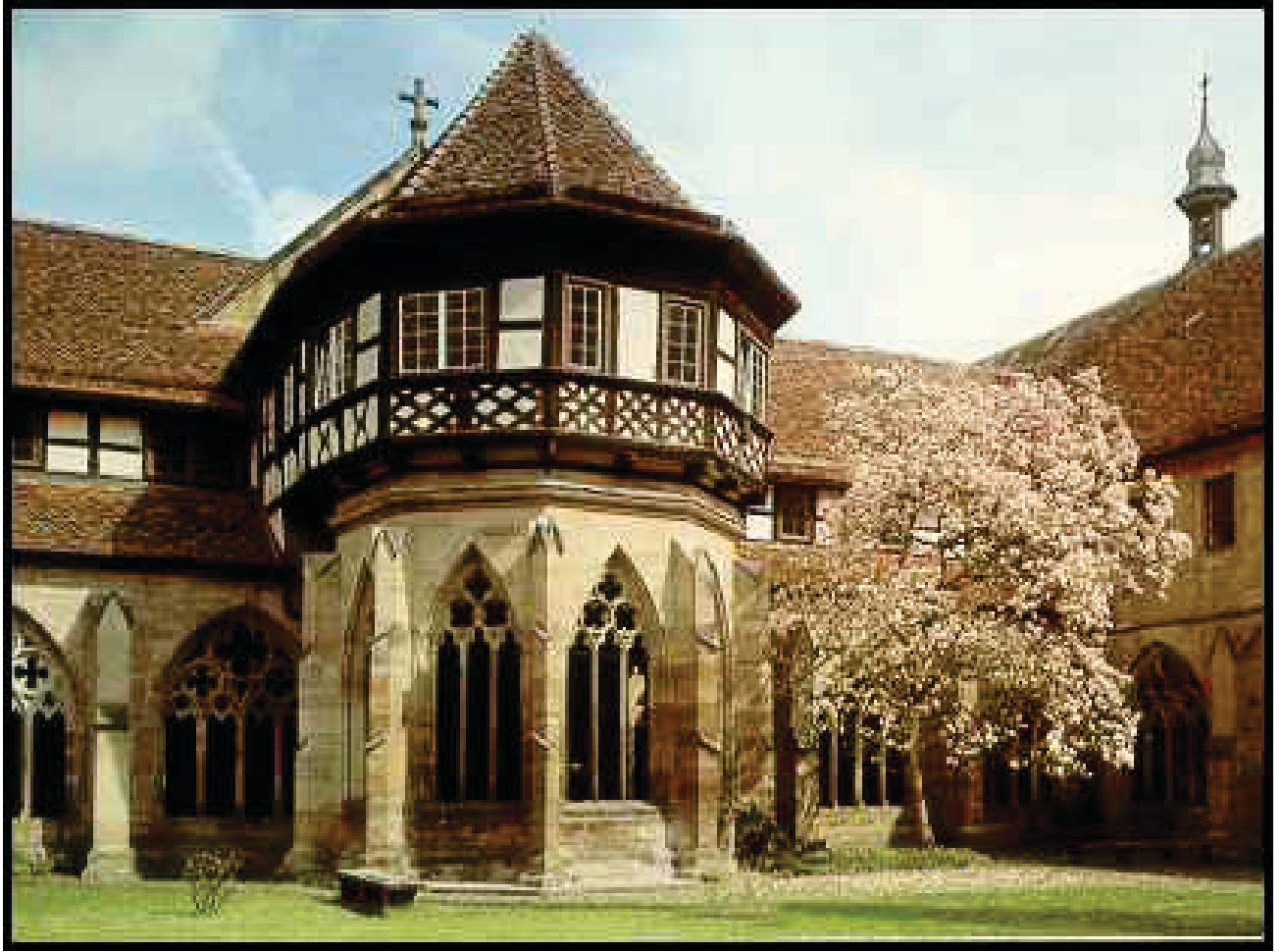
Anlage 2: Kloster Maulbronn