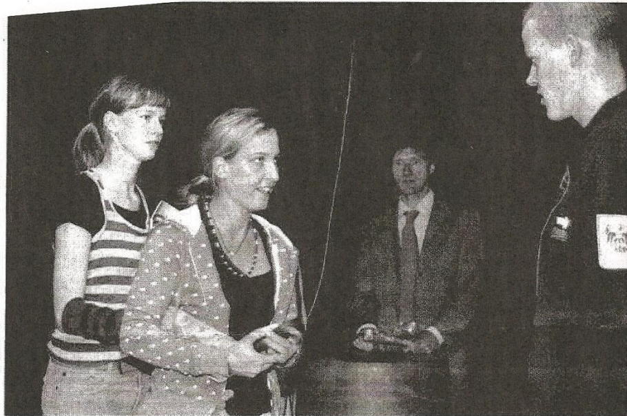
Alltagssituationen ohne und mit Zivilcourage spielten Mitglieder der Mobilien Theatergruppe gestern Nachmittag im Freizeitzentrum Neustadt. In dieser Szene schützt ein Mädchen seine ausländische Freundin vor einem rechten Jugendlichen und droht mit einem Anruf bei der Polizei. Der Förderverein Blitz und das Landratsamt haben den Preis für Zivilcourage 2006 ausgerufen.