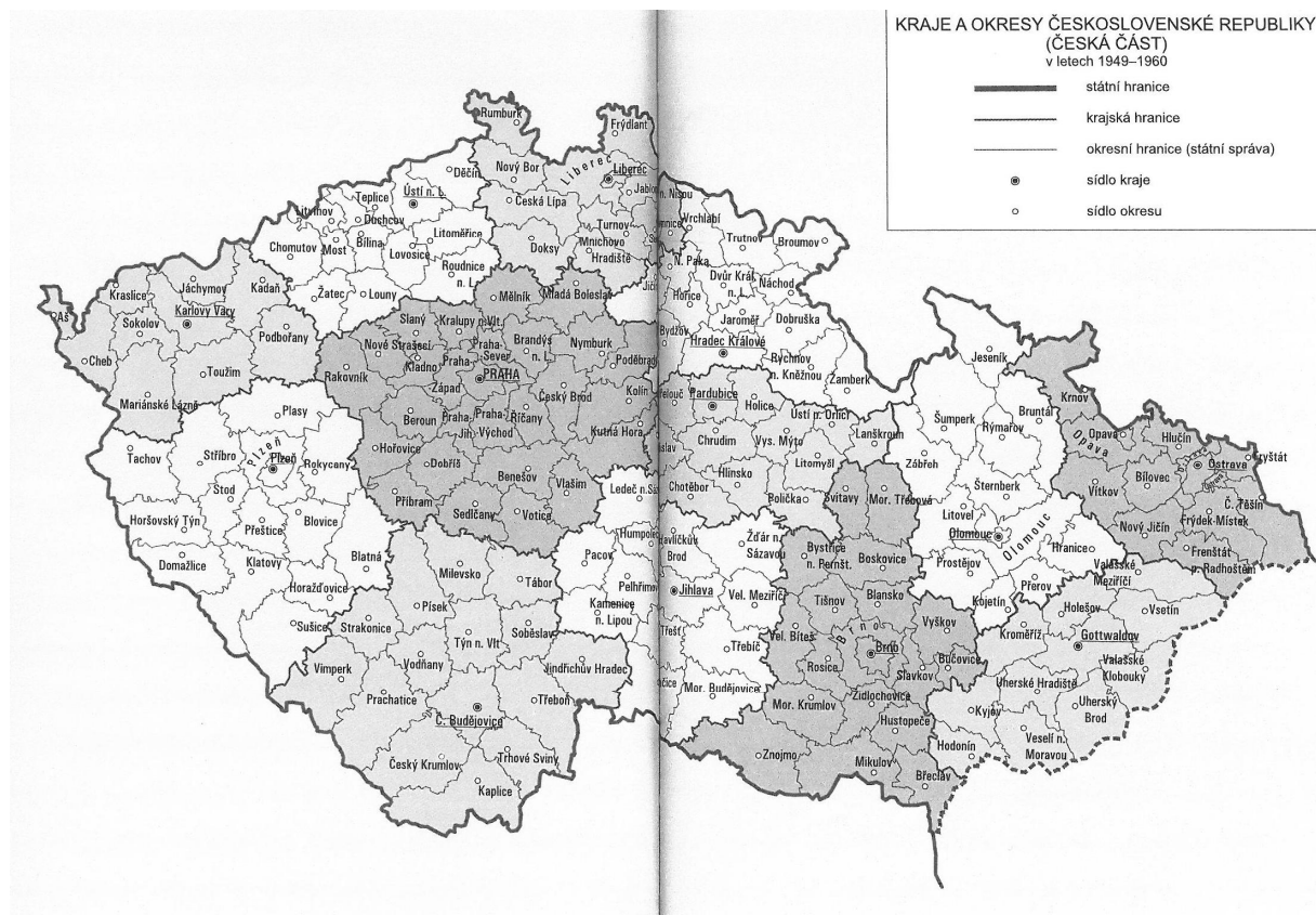
Kraje a okresy československé republiky (česká část) v letech 1949-1960. 173