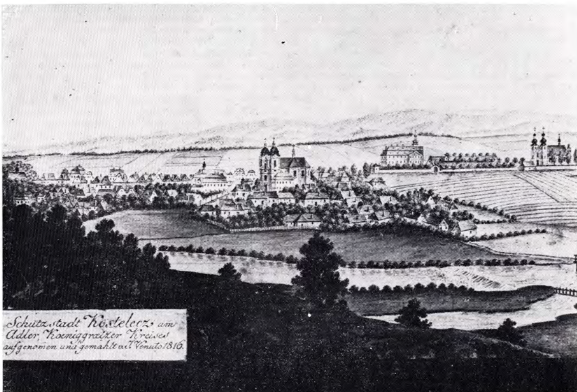
Pohled na město Kostelec nad Orlicí