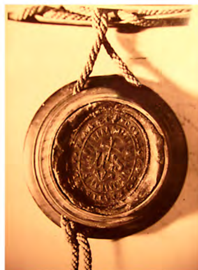
Pečeť kostelecké jezuitské rezidence