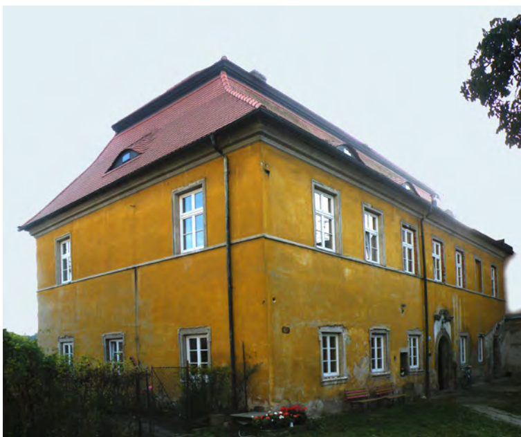
Děkanství v Kostelci nad Orlicí