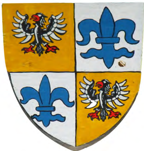
Erb Kašpara z Grambu