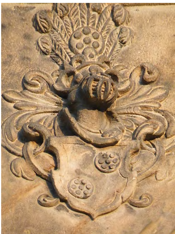
Detail portálu Dvorečku