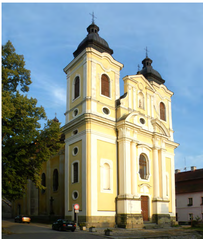
Děkanský kostel sv. Jiří