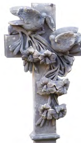
Detail portálu děkanství