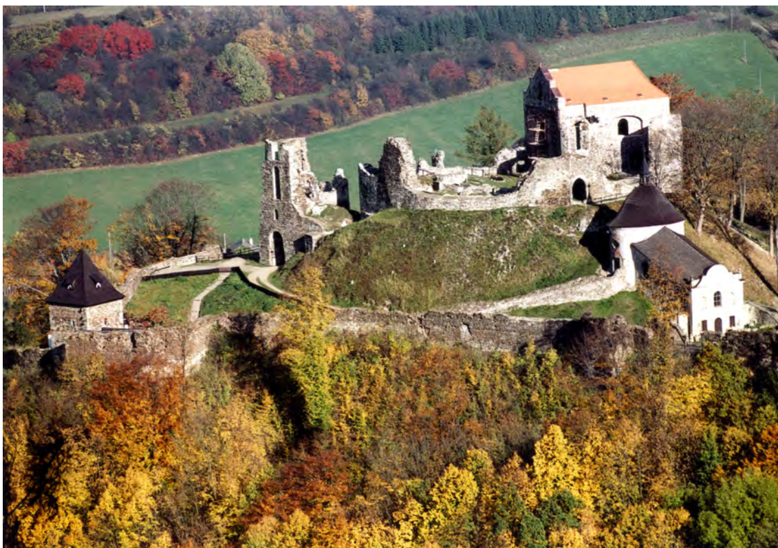
Letecký pohled na hrad Potštejn