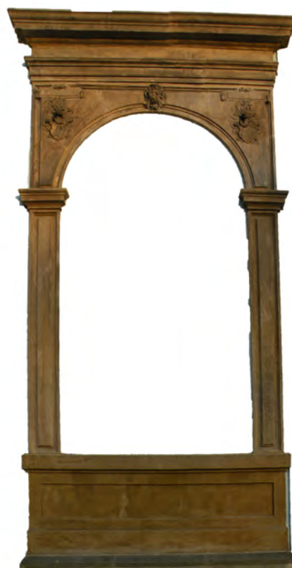
Jediný dochovaný pozůstatek portálu Dvorečku