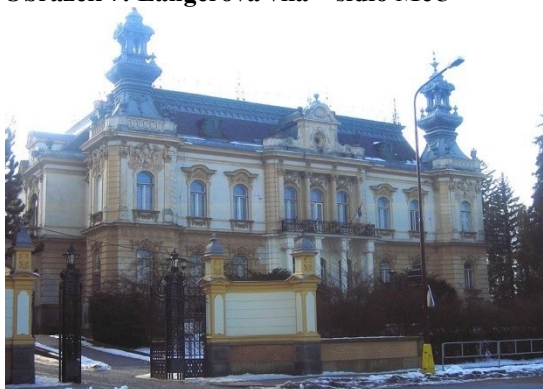
Obrázek 7: Langerova vila – sídlo MěÚ