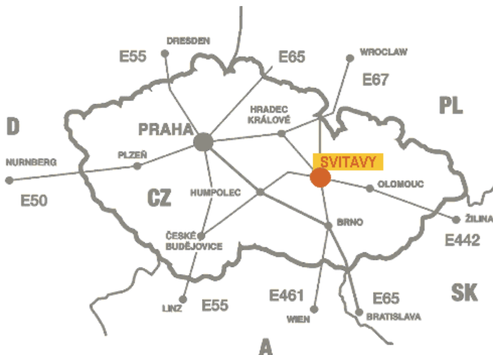
Obrázek 1: Mapa