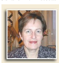
Obrázek 4: Místostarostka