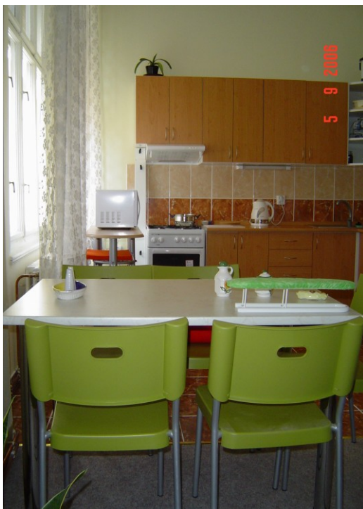
Fotografie 5 – kuchyň v bytě 1