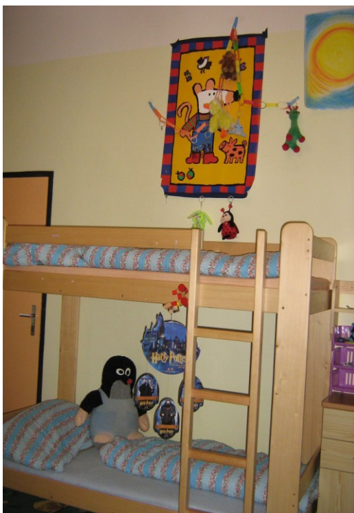
Fotografie 7 – dětský pokoj v bytě 1