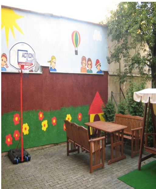
Fotografie 11 – dětský dvůr levá strana