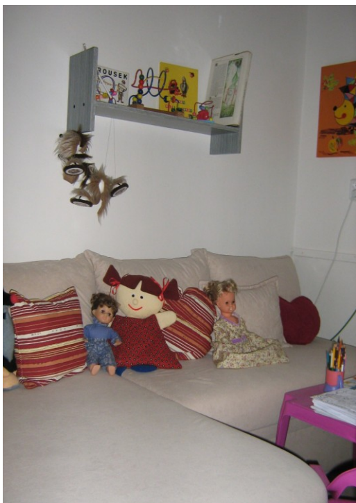
Fotografie 9 – návštěvní místnost