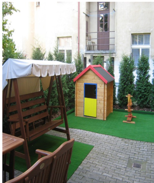
Fotografie 12 – dětský dvůr pravá strana