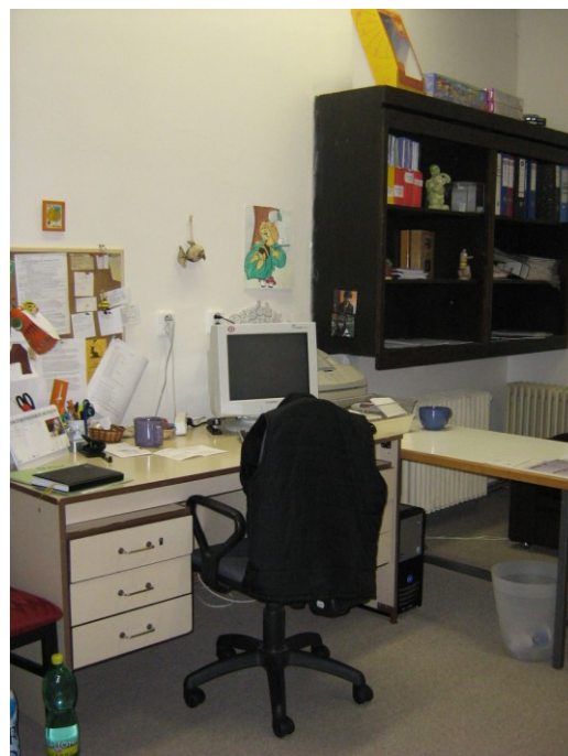
Fotografie 3 – kancelář vedoucí pobočky