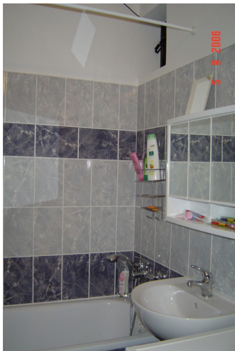
Fotografie 10 – koupelna v bytě 1