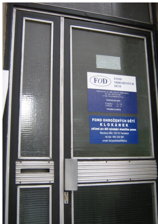
Fotografie 1 – budova FOD a Klokánka