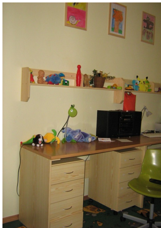
Fotografie 8 – dětský pokoj v bytě 2