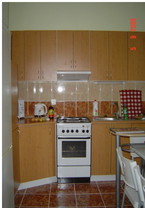
Fotografie 6 – kuchyň v bytě 2