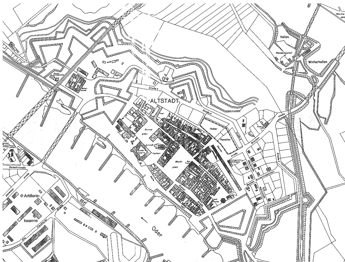
Podoba Kostrzyně kolem r. 1860