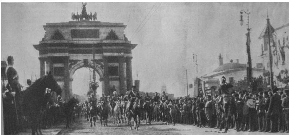
Obr. 12: Průjezd carského průvodu po Tverském bulváru. V čele kolony car Mikuláš II. (Niva, č. 25, 22. 6. 1913, s. 497)

vány z jedné strany lidem, z druhé strany vojskem. V půl páté se carský vlak vydal na cestu k Carskému Selu.