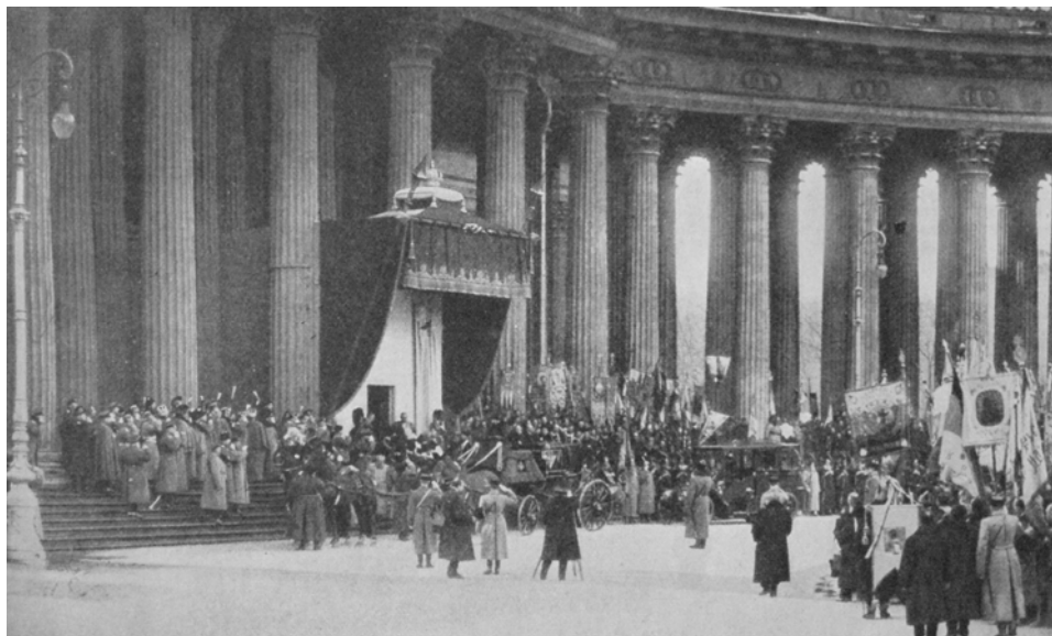
Obr. 2: Příjezd carského průvodu před Kazaňský chrám. (Niva, č. 10, 9. 3. 1913, s. 197)