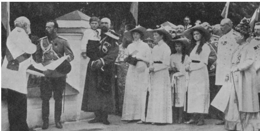
Obr. 11: Car s dětmi před Uspenským chrámem v Rostově Velikém (22. května 1913).