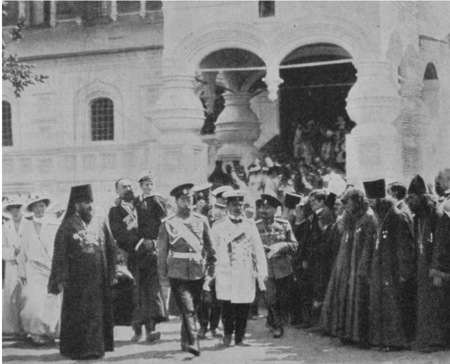
Obr. 7: Carská rodina při odchodu z Ipatjevského kláštera.

V klášteře, v Uspenském chrámu, se konala krátká bohoslužba, přítomni na ni byli kromě carské rodiny členové Státní rady, úředníci carského dvora, ministři, členové svity, dále šlechtici a úředníci kostromské gubernie a potomci členů Velkého poselstva. Součástí kláštera byly také tzv. komnaty Michaila Romanova (v nich v roce 1612 žil), kde si carská rodina prohlédla sbírku ikon a zlatých a stříbrných předmětů. 77