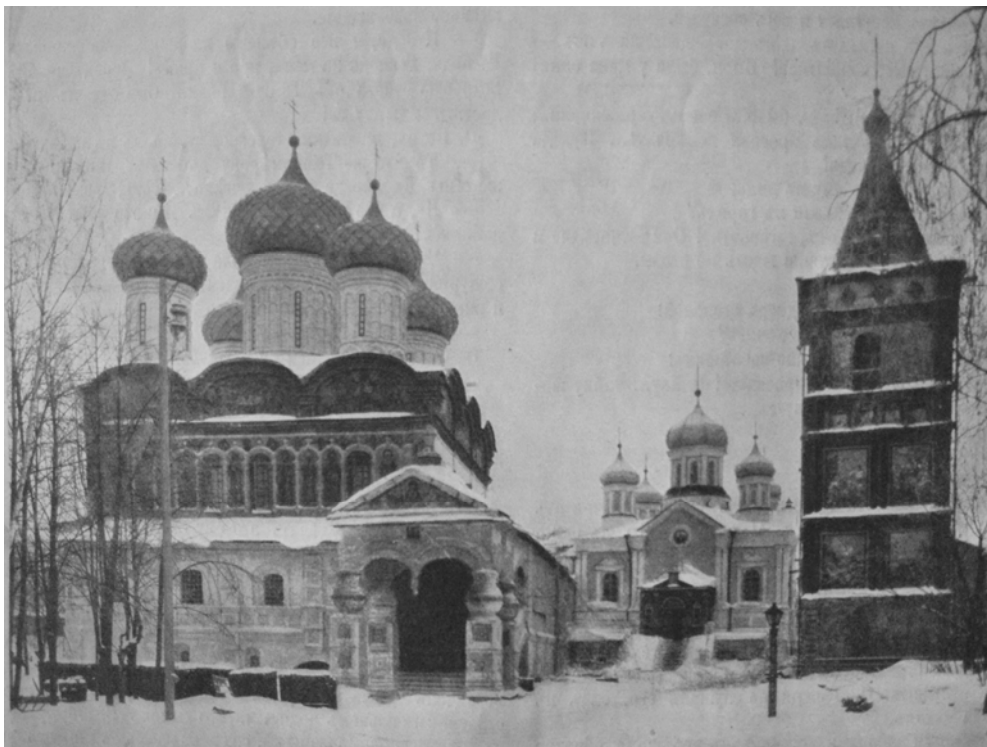
Obr. 6: Ipatjevský klášter v Kostromě. Pohled na Uspenskij chrám. (Niva, č. 7, 16. 2. 1913, s. 121)