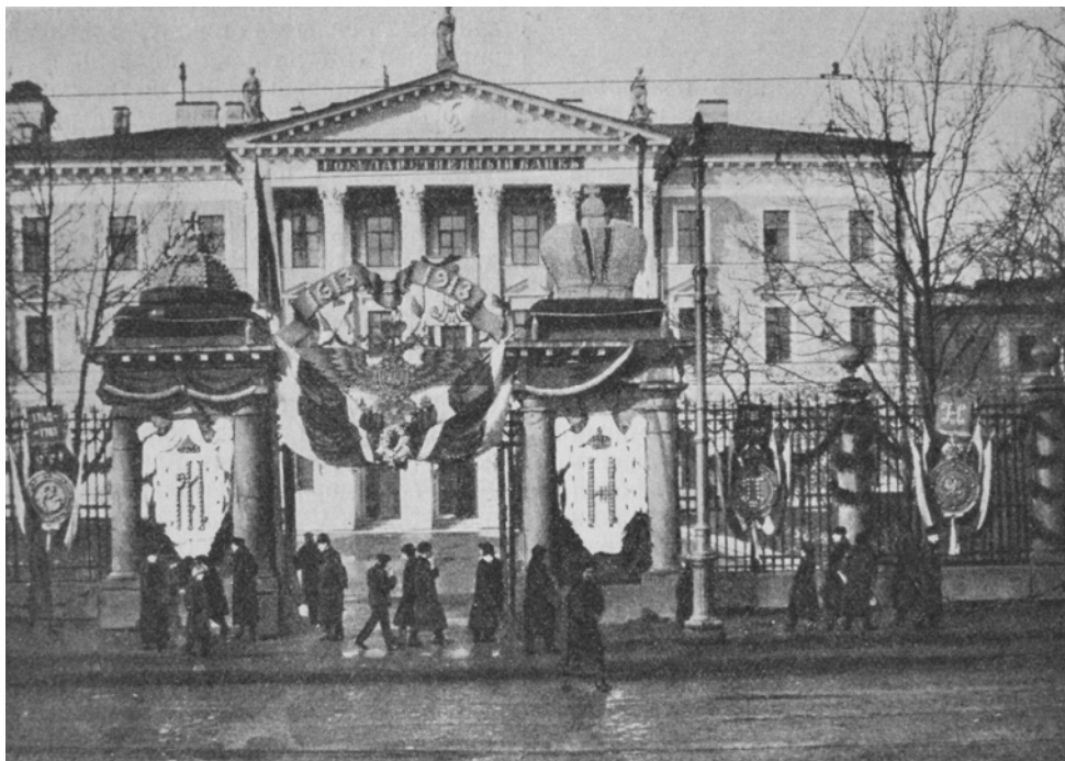
Obr. 3: Výzdoba S.-Petěrburgu během oslav jubilea – budova Státní banky v Sadové ulici. Na bráně vidíme vyobrazení tzv. Monomachovy čapky (vlevo) a carské imperiální koruny (vpravo), mezi nimi dvouhlavý orel – erb Romanovců a současně státní znak Ruska. (Niva, č. 10, 9. 3. 1913, s. 199).

nikoho, byť monarchisté se „návštěvou u cara“ pyšnili, a když kolem nich Mikuláš procházel, dávali svou přítomnost halasně najevo výkřiky „Hurá“ a „Bože, chraň cara“. 62 Carský dvůr tím již po několikáté projevil slabost vůči tlaku ultrapravice a bezpochyby si tím uškodil.