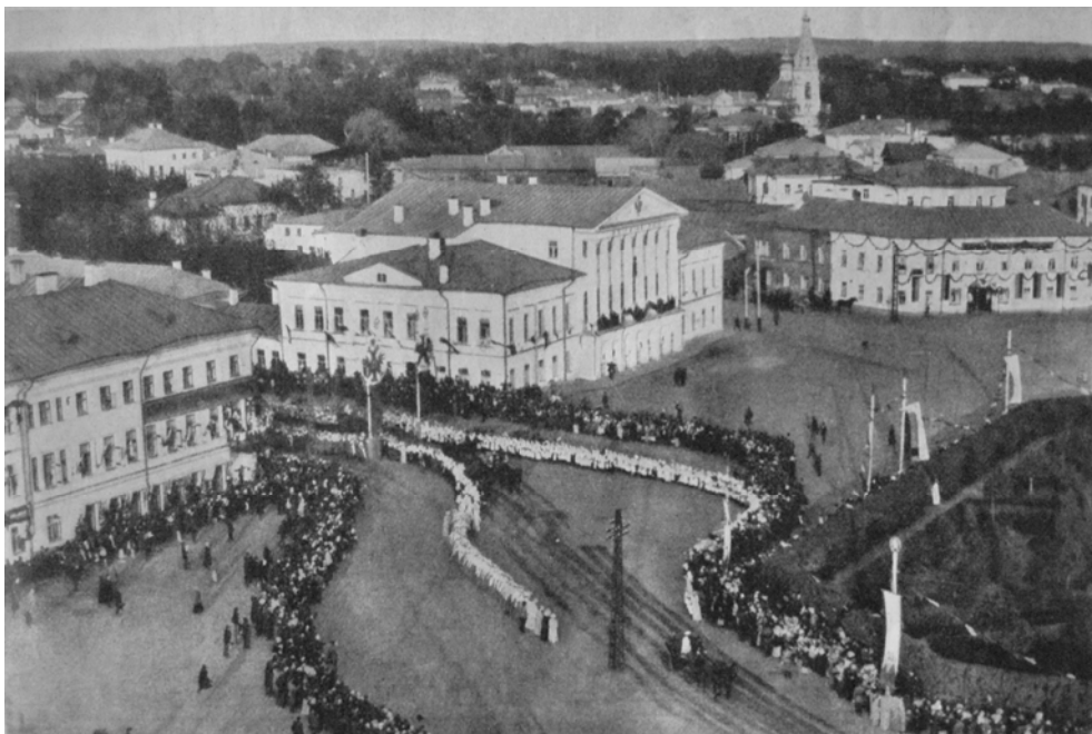
Obr. 10: Příjezd carského průvodu na Susaninovo náměstí v Kostromě (20. května 1913). (Niva, č. 24, 15. 6. 1913, s. 479)

Následující tři dny tvořily jakousi mezihru před všemi očekávanou návštěvou Moskvy, o volnějším tempu však nemohlo být řeči. 21. května se carská rodina nacházela v Jaroslavlí, odtud pokračovala vlakem do Rostova (22. května). V obou městech se odehrály obligátní uvítací rituály a na programu byla především návštěva církevních objektů. V Jaroslavlí na prvním místě Spasského kláštera, kde pobýval Michail Fjodorovič Romanov při cestě z Kostromy do Moskvy. V Rostově si car s dětmi (bez carevny, která se necítila dobře a celý den proležela) se zájmem poslechl zvonkohru v Uspenském chrámu a delší čas strávil v Kremlu. 83 I další program byl poměrně náročný. Dopoledne 23. května carský vlak přijel do stanice Petrovsk. Na nádraží cara uvítali představitelé městské správy, za městem se setkal s delegacemi rolníků. Po krátké prohlídce města pokračovala kolona asi dvaceti automobilů do Pereslavli, vzdálené přibližně padesát verst. Návštěva Pereslavli byla carovi velmi příjemná. Zejména se mu líbilo přijetí šlechtou Vladimirské gubernie. Konalo se v jejím sídle na Pleščejevském jezeře, kde si také prohlédl malé muzeum uchovávající exponáty spojené s Petrem Velikým (např. člun, na kterém se plavil po jezeře). 84