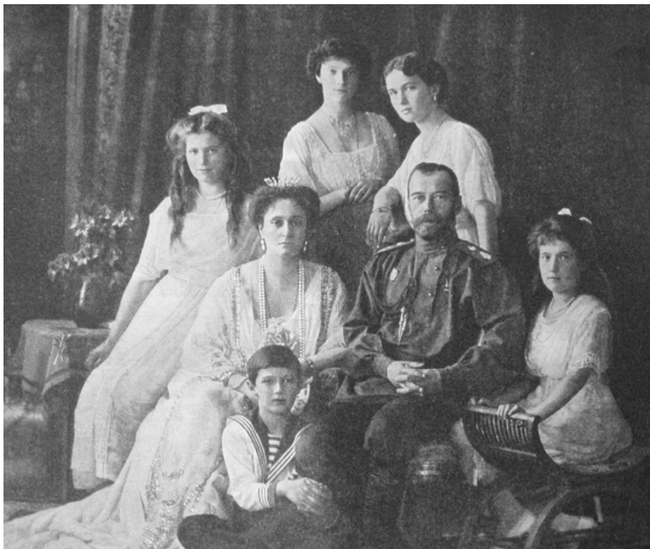
Obr. 1: Carská rodina v roce 1913. Uprostřed Mikuláš II., po jeho pravici carevna Alexandra Fjodovna. Zprava doleva velkokněžny Marie, Taťána, Olga a Anastázie. V popředí následník trůnu carevič Alexej. (Niva, č. 35, 31. 8. 1913, s. 685)

politických vězňů, k čemuž nedošlo. Amnestie byla značně selektivní. Navíc řada exulantů na protest proti vládní politice možnost návratu do Ruska odmítla. 30