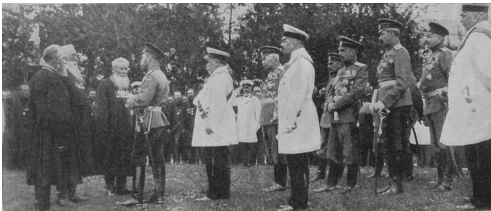
Obr. 4: Car hovoří s volostními staršiny nižegorodské gubernie (Niva, č. 23, 8. 6. 1913, s. 457)