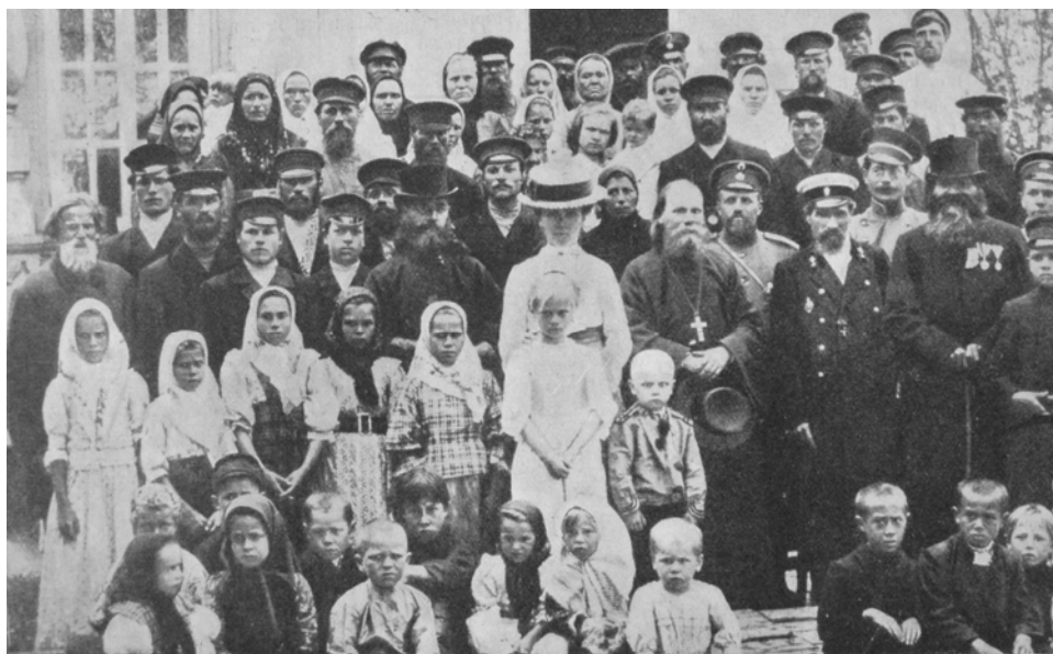
Obr. 9: Potomci Ivana Susanina, bělopašci, ve vesnici Korobovo.

bernátora. Tam v zahradě přijal několik významných osobností gubernie, volostní staršiny a setkal se s bělopašci , rolníky, kteří byli přímými potomky Ivana Susanina. Žili v okolí Kostromy a na věčné časy byli osvobozeni od daní. Setkání s nimi zdůraznilo susaninovskou legendu, která přesně odpovídala Mikulášovu přesvědčení o duchovním spojení mezi ním a lidem. Potom se car sešel s důstojníky Pultuského pluku a vrátil se na Mežeň , kde posvětil. Oficiální program pokračoval ještě v pozdním odpolední, Mikuláš mimo jiné navštívil novou budovu Červeného kříže a prohlédl si guberniální výstavu v Městském pavilónu, připravenou zemstvem. Vše bylo „zajímavé, ale unavující“. 81