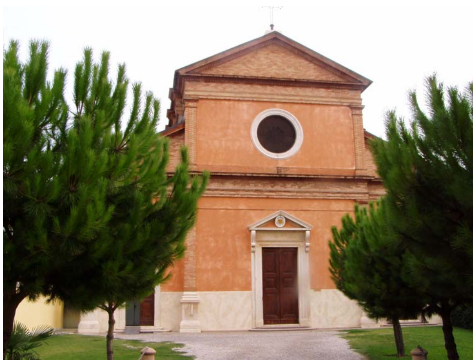
Obrázek 1: Sant Alberto. Dnešní kostel Sant'Alberto (farnost S. Adalberto) ve stejnojmenné obci.

Na jaře roku 1010 se do čela největší z pereonských misí postavil sám Romuald. 56 Již na uherských hranicích však svou skupinu opustil a vrátil se zpět. Dle Petra Damianiho důvodem Romualdova návratu byla nemoc spolu s vysokým věkem. 57 Jeho žáci však pokračovali v cestě. Patnáct jich zůstalo v Uhrách, dva další se měli vydat do Čech. 58 O této dvojici nemáme z jiných pramenů žádné zprávy. Christianizace Čech, alespoň ta oficiální, byla skončena a oblast tak nebyla výslovným misijním územím. Je otázkou, zda-li měl Romuald a jeho skupina dostatek informací o situaci v Čechách. Z pramenů není ani patrný případný návrat dvojice z misijní cesty v Čechách.