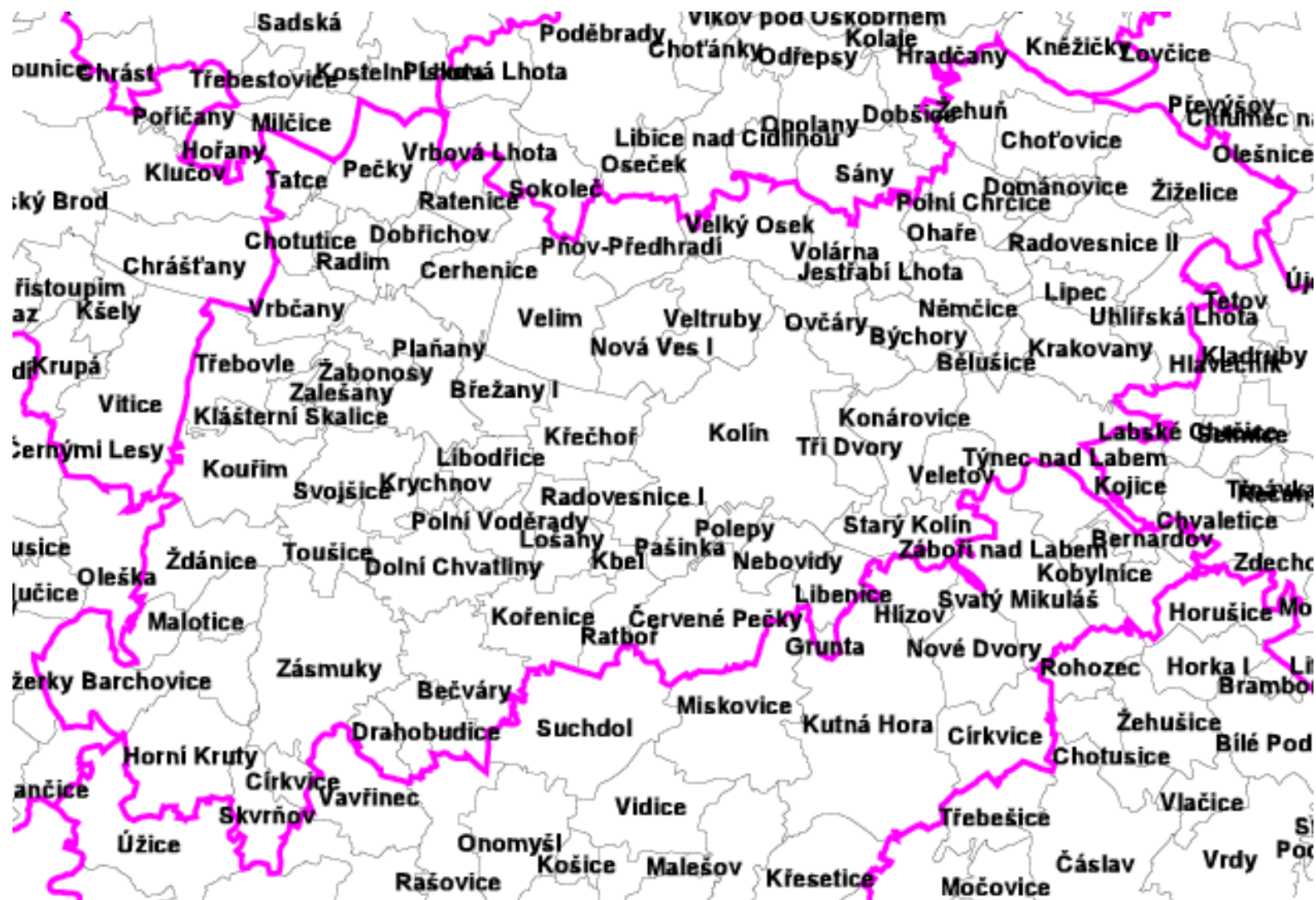
Příloha č. 2 – Mapa správního obvodu obce s rozšířenou působností Kolín