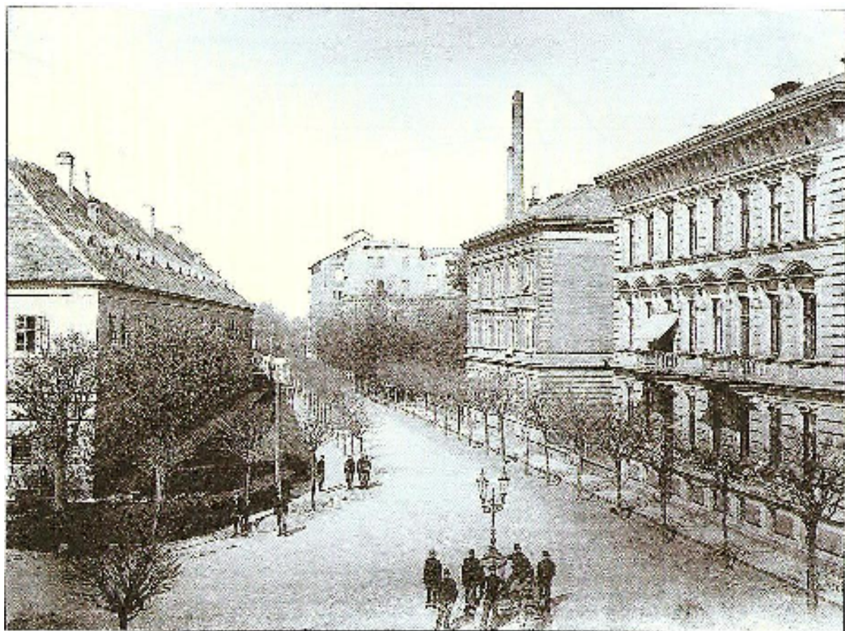
Komenského třída s pivovarem z jezdeckých kasáren. Počátek 20. století.