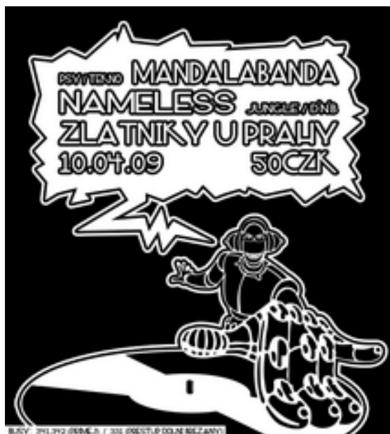
Obr. 1. Pozvánka na akci. Na obrázku grafická reinterpretace „the massage is in the music“ (z angl. „to poselství je v hudbě“) zobrazena do podoby Dj s komixovou bublinou u úst.