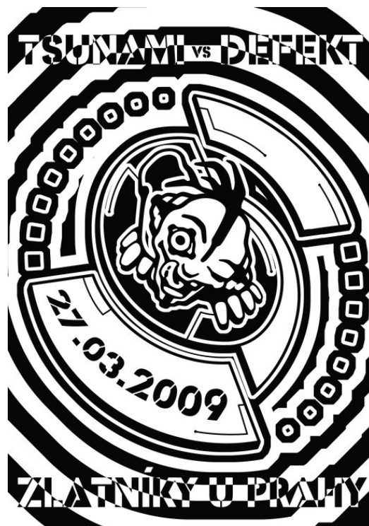
Obr. 2. a Obr. 3. Na obrázku (opět prezentovány veřejně jako pozvánky na akci) grafické zpracování techno-terroristy nebo techno-piráta, kde je dodržena tradiční symbolika jednookého piráta, přičemž namísto náplasti, je oko uměle napojeno na jiný zdroj. Třebaže se jedná o naprosto odlišné sound systémy, kyberpunková rétorika na pozvánkách je zde téměř shodná.