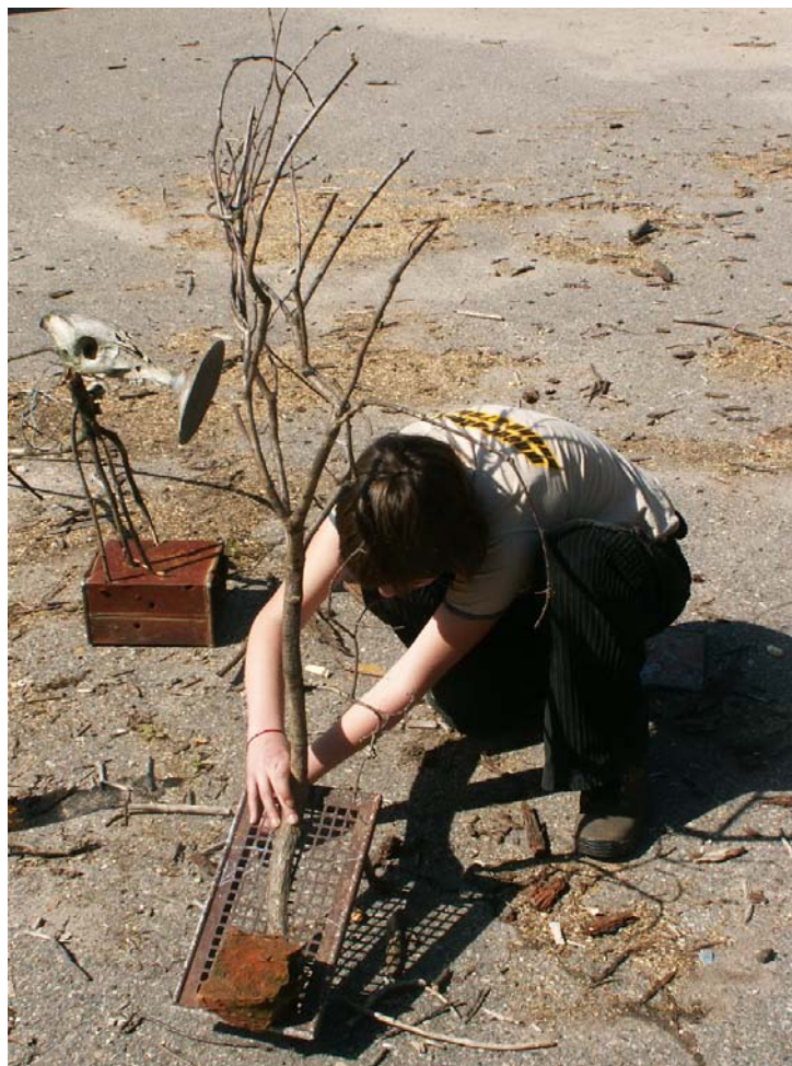
Obr. 6. Skulptura vytvořená na freepárty Banda Crew