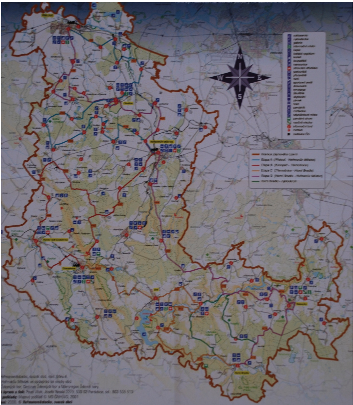
Obrázek 3 - cyklotrasy Železných hor