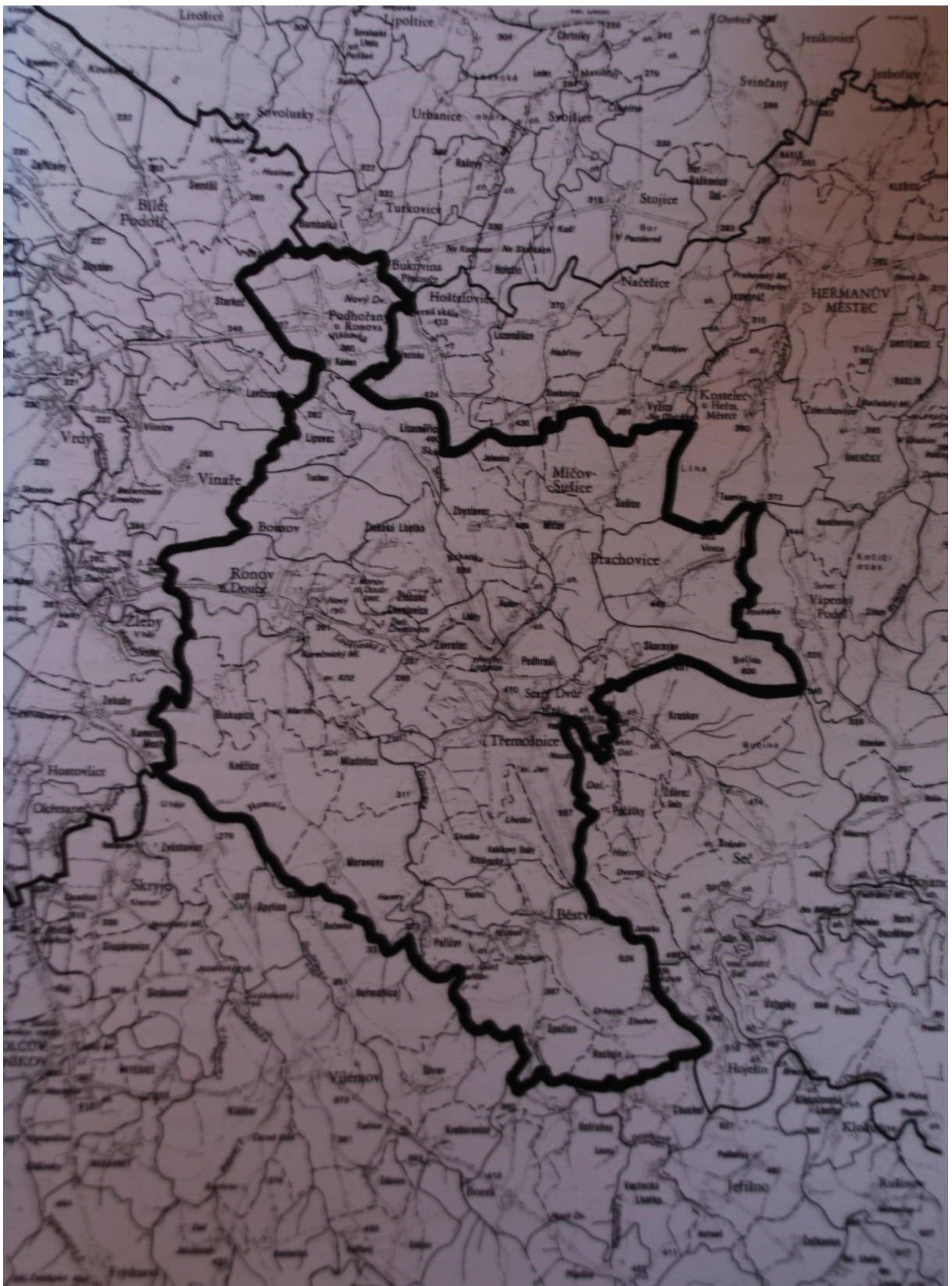
Obrázek 4 - Zájmové území Mikroregionu Železné hory