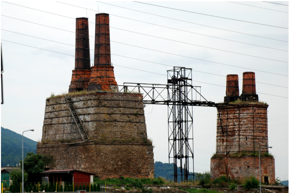
Obrázek 1 - Vápenka