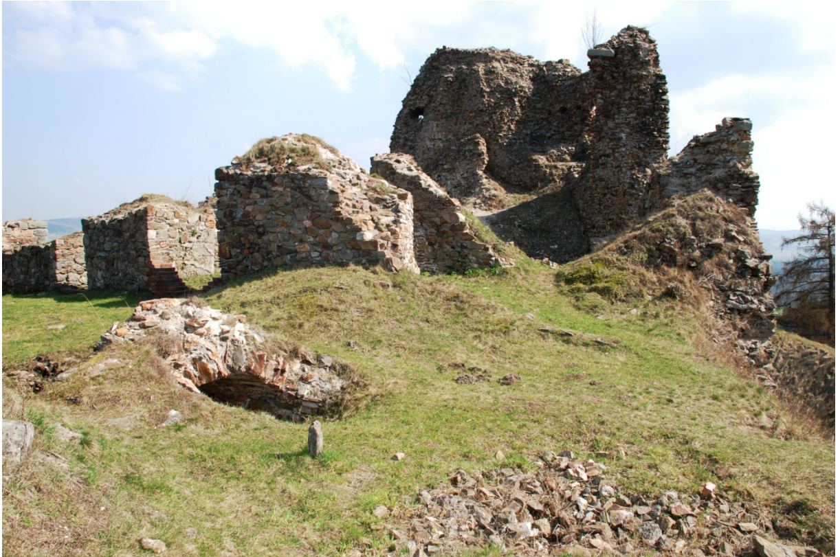
Obrázek 2 - Zřícenina hradu Lichnice