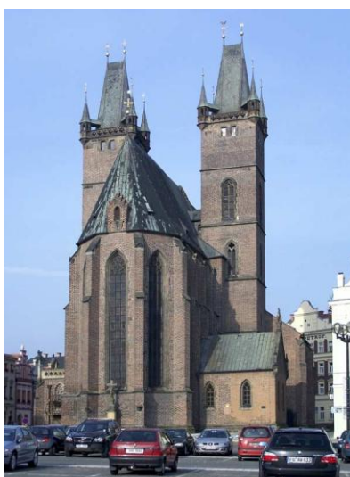
Obrázek č. 1: Chrám sv. Ducha

Tradiční událost Slavnosti královny Elišky se v Hradci Králové slaví od roku 2002, kdy bylo toto město spojeno s numericky zajímavým výročím 777 let od první písemné zmínky o Hradci Králové jakožto o městě. Eliščiny slavnosti jsou pořádány na konci srpna nebo začátkem září na Velkém náměstí v Hradci Králové. Přípravy na slavnost probíhají od konce té poslední. Městským radovánkám předchází měsíce příprav, shánění kostýmů a pomůcek. Na celé akci pracuje cca 200 účinkujících. Je potřeba podat žádost o finanční podporu, naplánovat financování celé akce, propočítat náklady, příjmy a vyčíslit zisk nebo ztrátu. Zatím poslední oslava příjezdu královny Elišky, konaná v roce 2008, byla spojena se 700. výročím založení Chrámu sv. Ducha, který nechala Eliška postavit. Silueta Chrámu sv. Ducha tvoří spolu s Bílou věží a kopulí kaple sv. Klimenta panoráma tak jedinečné a působivé, že je považováno za symbol města. Město po celý rok pořádá řadu akcí, z nichž nejznámější je např. Entrée k tanci, Jazz Goes to Town, Divadlo evropských regionů, Rock for People, Královéhradecké krajské dožínky a mnoho dalších.