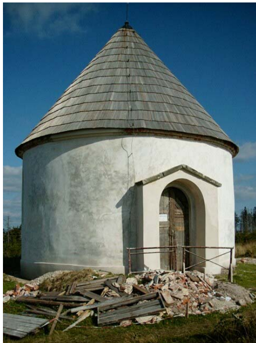
Obr. 9 Kaple při rekonstrukci v roce 2003