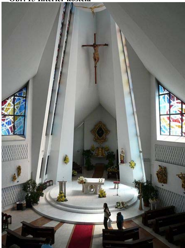
Obr. 15 Interiér kostela

Zdroj:< http://cs.wikipedia.org/wiki/Soubor:Pohled_na_interi%C3%A9r_B%C5%99eclav.jpg >