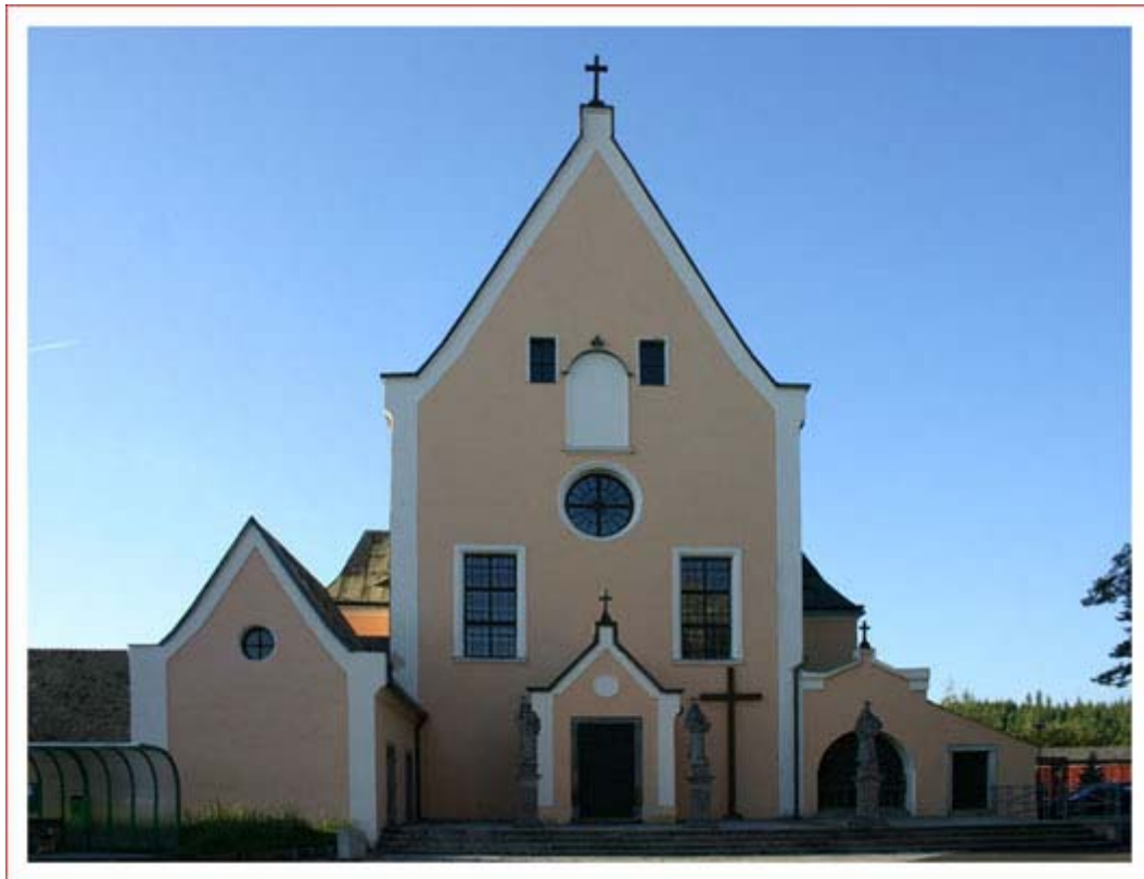
Obr. 3 Kostel sv. Antonína z Padovy