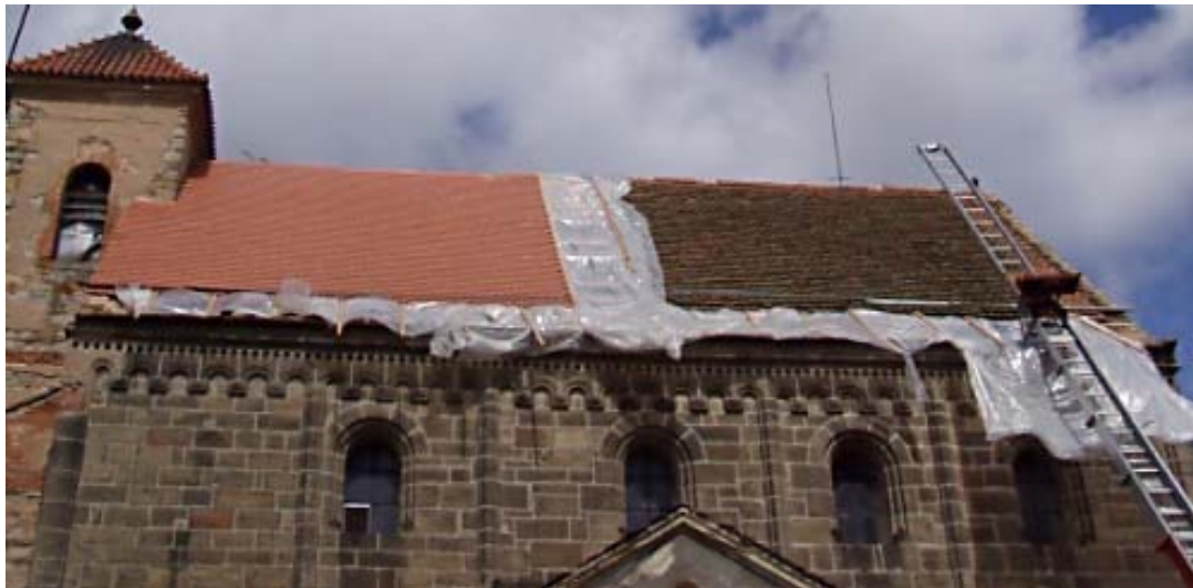
Obr. 13 Oprava střechy