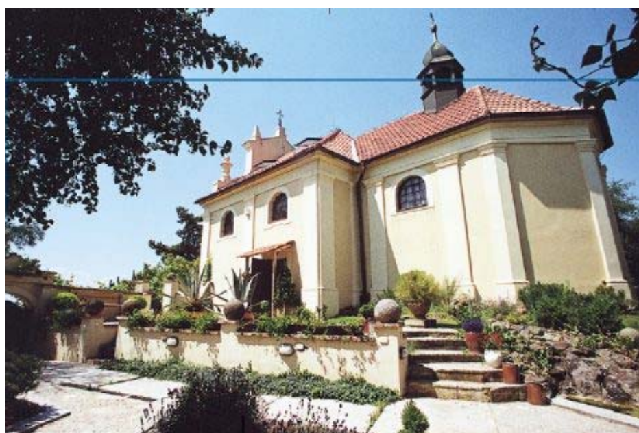
Obrázek 15: Kostel sv.Jana Nepomuckého

http://www.heidelberg.cz/hdnew/HDinfo/clanky/img_2003_2/2003_2_14_1.jpg