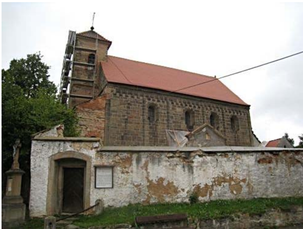
Obr. 14 Kostel po rekonstrukci střechy