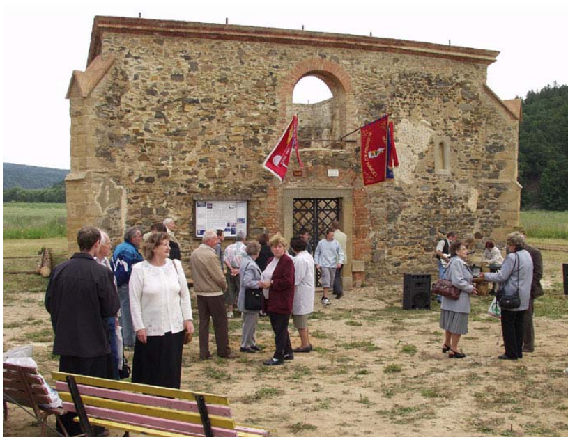
Obr. 1 Kostel před rekonstrukcí v roce 2004

zdroj: http://kronikaregionu.wz.cz/gallery/01/view.php?num=8 Dolany