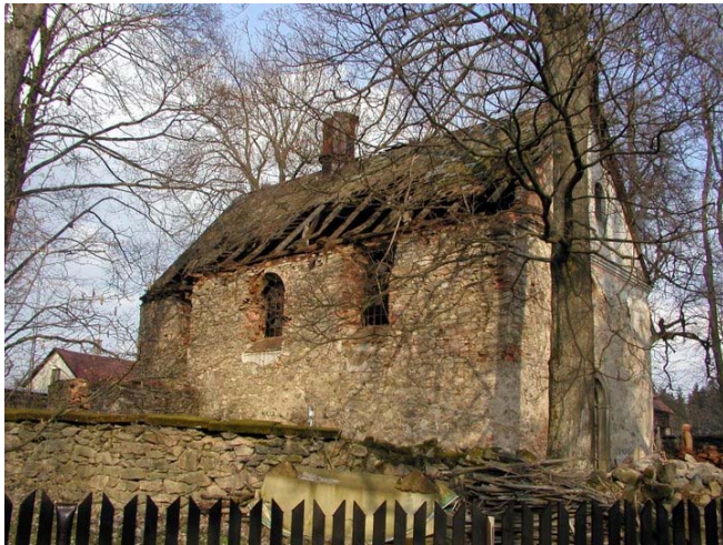
Obr. 5 Kostel sv.Kunhuty před rekonstrukcí únor 2008