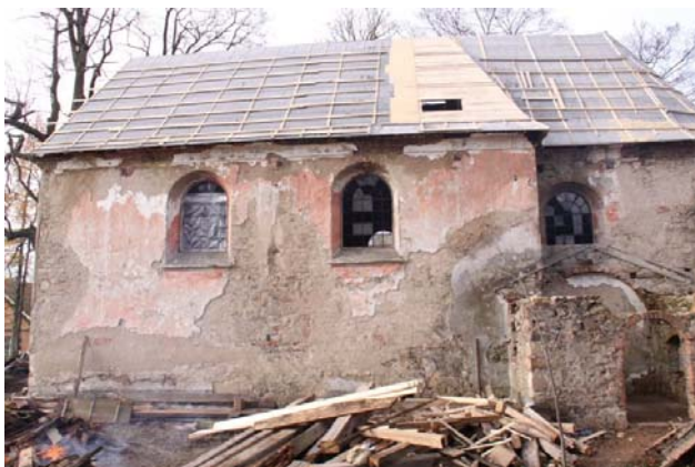
Obr. 7 Provizorní oprava střechy listopad 2008