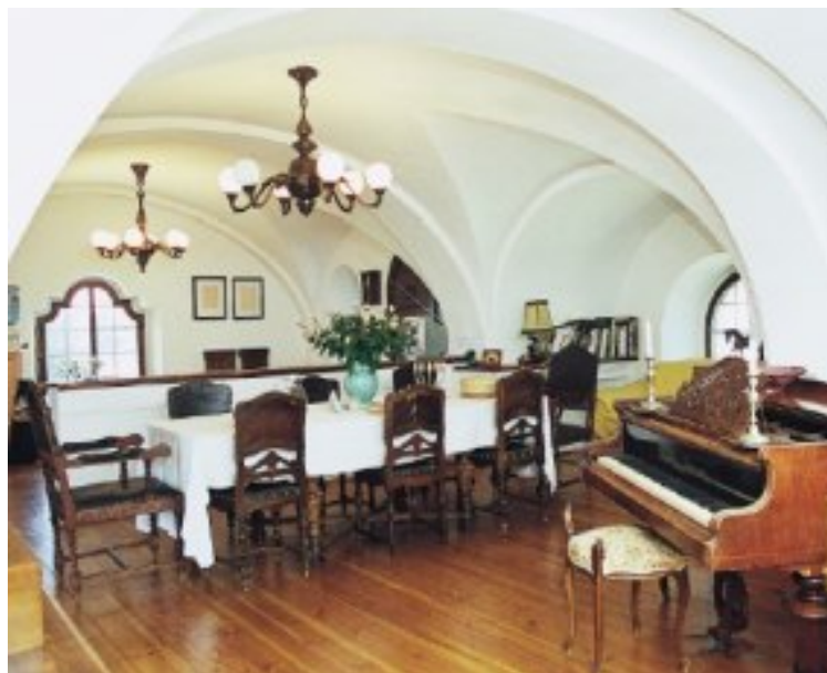
Obrázek 16 Interiér kostela