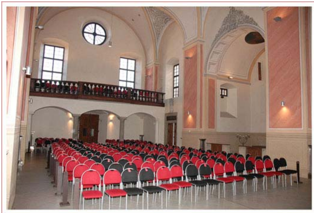
Obr. 4 Interiér kostela sv. Antonína