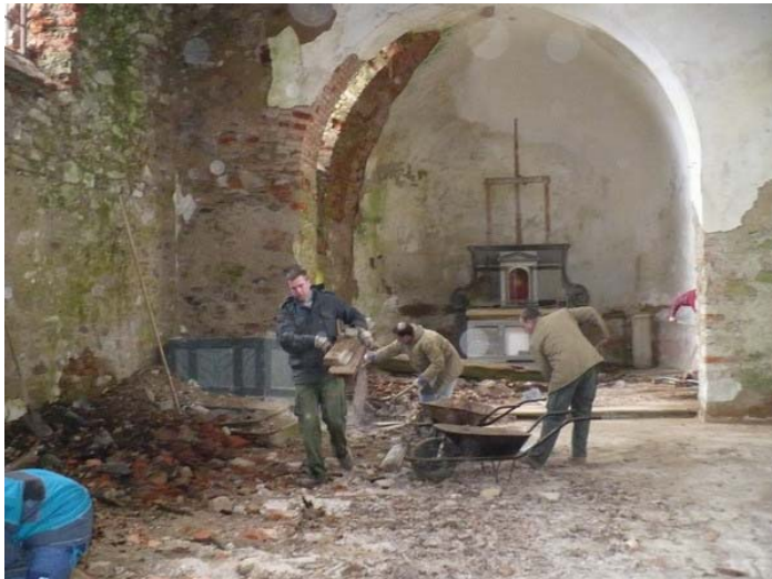
Obr. 6 Interiér kostela duben 2008