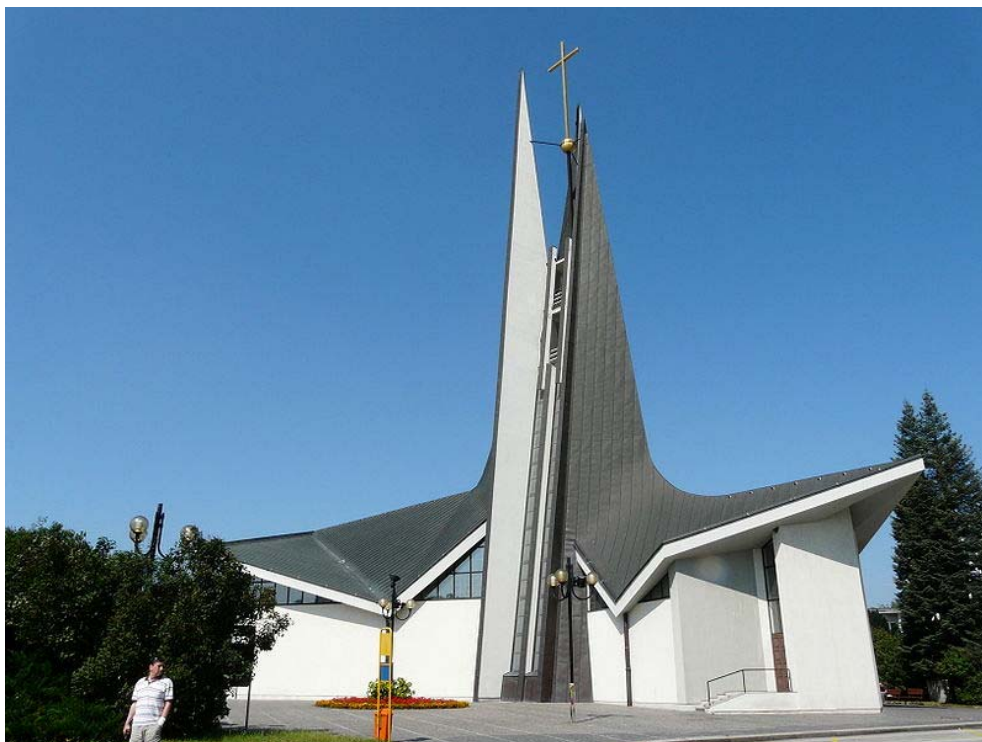
Obr. 17 Kostel sv.Václava