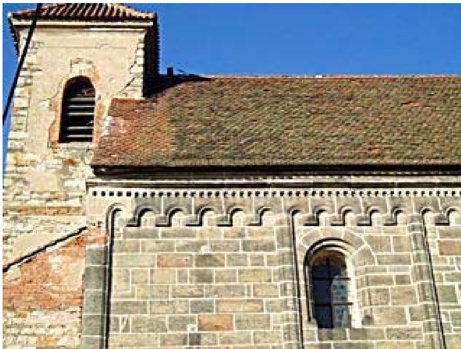
Obr. 12 Kostel před rekonstrukcí