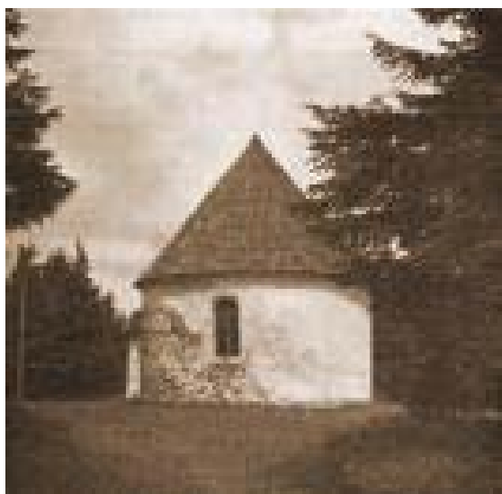
Obr. 8 Fotografie kaple z roku 1939