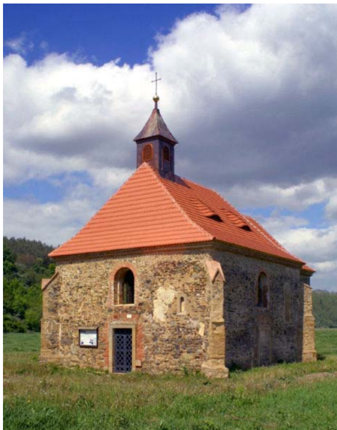
Obr. 2 Kostel po rekonstrukci v roce 2006