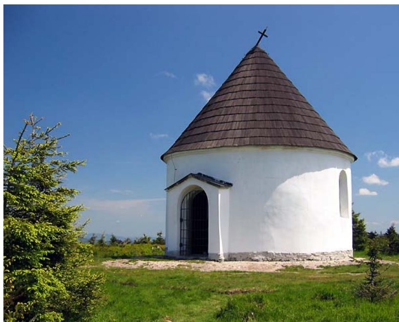
Obr. 10 Kaple po rekonstrukci v roce 2005