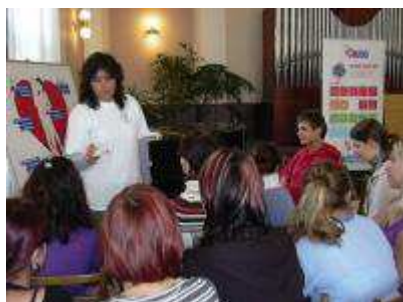
Obrázek 15 Přednáška Hrou proti AIDS v rámci Dnů zdraví, Litoměřice 2008