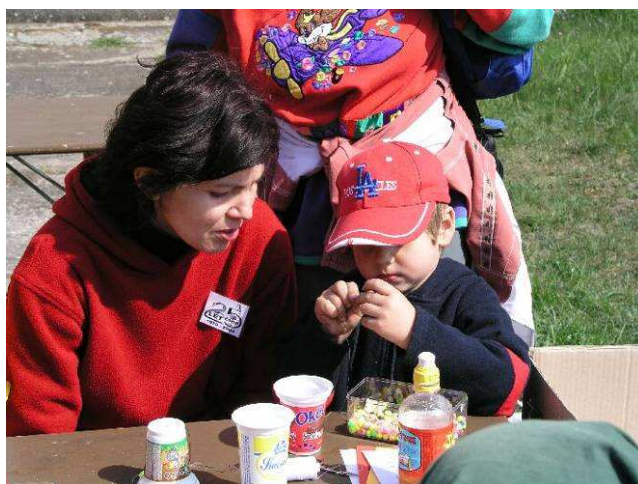
Obrázek 8 Výroba dárků z odpadu v rámci Dne Země, Mladá Boleslav