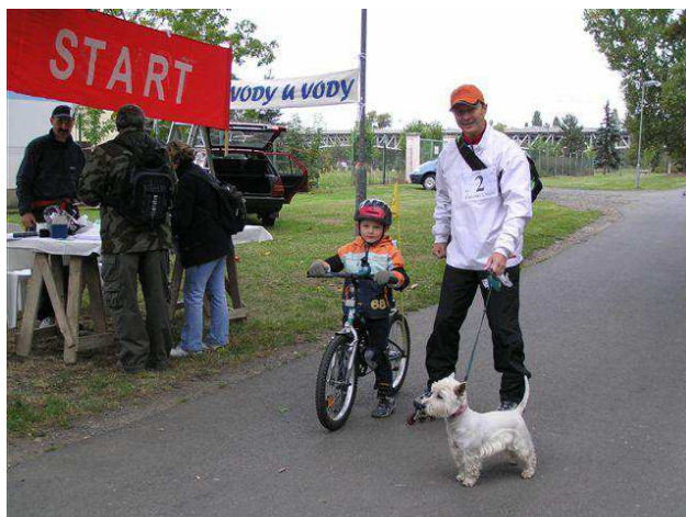
Obrázek 13 Závody u vody v rámci Evropské dne bez aut, Litoměřice 2008

„Můj oblíbený dopravní prostředek|“ – 10osob, Promítání Červený blesk – 32 osob)