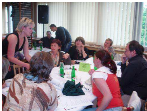
Obrázek 16 Komunitní plánování, Litoměřice 2008

• Fórum Zdravého města Litoměřice aneb Desatero problémů Litoměřic: Dne 22. 05. 2008 proběhla v prostorách Centrální školní jídelny další akce pro veřejnost: „Desatero problémů Litoměřic“ - veřejné projednání Plánu zdraví a kvality života (Akčního plánu rozvoje 2008 – 2009). S výstupy z Fóra Zdravého města bylo seznámeno Zastupitelstvo města dne 26. 6. 2008. Zastupitelstvo doporučilo Radě Města pověřit řešením formulovaných problémů jednotlivé zainteresované odbory městského úřadu a komisi „Zdravého města a MA 21“ a dále pověřilo Oddělení projektů a strategií implementací formulovaných problémů do aktuální verze strategického plánu a jeho akčního plánu - Plánu zdraví a kvality života. Veřejné projednávání rozvojového dokumentu se zúčastnilo pouze 96 osob. Toto číslo město ve své výroční zprávě neuvádí. Dle názoru autora by měla být účast vyšší v souvislosti s důležitostí daného dokumentu.