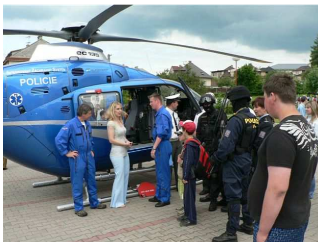
Obrázek 4 Den proti úrazům - Bezpečné prázdniny, Hlinsko 23. 7. 2008 - zapojení dospělých

Zdroj: < http://www.hlinsko.cz/fotogalerie?id=13&strana=1 >.