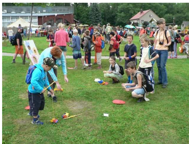
Obrázek 2 Den proti úrazům - Bezpečné prázdniny, Hlinsko 23. 7. 2008 – zapojení dětí

Níže jsou uvedeny fotografie ze Dne proti úrazům – Bezpečné prázdniny. Město Hlinsko má tyto fotografie na svých stránkách uveřejněny i když pro něj, pro „Zájemce“, nejsou stanovena žádná podmínky pro dokazování realizace akcí. Z obrázků je patrné, že byly zapojeny všechny věkové kategorie obyvatel.