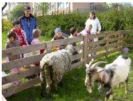
Obrázek 11 Den Země v Litoměřicích, 2008