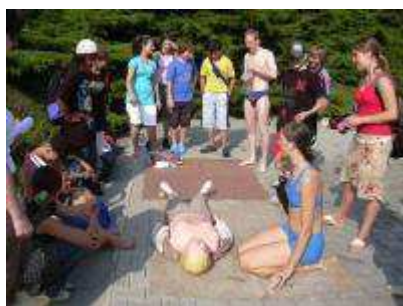
Obrázek 10 Akce v rámci Národních dnů bez úrazu, Litoměřice 2008