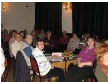
Obrázek 9 Komunitní plánování veřejnosti - Mladá Boleslav 12. 11. 2008

V roce 2008 bylo v Mladé Boleslavi realizováno šestnáct akcí se zapojením veřejnosti. Z kvantitativního hlediska je tento počet nižší, než u Poděbrad, které patří do nižší kategorie v rámci databáze MA21.