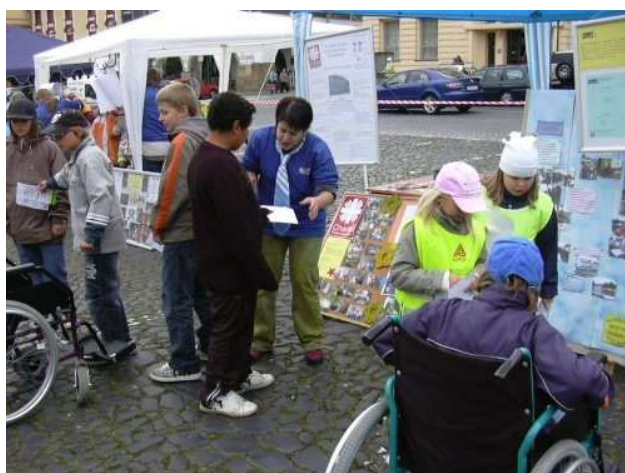
Obrázek 14 Evropský týden mobility, Litoměřice, 2008