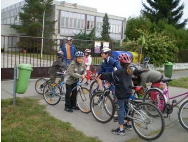
Obrázek 6 Rodinný výlet, akce pořádaná v rámci Evropského týdne mobility