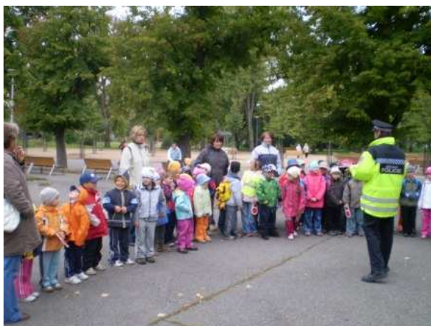
Obrázek 5 Děti a Městská policie, akce pořádané v rámci Evropského týdne mobility