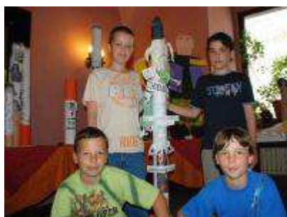
Obrázek 12 Vítězné soutěže o vytvoření cigaretové makety v rámci Světového dne bez tabáku, Litoměřice, 2008

• Světový den bez tabáku – Kampaň " Světový den bez tabáku " patří mezi největší akce zaměřené na problematiku kouření a jeho prevenci. Oficiálním termínem kampaně je 31. květen, v Litoměřicích proběhla kampaň v měsíci červnu. Cílem akce bylo s pomocí ZŠ a Speciálních škol zvýšit povědomí o negativních účincích kouření ve všech jeho podobách jak u dětí, mládeže, tak i dospělé populace. Město Litoměřice vyhlásilo v rámci kampaně soutěž pro I. a II. stupeň ZŠ a Speciálních škol o nejlépe vytvořenou "cigaretovou maketu" zaměřenou na ukázkou následků kouření na lidské zdraví. Děti vytvořená díla byla posuzována vybranou komisí a dále vystavována v zařízení Města Litoměřice. Kolektiv, který zpracoval nejlepší maketu, byl odměněn věcnými cenami. V rámci kampaně dále proběhly na Gymnáziu, Střední odborné škole a Středním odborném učilišti, o. p. s. Litoměřice dne 22. května 2008 besedy společnosti České koalice proti tabáku . Tyto akce město masivně inzerovalo a to přes media, kabelovou televizi, na internetu a v regionálních tiskovinách.