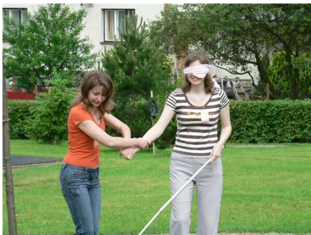
Obrázek 3 Den proti úrazům - Bezpečné prázdniny, Hlinsko 23. 7. 2008 – zapojení mládeže

Zdroj: < http://www.hlinsko.cz/fotogalerie?id=13&strana=1 >.