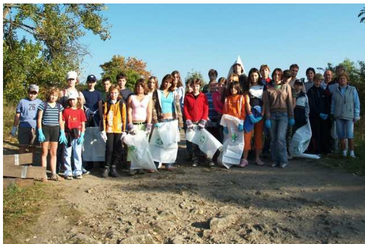
Obrázek 7 Úklid chráněné oblasti Radouč v rámci Dne Země, Mladá Boleslav

pro veřejnost zdarma. Počet akcí autorka práce vyčíslil na čtrnáct. Na následující straně jsou uvedeny fotografie z některých z akcí.