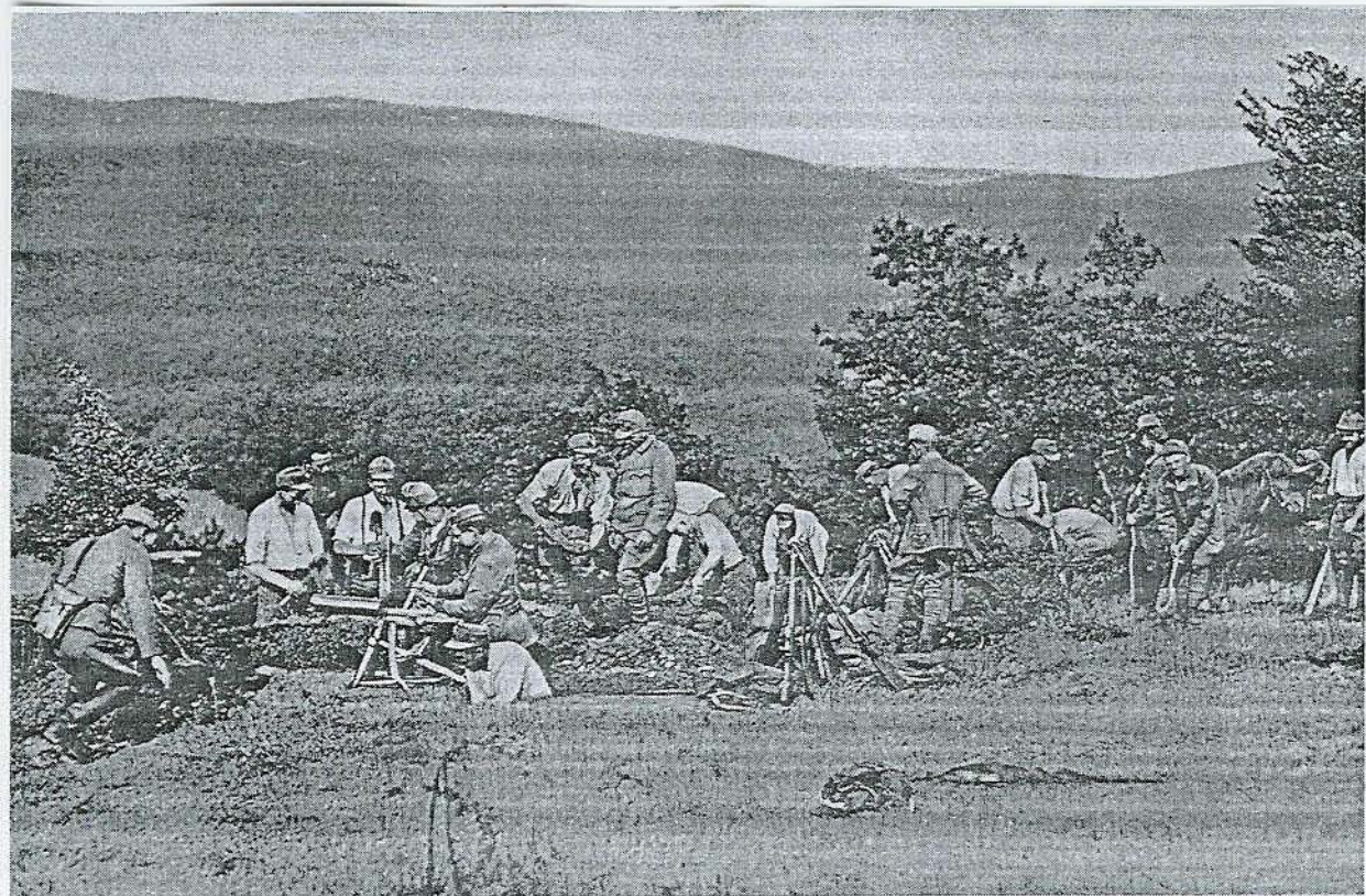
Příloha č. 4 Baterie italských legionářů brání Komárno před maďarskými bolševiky