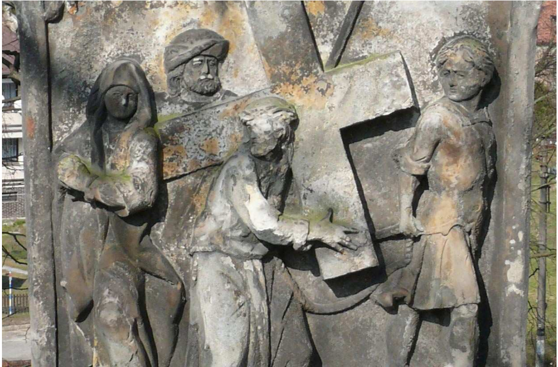
Zastavení č. IV ve Stárkově - detail