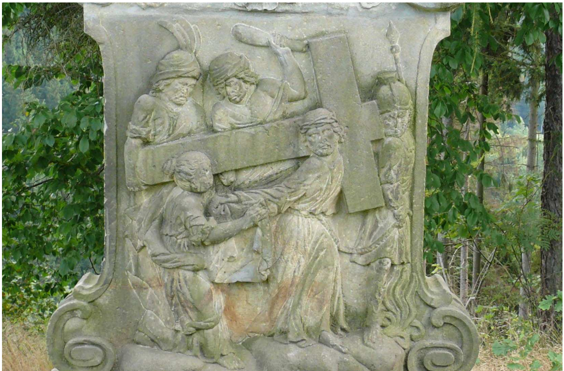
Zastavení č. VI ve Stárkově

Zde můžeme pozorovat problémy autora s rozdělením jednotlivých prostorových plánů, které jsou společnými znaky pro obě křížové cesty.