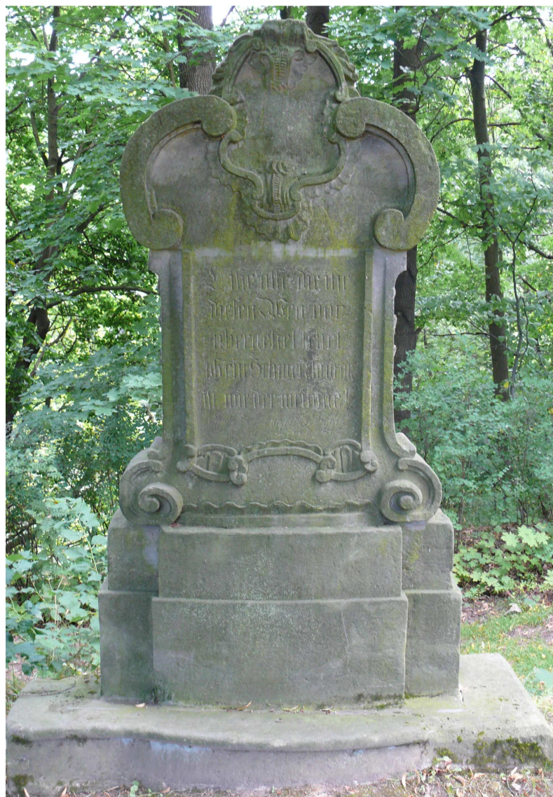
Panel s úvodním textem uvádějící křížovou cestu ve Stárkově