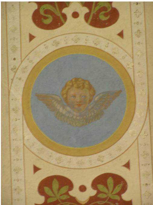
Obr.3 Kostel Sv. Kateřiny (detail dekorativní výzdoby)