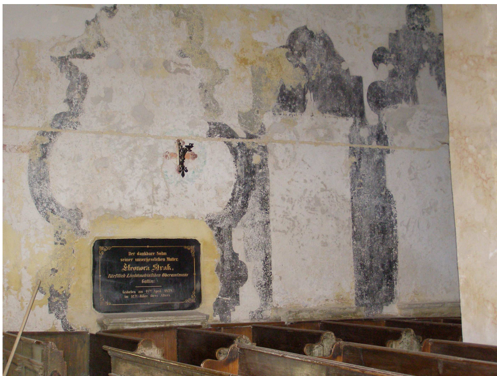
Obr.15 Hřbitovní kostel Nalezení Sv. Kříže (zbytky starších maleb nalezených v hlavní lodi)