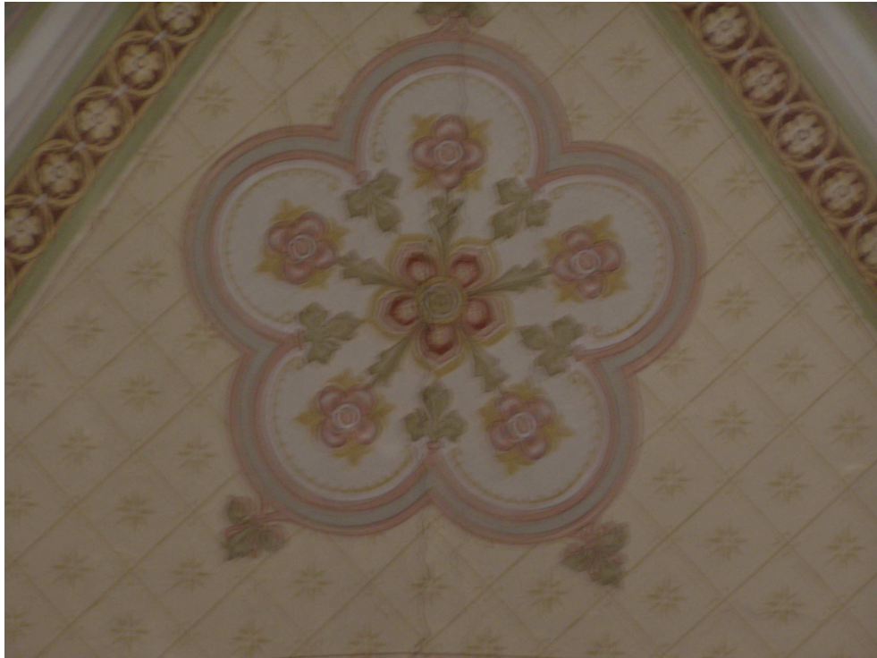
Obr.22 Kostel sv. Josefa (detail nástěnné malby z konce 19. století)