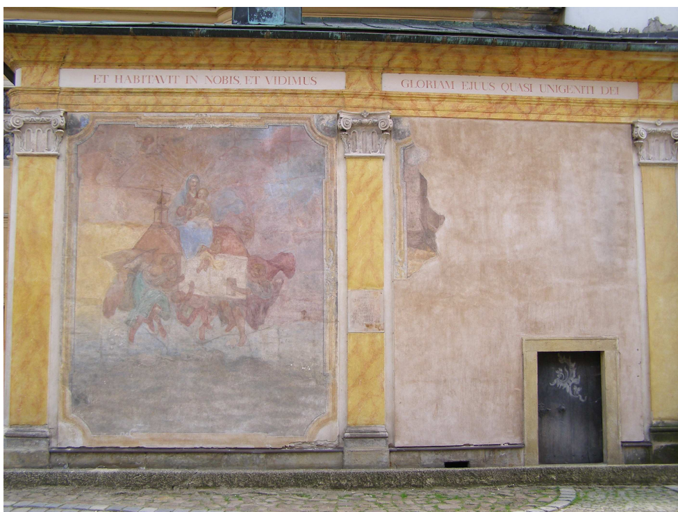
Obr.39 Moravská Třebová, Loretánská kaple (pohled na severní stěnu)