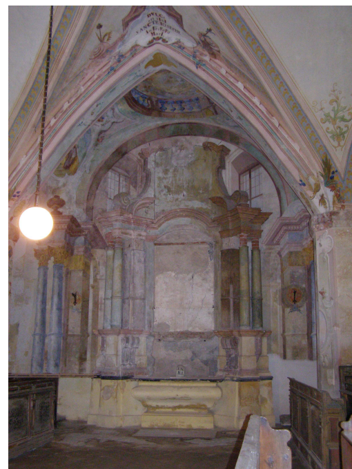
Obr.13 Hřbitovní kostel Nalezení Sv. Kříže (pohled na iluzivně malovaný oltář Sv. Josefa)