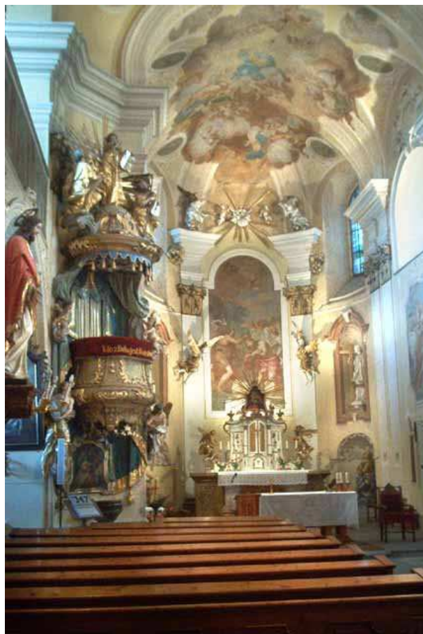
Obr.34 Křenov, kostel sv. Jana Křtitele (pohled do lodi)