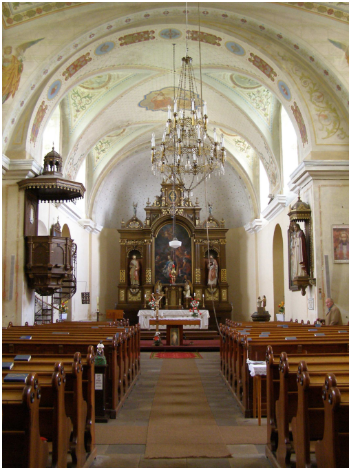
Obr.1 Staré Město, kostel Sv. Kateřiny (pohled do lodi)