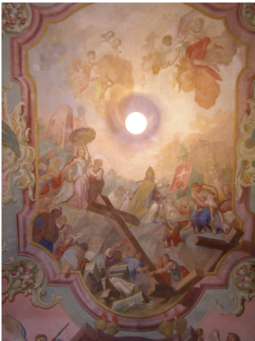
Obr.10 Hřbitovní kostel Nalezení Sv. Kříže (pohled na nástropní malbu v presbyteriu)