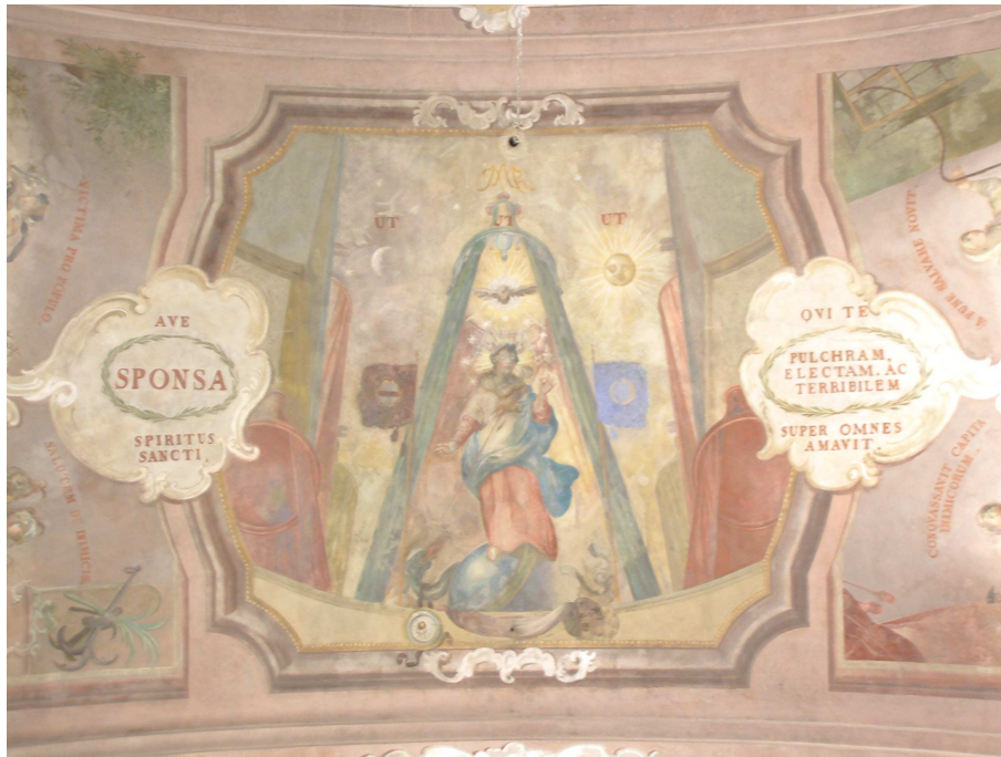
Obr.32 Farní kostel Nanebevzetí Panny Marie (pohled na klenbu v hlavní lodi)