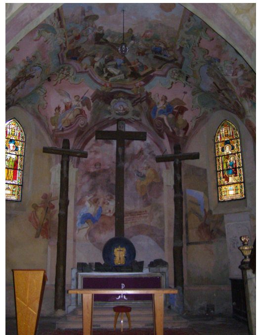
Obr.8 Moravská Třebová, hřbitovní kostel Nalezení Sv. Kříže (pohled do presbyteria)