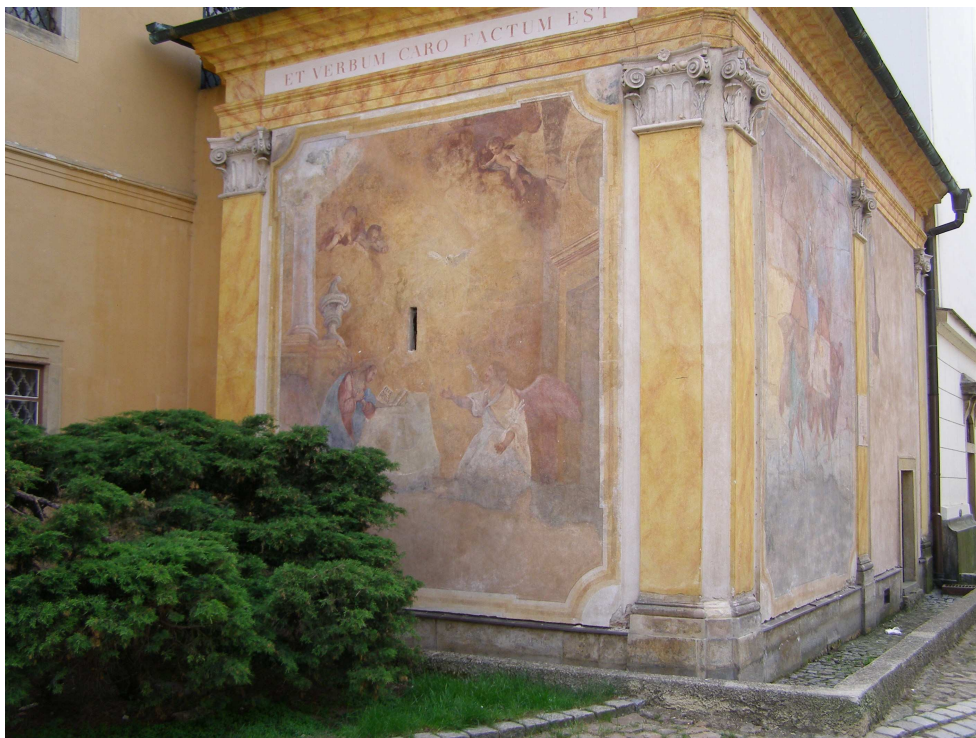
Obr.38 Moravská Třebová, Loretánská kaple (celkový pohled)