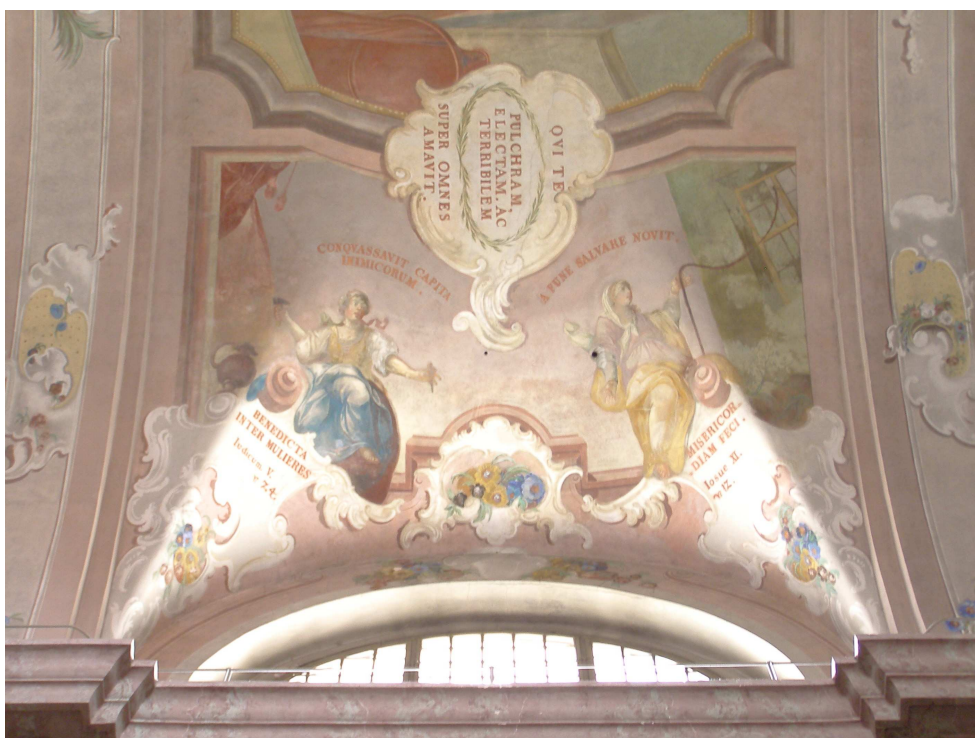
Obr.29 Farní kostel Nanebevzetí Panny Marie (pohled do klenební výseče v hlavní lodi)