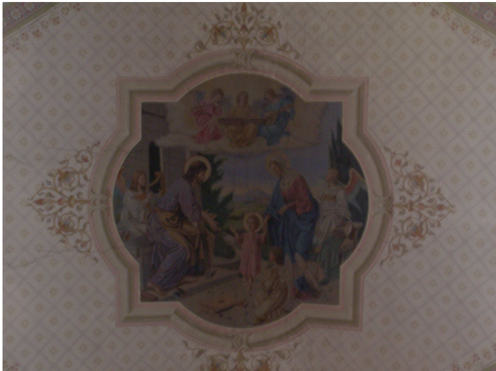
Obr.23 Kostel sv. Josefa (detail nástěnné malby z konce 19. století)