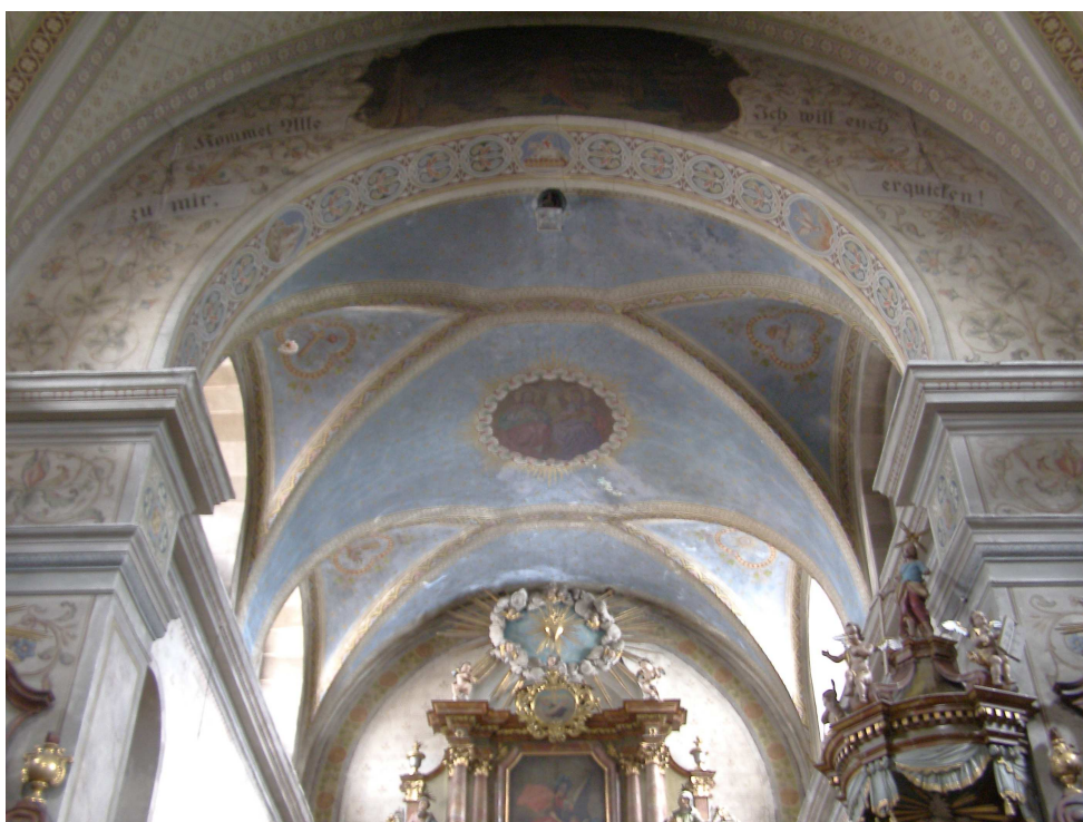
Obr.19 Kostel s. Josefa (pohled do presbytáře)