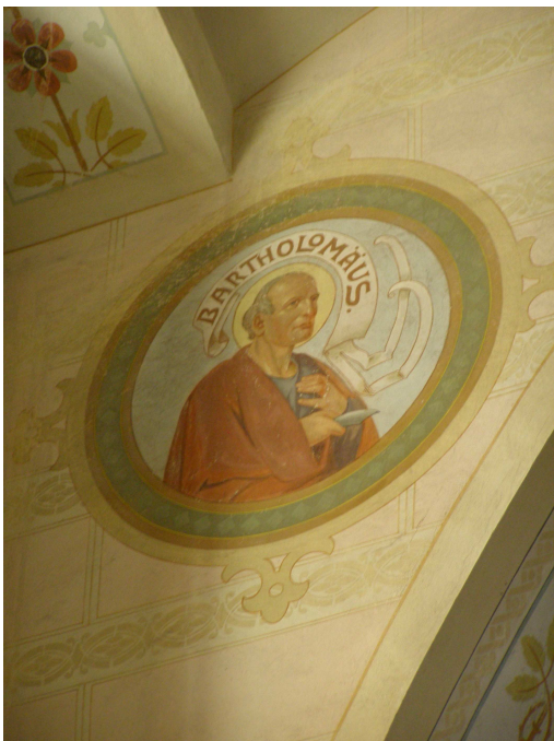
Obr.7 Kostel Sv. Kateřiny (detail-apoštol)