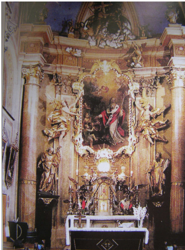
Obr.36 Rychnov, kostel sv. Mikuláše (presbytář)