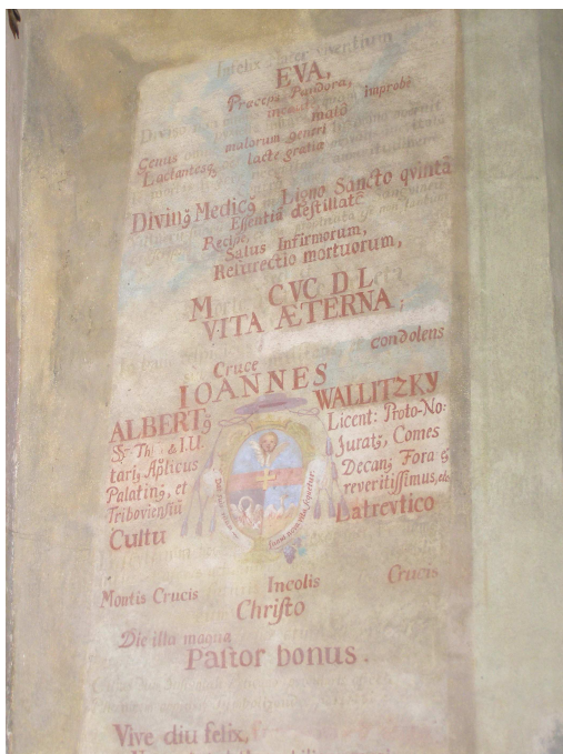
Obr.12 Hřbitovní kostel Nalezení Sv. Kříže (detail malovaného epitafu na vítězném oblouku)