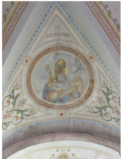
Obr.4 Kostel Sv. Kateřiny (detail výmalby-církevní otec)