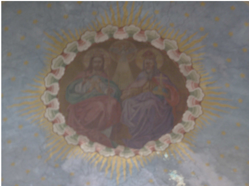
Obr.25 Kostel sv. Josefa (detail nástěnné malby z konce 19. století)