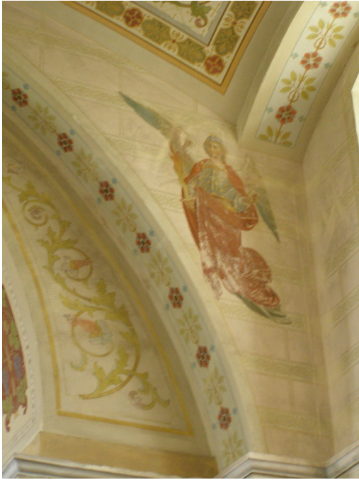
Obr.5 Kostel Sv. Kateřiny (detail-archanděl Michael)