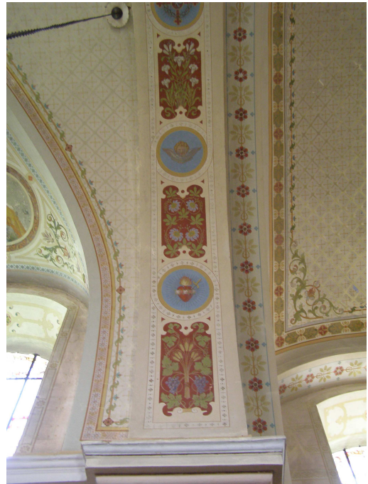
Obr.2 Kostel Sv. Kateřiny (detail dekorativní výzdoby)