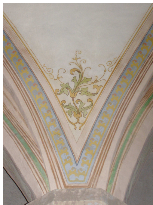
Obr.17 Hřbitovní kostel Nalezení Sv. Kříže (detail dekorativní nástěnné malby)