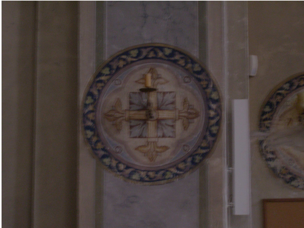
Obr.24 Kostel sv. Josefa (detail nástěnné malby z konce 19. století)