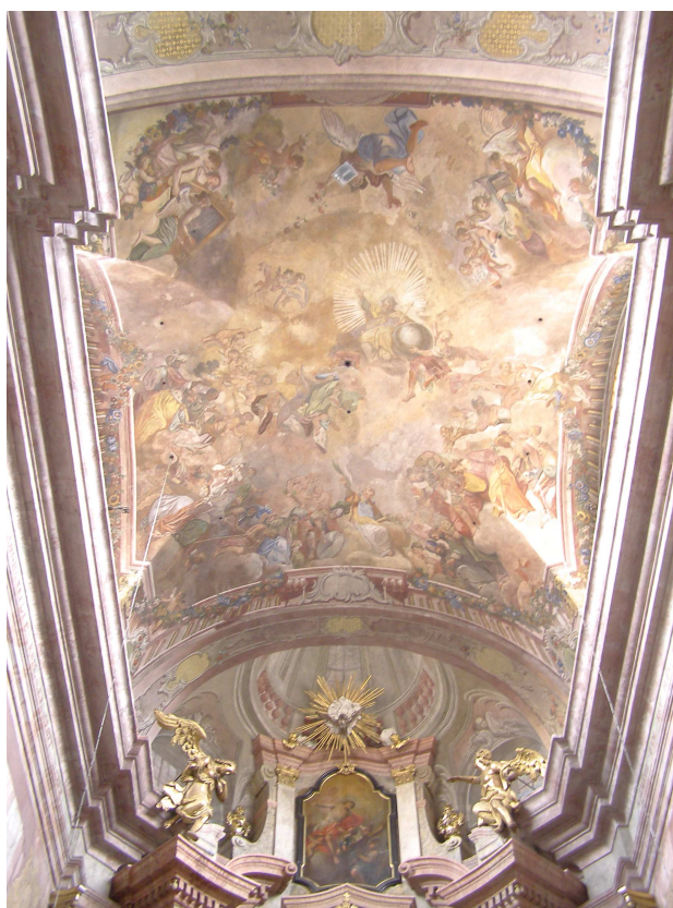
Obr.31 Farní kostel Nanebevzetí Panny Marie (pohled na klenbu presbytáře)