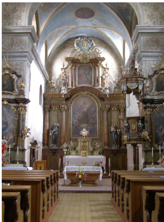
Obr.18 Moravská Třebová, kostel sv. Josefa (pohled do lodi)