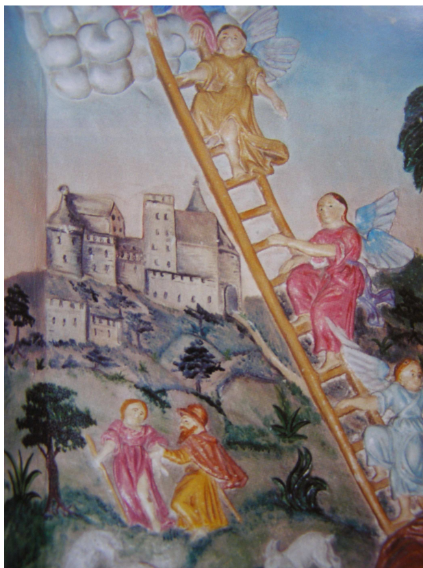
Obr.37 Kunčina, kostel sv. Jiří (malovaný renesanční reliéf)