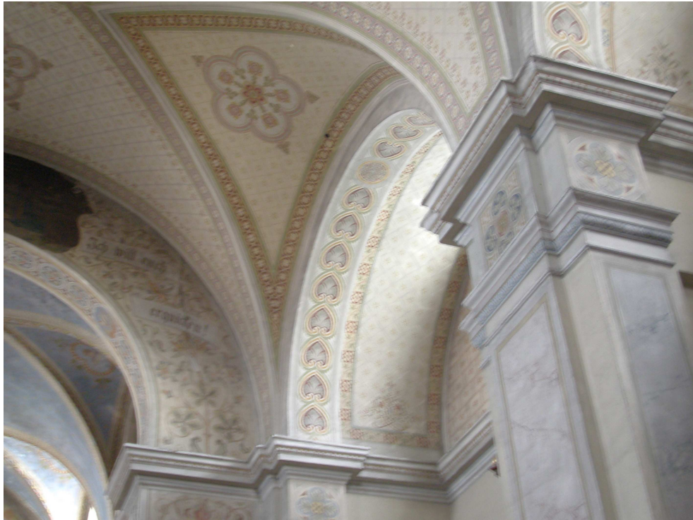
Obr.20 Kostel sv. Josefa (dekorativní nástěnná malba z konce 19. století)