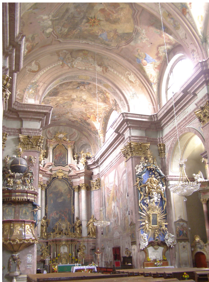
Obr.26 Moravská Třebová, farní kostel Nanebevzetí Panny Marie (pohled do presbytáře)