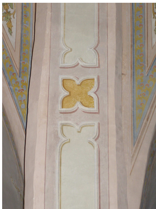
Obr.16 Hřbitovní kostel Nalezení Sv. Kříže (detail dekorativní nástěnné malby)