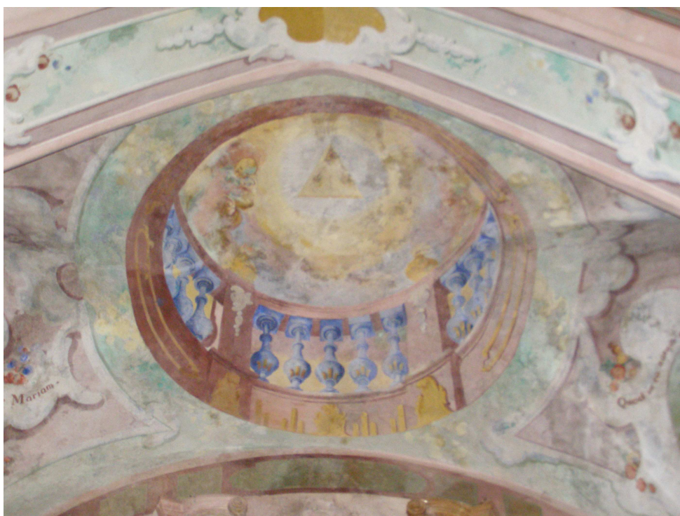
Obr.14 Hřbitovní kostel Nalezení Sv. Kříže (detail iluzivní malby oltáře Sv. Josefa v hlavní lodi)