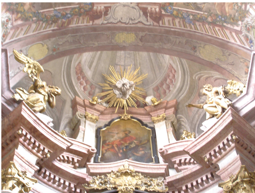
Obr.28 Farní kostel Nanebevzetí Panny Marie (pohled na iluzivní průhled klenbou v presbytáři)