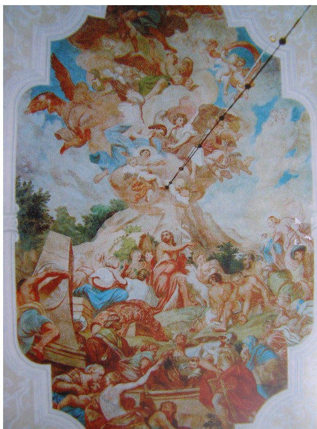
Obr.35 Kostel sv. Jana Křtitele (pohled na klenbu)