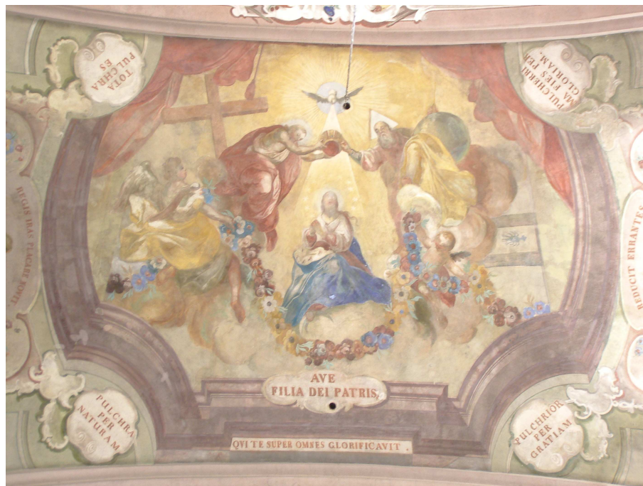
Obr.33 Farní kostel Nanebevzetí Panny Marie (pohled na klenbu v hlavní lodi)