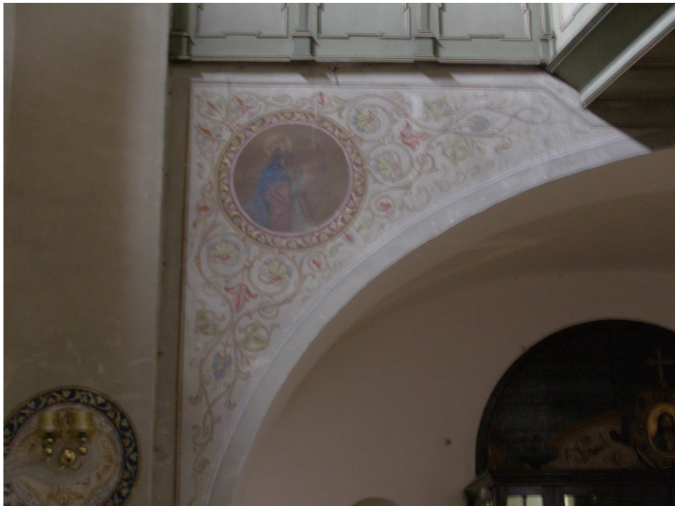
Obr.21 Kostel sv. Josefa (dekorativní nástěnná malba z konce 19. století)