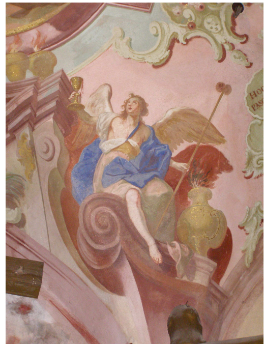
Obr.11 Hřbitovní kostel Nalezení Sv. Kříže (detail malby nad hlavním oltářem)