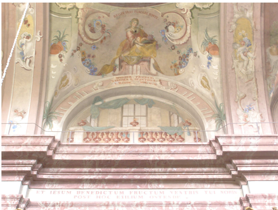
Obr.30 Farní kostel Nanebevzetí Panny Marie (pohled na klenební pole v hlavní lodi)