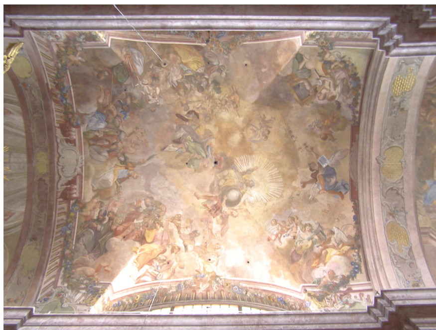
Obr.27 Farní kostel Nanebevzetí Panny Marie (pohled do klenby presbytáře)